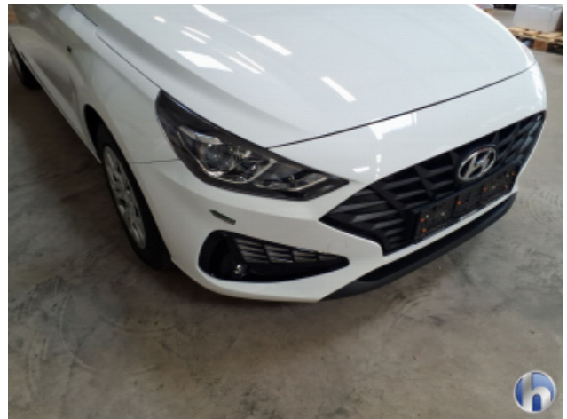
2. Stoßfänger Vorne Gebrauchsspuren - Ohne Reparatur