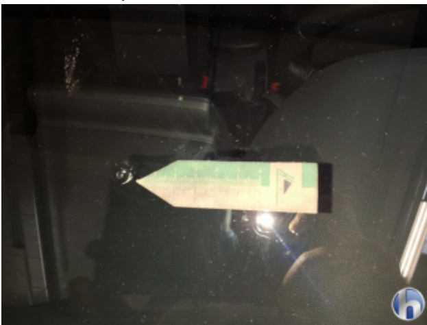
5. Windschutzscheibe Steinschlag - Erneuern