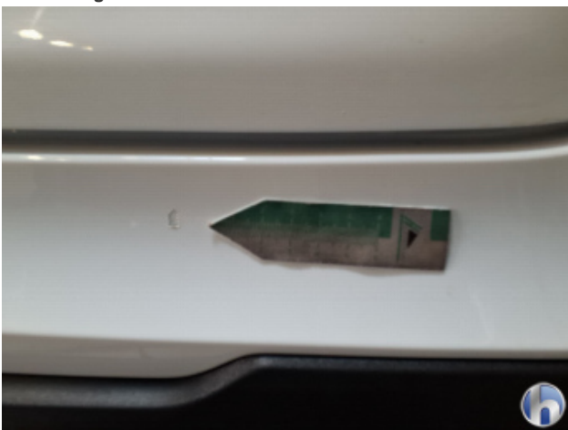
6. Stoßfänger Hinten Kratzer - Smart Repair