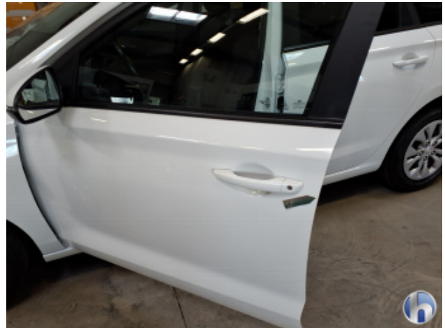
3. Tür Vorne - Links Kratzer - Smart Repair