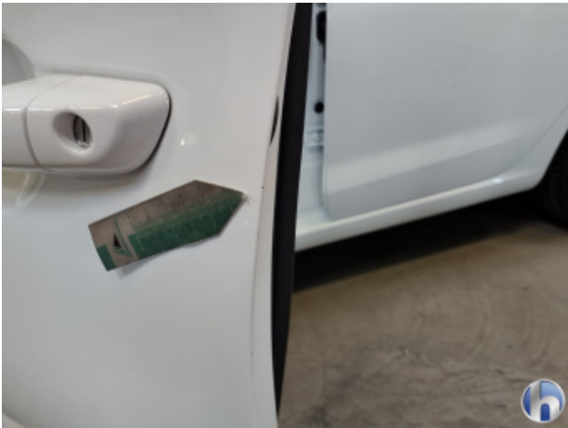
3. Tür Vorne - Links Kratzer - Smart Repair