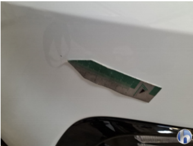
2. Stoßfänger Vorne Gebrauchsspuren - Ohne Reparatur