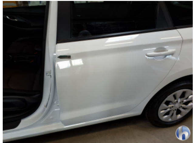
4. Tür Hinten - Links Kratzer - Smart Repair