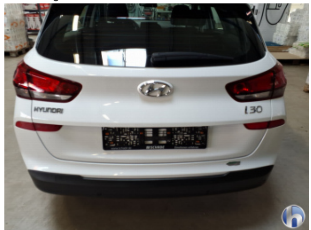
6. Stoßfänger Hinten Kratzer - Smart Repair