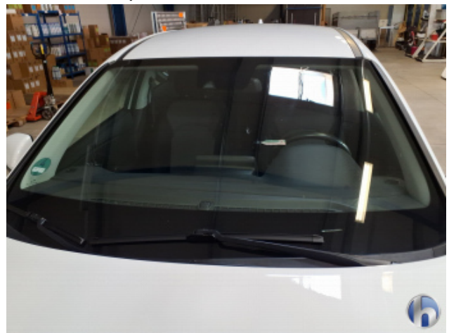
5. Windschutzscheibe Steinschlag - Erneuern