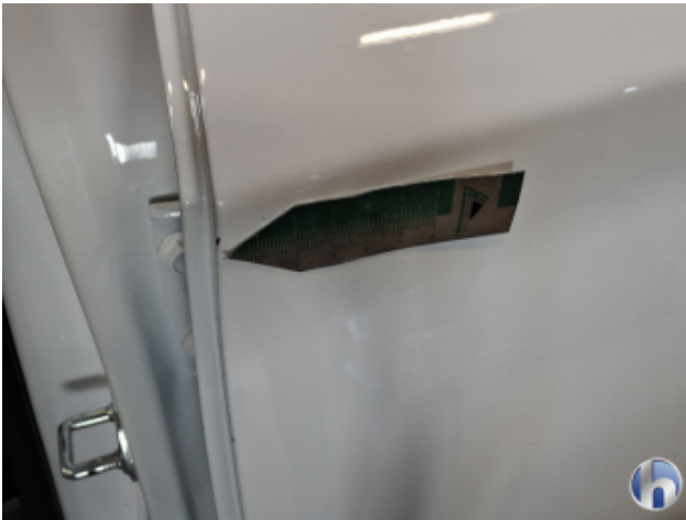
4. Tür Hinten - Links Kratzer - Smart Repair