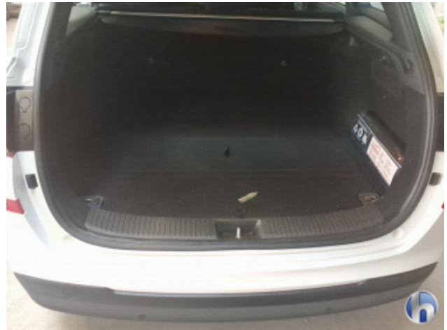
7. Innenraum Verschmutzt (leicht) - Reinigen