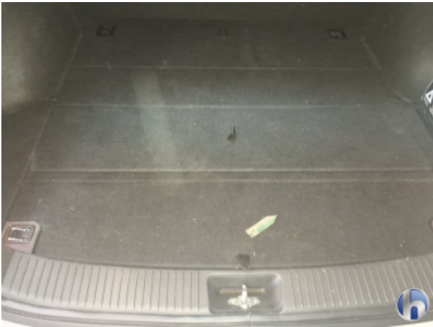
7. Innenraum Verschmutzt (leicht) - Reinigen