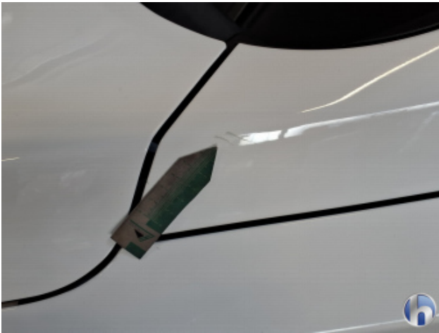
1. Kotflügel Vorne - Links Oberflächenkratzer - Aufbereiten / Polieren