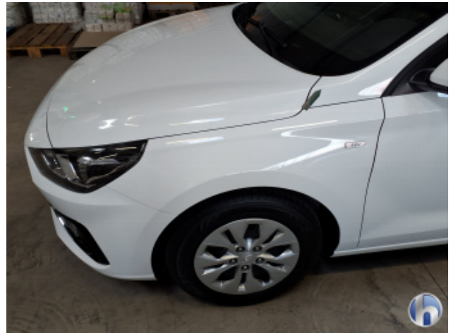
1. Kotflügel Vorne - Links Oberflächenkratzer - Aufbereiten / Polieren