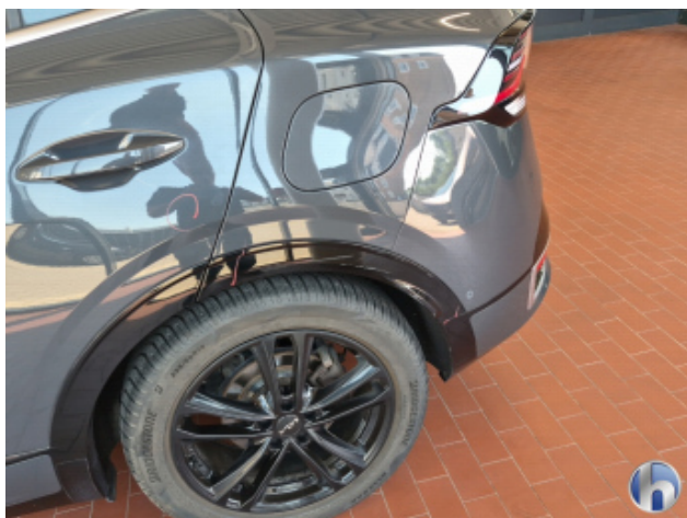
1. Seitenwand - Hinten - Links Abschürfung - Smart Repair