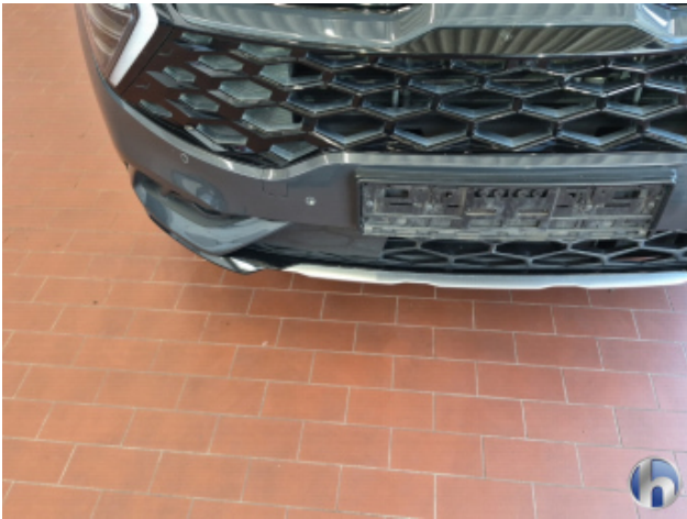
5. Stoßfänger Vorne Lackabplatzer - Smart Repair