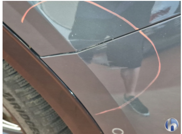
3. Stoßfänger Vorne Abschürfung - Smart Repair