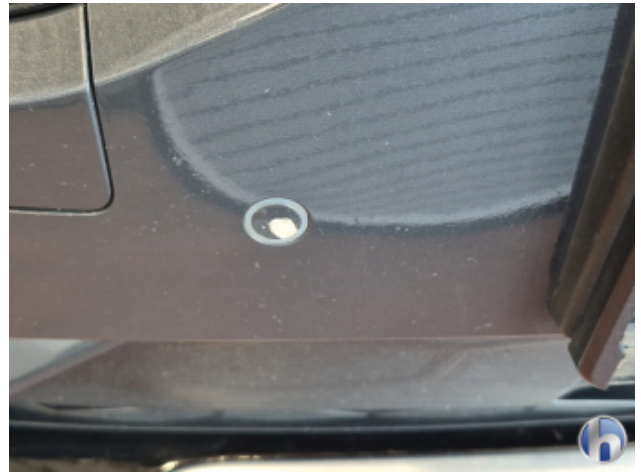
5. Stoßfänger Vorne Lackabplatzer - Smart Repair