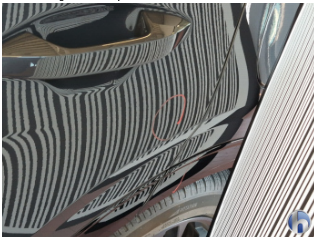
2. Tür Hinten - Links 1 Delle - Sanft Instandsetzen