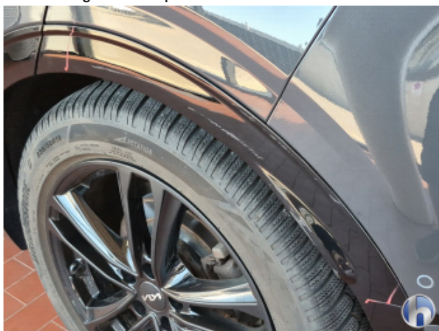
1. Seitenwand - Hinten - Links Abschürfung - Smart Repair