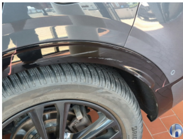
1. Seitenwand - Hinten - Links Abschürfung - Smart Repair