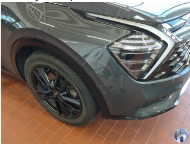
4. Kotflügel Vorne - Rechts Abschürfung - Smart Repair