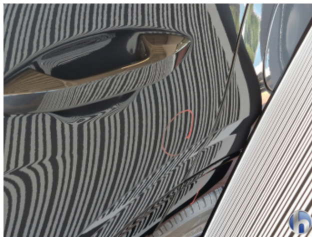
2. Tür Hinten - Links 1 Delle - Sanft Instandsetzen