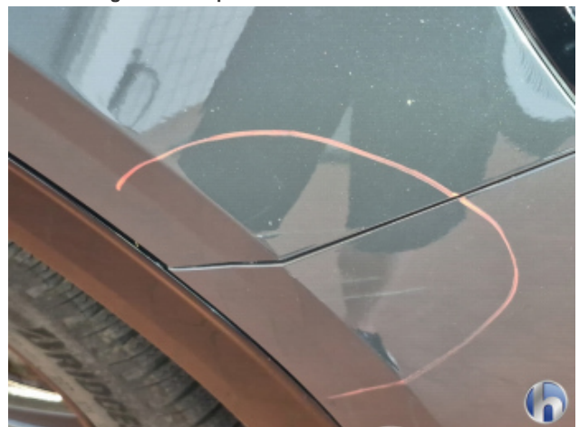
4. Kotflügel Vorne - Rechts Abschürfung - Smart Repair