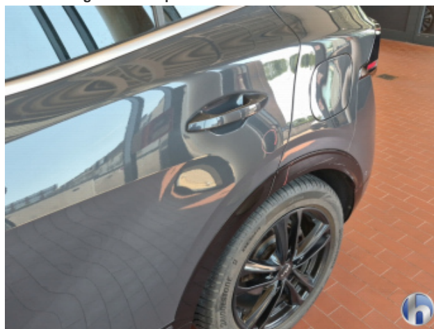
2. Tür Hinten - Links 1 Delle - Sanft Instandsetzen