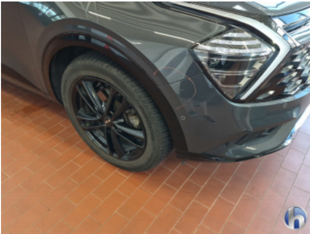
3. Stoßfänger Vorne Abschürfung - Smart Repair