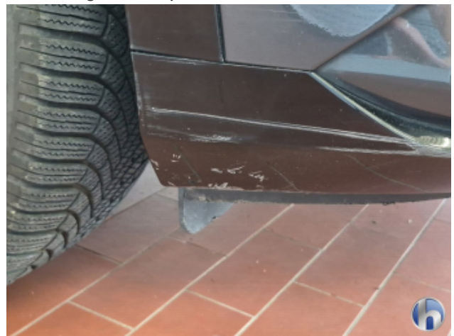
3. Stoßfänger Vorne Abschürfung - Smart Repair