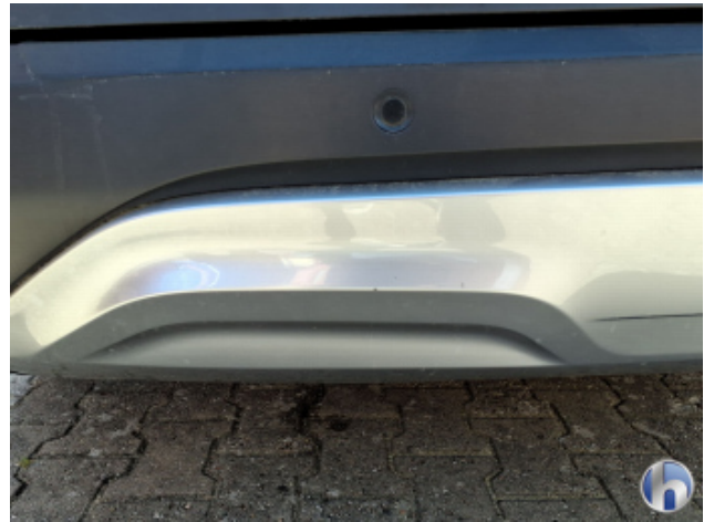
1. Stoßfänger Hinten Kratzer - Smart Repair