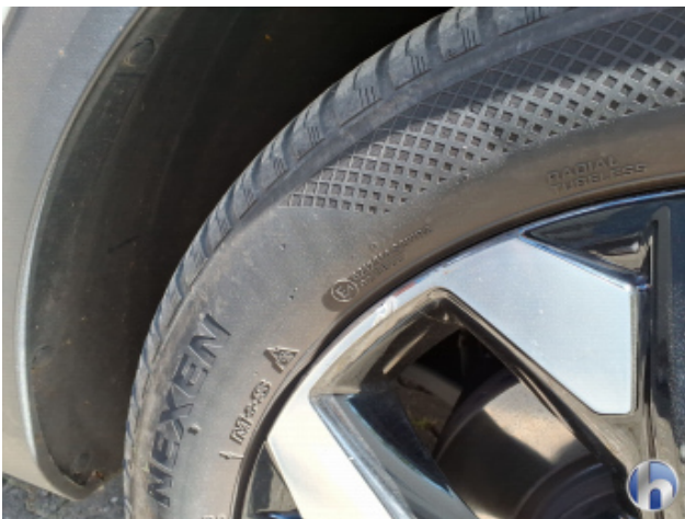
2. Felge Vorne - Rechts Kratzer - Smart Repair