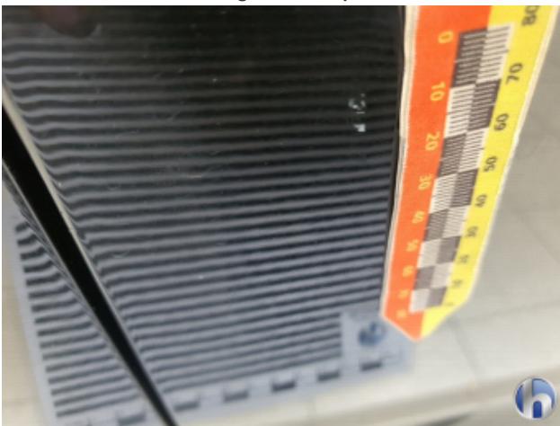
4. Tür Vorne - Rechts Kratzer Tief Bis Grundierung - Smart Repair