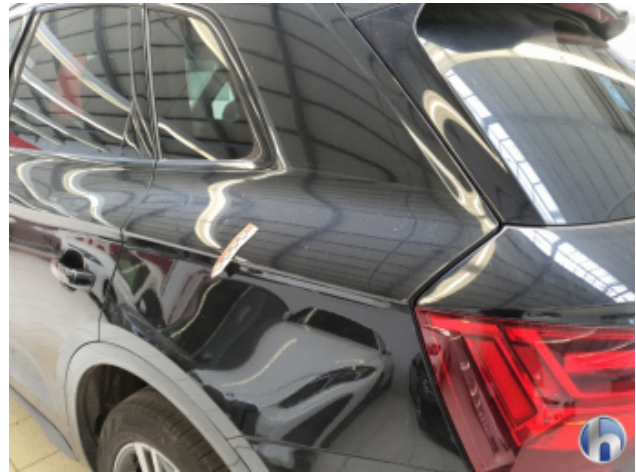
2. Seitenwand - Hinten - Links Kratzer - Lackieren