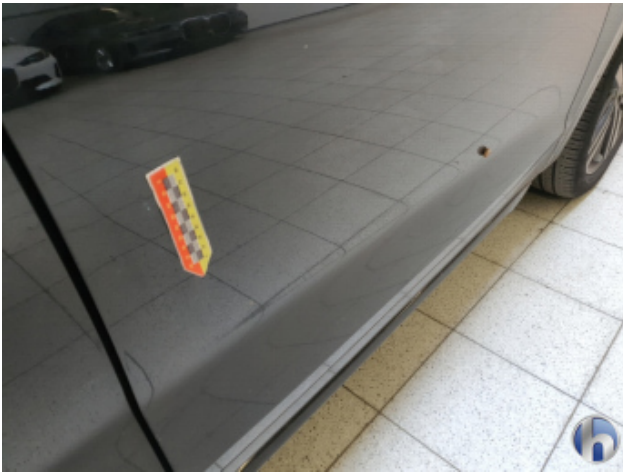
4. Tür Vorne - Rechts Kratzer Tief Bis Grundierung - Smart Repair