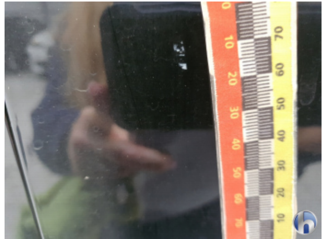
4. Tür Vorne - Rechts Kratzer Tief Bis Grundierung - Smart Repair