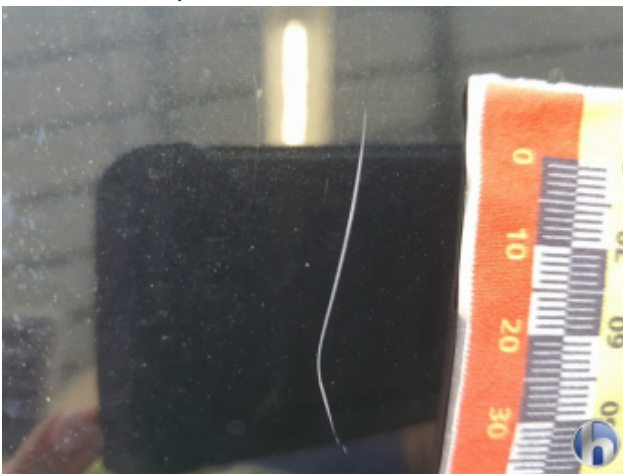
2. Seitenwand - Hinten - Links Kratzer - Lackieren