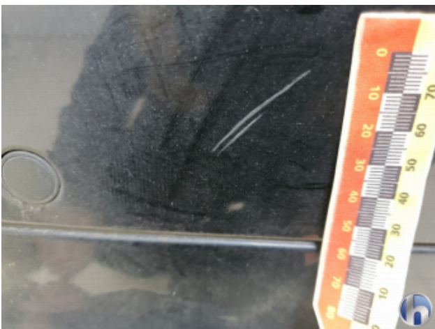
3. Stoßfänger Hinten Oberflächenkratzer - Aufbereiten / Polieren