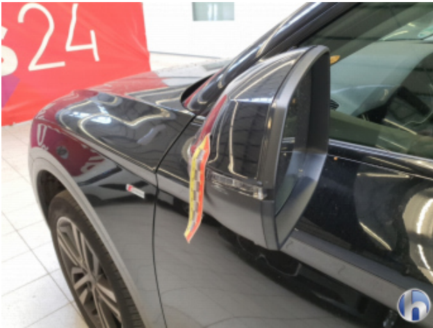
1. Außenspiegel Gehäuse - Links Kratzer - Smart Repair