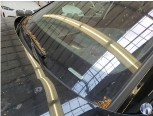
5. Fahrzeug Verschmutzt - Reinigen