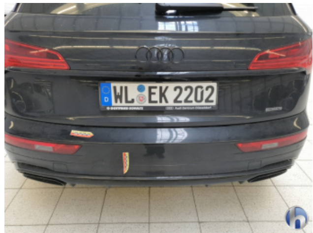
3. Stoßfänger Hinten Oberflächenkratzer - Aufbereiten / Polieren