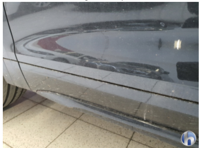
5. Fahrzeug Verschmutzt - Reinigen