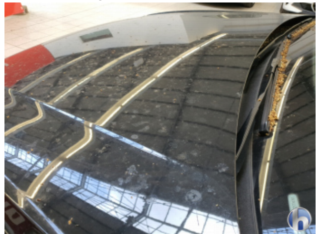
5. Fahrzeug Verschmutzt - Reinigen