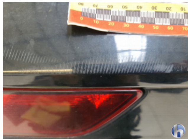
3. Stoßfänger Hinten Oberflächenkratzer - Aufbereiten / Polieren