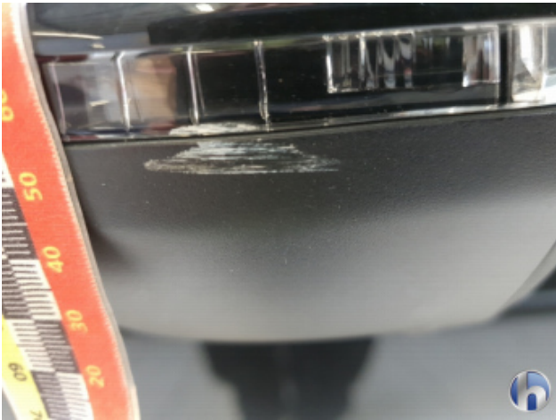
6. Blinker Beschädigt - Abdichten