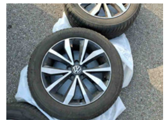
Räder - Rad beiliegend #3