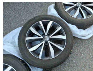
Räder - Rad beiliegend #2