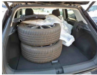
Räder - eingelegt im Fahrzeug