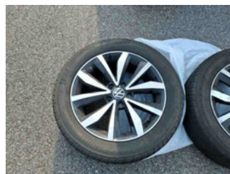
Räder - Rad beiliegend #1