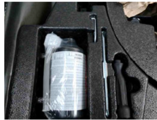
Räder - Haltbarkeitsdatum Tirefit