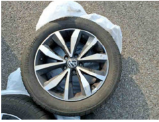
Räder - Rad beiliegend #4