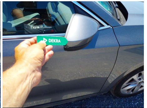
Carcasa del espejo de la puerta exterior / Derecha / Rayado