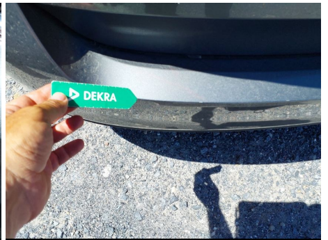
Paragolpes / Trasero / Rayado