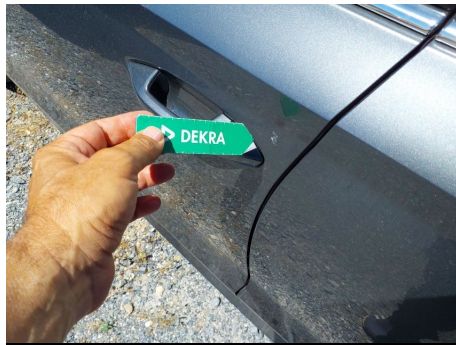
Puerta / Delantero Izquierdo / Rayado