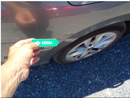
Aleta / Trasero Derecho / Rayado