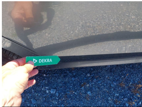
Puerta / Trasero Derecho / Rayado