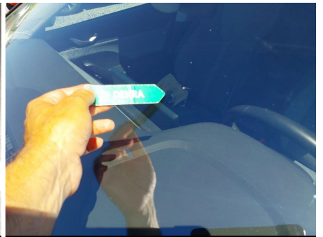
Parabrisas / - / Impacto