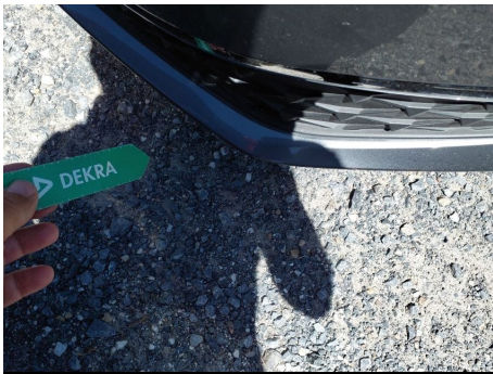
Paragolpes / Delantero / Rayado