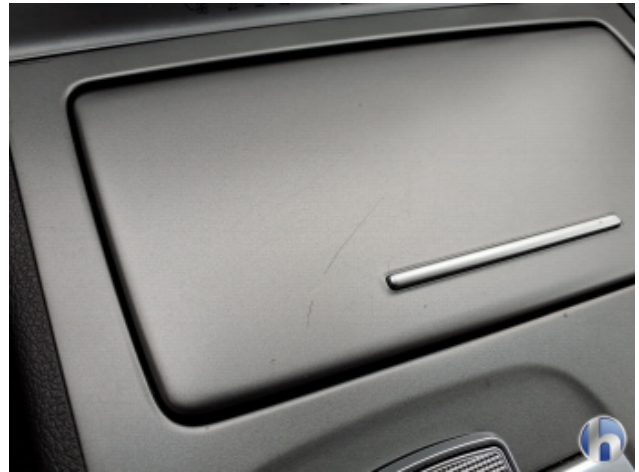
1. Mittelkonsole Innenraum vorne mitte Kratzer - Smart Repair