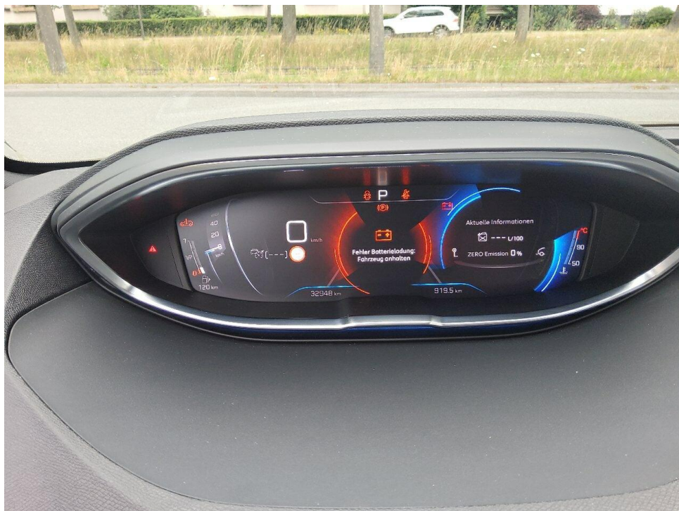
Bild 4 : Kombiinstrument (betriebsbereit) mit Km-Stand Fehler Batterieladung