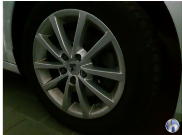
1. Felge Vorne - Rechts Kratzer - Smart Repair