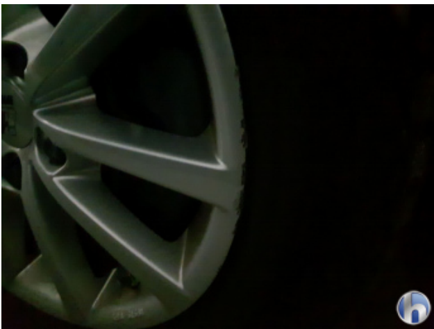
1. Felge Vorne - Rechts Kratzer - Smart Repair