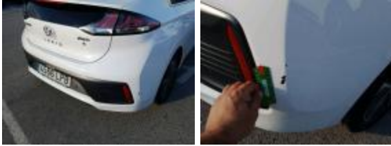
Moldura Parachoques Tras Ctro