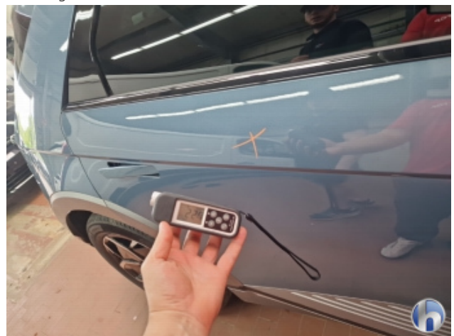
1. Tür Hinten - Rechts Nachlackiert - Ohne Reparatur