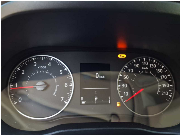
Abbildung 9: Kombiinstrument