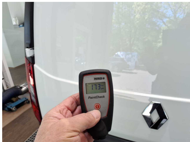
Nacklackierung 1: Heckklappe/-tür, Seitenwand rechts