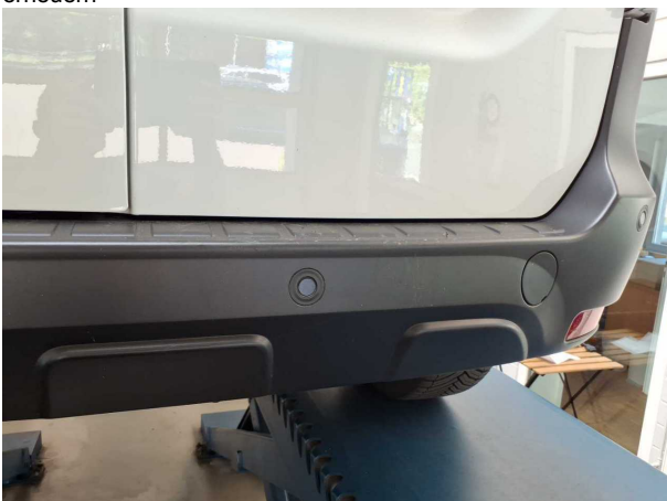
Beschädigung #3: Stossfänger hinten: Stossfänger hinten (unlackiert) - verkratzt / verschürft - Wertminderung