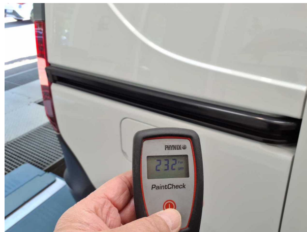
Nacklackierung 1: Heckklappe/-tür, Seitenwand rechts