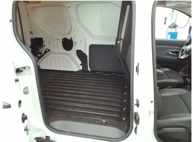
Abbildung 14: Innenraum hinten