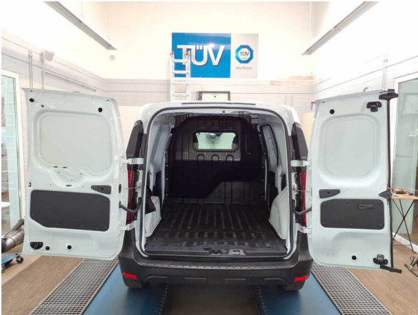
Abbildung 13: Innenraum hinten