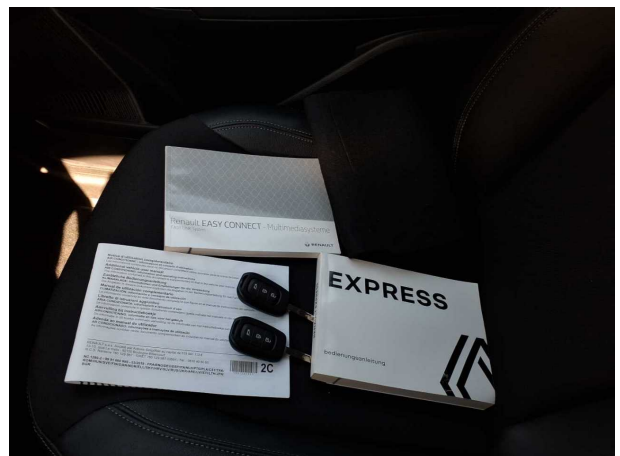
Abbildung 18: Sonstiges