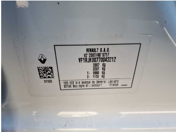
Abbildung 7: FIN