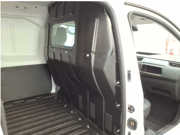
Abbildung 15: Innenraum hinten