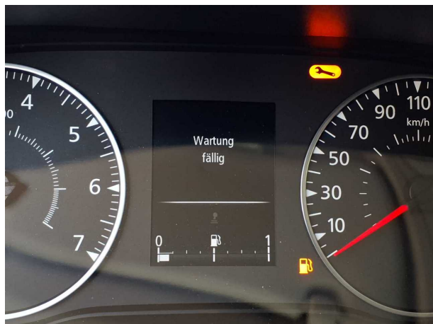
Beschädigung #4: Sonstiges: Inspektion/Wartung - fällig - durchführen