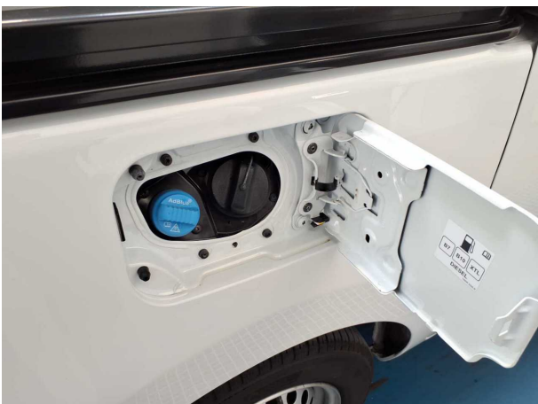
Abbildung 17: Ladebuchse/Tankstutzen