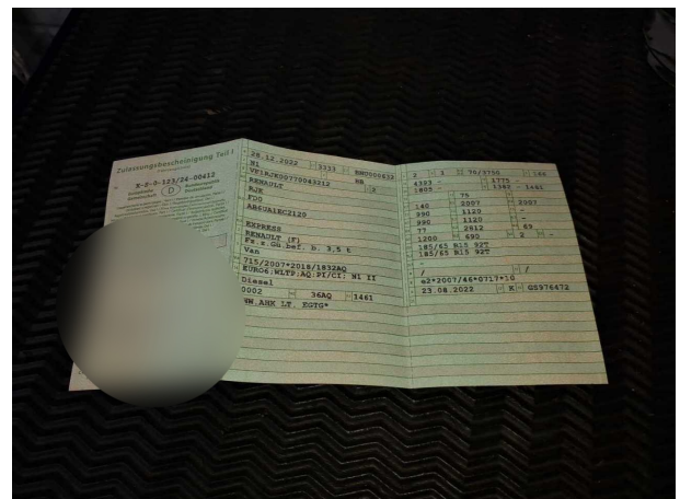
Abbildung 12: Zulassungsdocument(e)