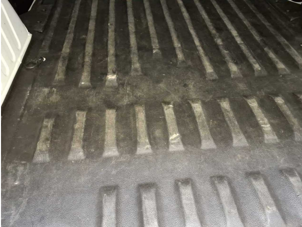
Beschädigung #1: Interieur: Laderaumboden - gebrochen / gerissen - erneuern