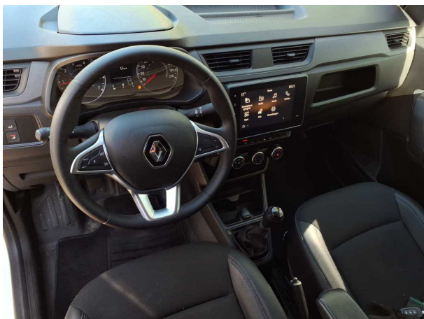
Abbildung 11: Instrumententafel