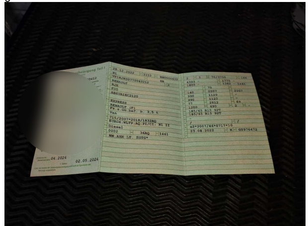
Beschädigung #2: Sonstiges: Hauptuntersuchung - fällig - durchführen