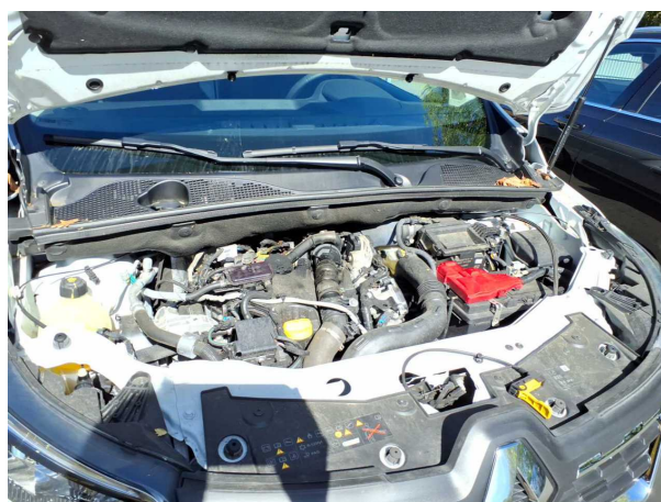
Abbildung 6: Motorraum