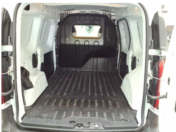
Abbildung 5: Laderaum