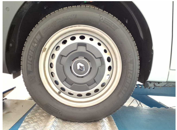
Abbildung 16: Montierte Bereifung