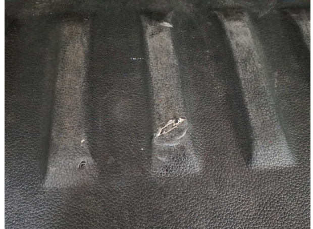
Beschädigung #1: Interieur: Laderaumboden - gebrochen / gerissen - erneuern