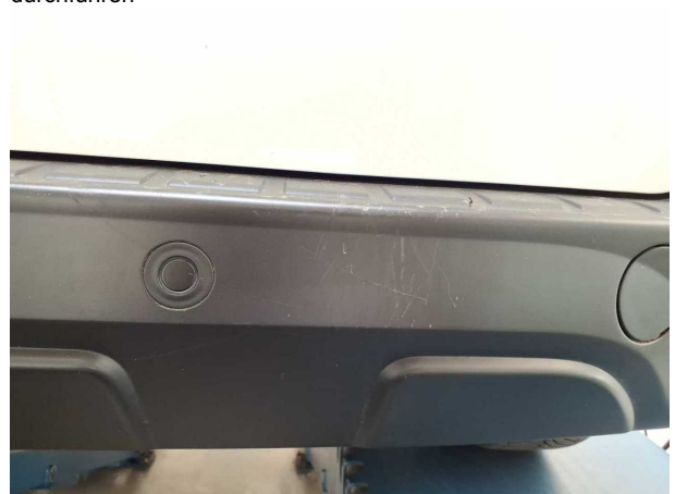
Beschädigung #3: Stossfänger hinten: Stossfänger hinten (unlackiert) - verkratzt / verschürft - Wertminderung