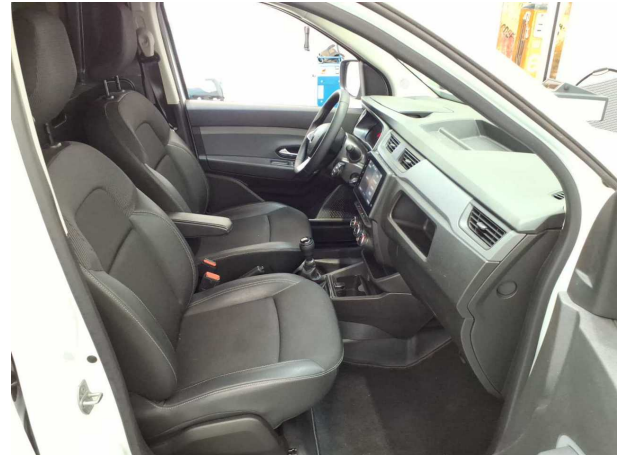
Abbildung 8: Innenraum vorne