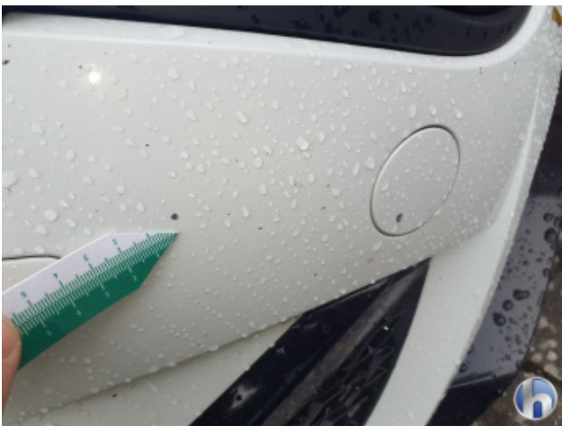
2. Stoßfänger Vorne Steinschlag - Lackieren