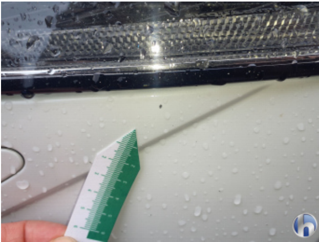
2. Stoßfänger Vorne Steinschlag - Lackieren