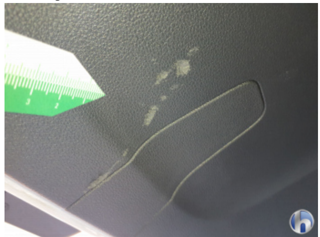
3. Verkleidung Kratzer - Smart Repair