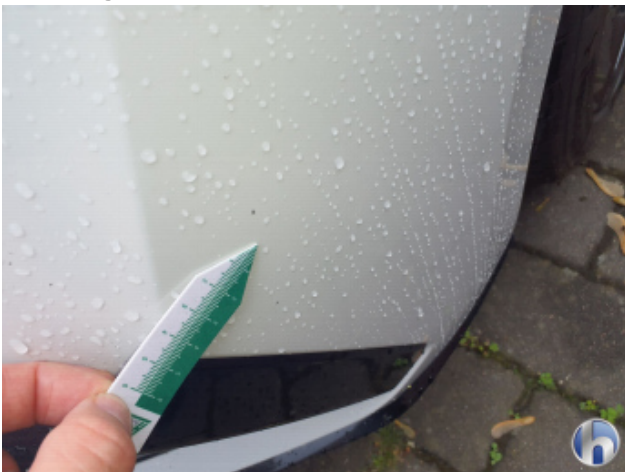
2. Stoßfänger Vorne Steinschlag - Lackieren