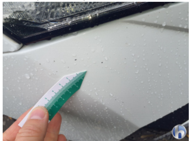
2. Stoßfänger Vorne Steinschlag - Lackieren