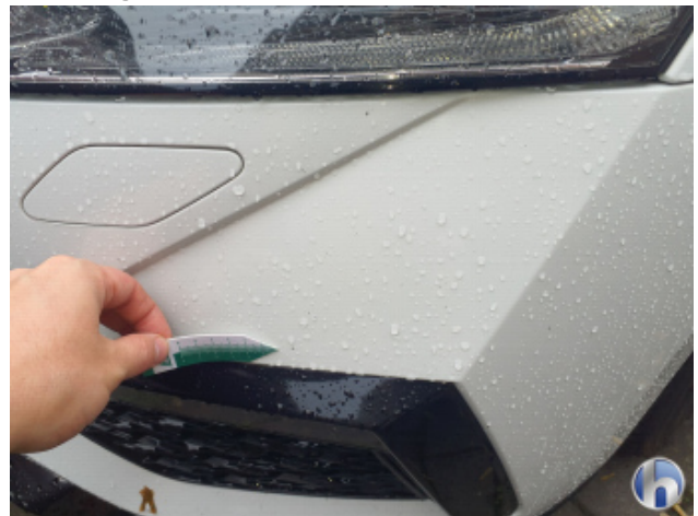
2. Stoßfänger Vorne Steinschlag - Lackieren