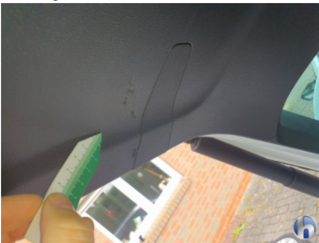
3. Verkleidung Kratzer - Smart Repair