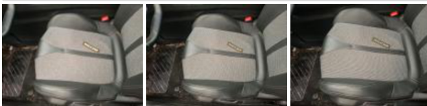
Bas de caisse int AVG, Bosse(s), PDR - Débosselage ss peinture