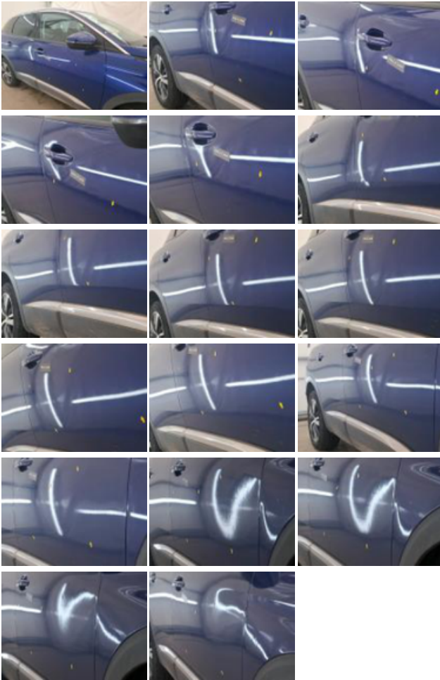
Montant de toit D, Bosse(s), PDR - Débosselage ss peinture