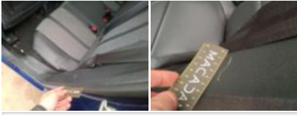
Accoudoir AV C, Déchirure, Réparer/rempl. (montant forfaitaire)