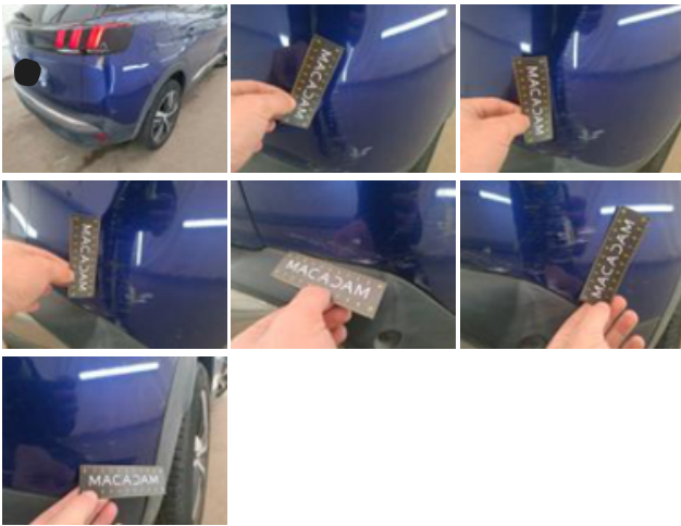
Pavillon, Grêlé, LI - Réparer et peindre (complet)