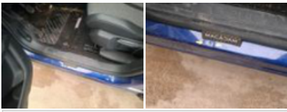
Garniture montant Mil G, Griffe(s), Réparer/rempl. (montant forfaitaire)