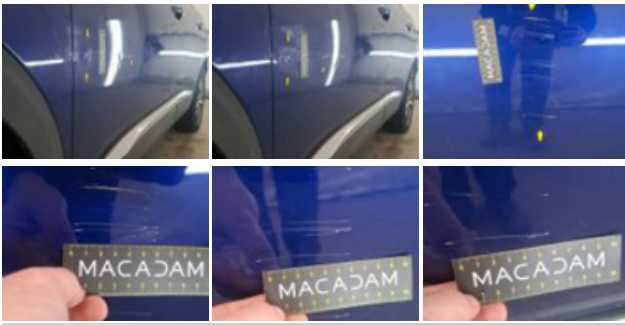
Poignée ext porte AVG, Griffe(s), Acceptable