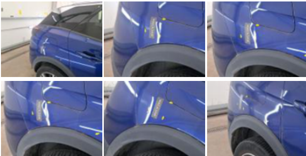
Porte ARD, Mauvaise réparation, LI - Réparer et peindre (complet)