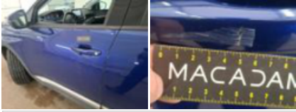
Montant de toit G, Bosse(s), PDR - Débosselage ss peinture