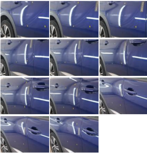
Porte AVD, Mauvaise réparation, LI - Réparer et peindre (complet)