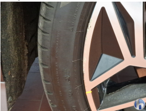
1. Felge Vorne - Rechts Beschädigt - Smart Repair