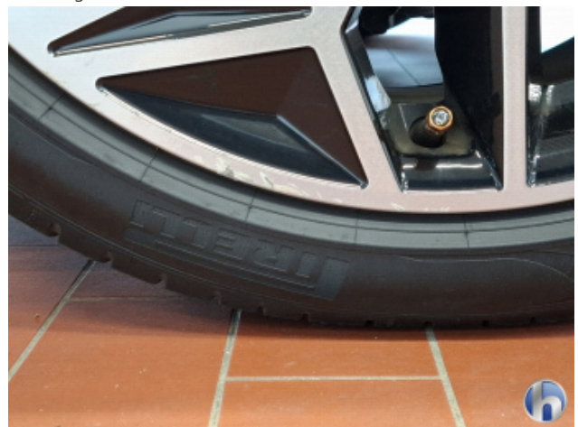
1. Felge Vorne - Rechts Beschädigt - Smart Repair