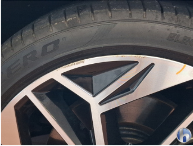
1. Felge Vorne - Rechts Beschädigt - Smart Repair