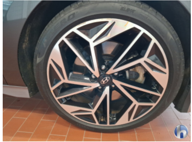
1. Felge Vorne - Rechts Beschädigt - Smart Repair