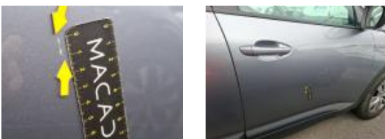
73194093 Porte ARD Griffe(s) Lustrage