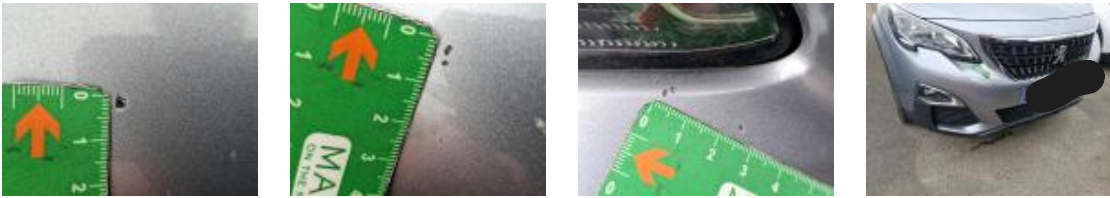
73194087 Porte AVG Griffe(s) Lustrage