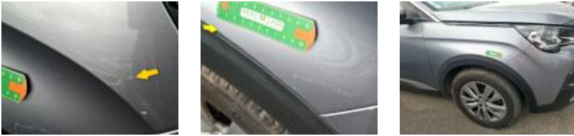
73194091 Pare-chocs AV Griffe(s) Acceptable