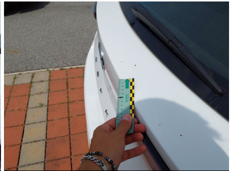
Portello / - / Rientranza