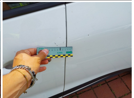
Porta / Anteriore Sinistro / Ammaccato vernice incisa