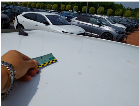
Tetto / - / Rientranza