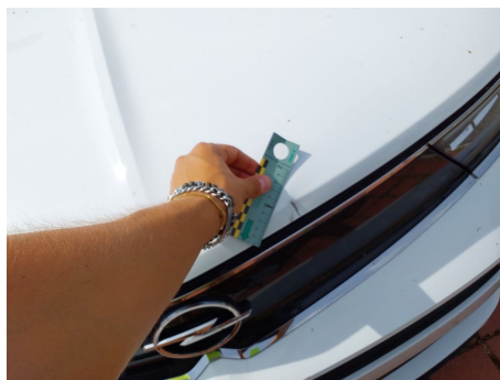
Cofano anteriore / - / Ammaccato vernice incisa