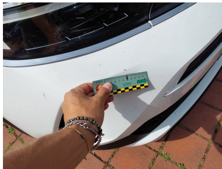
Paraurti / Anteriore / Riga