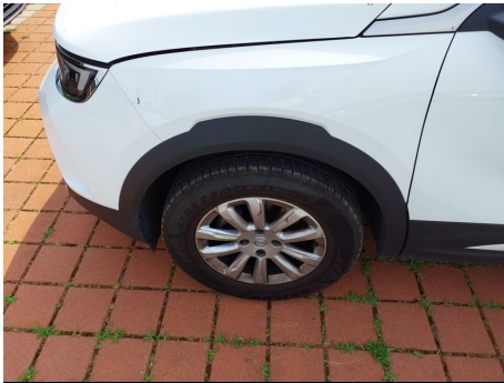
Set pneumatici principale / Anteriore Sinistro