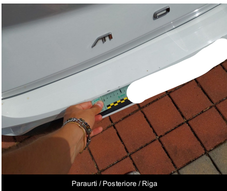
Paraurti / Posteriore / Riga