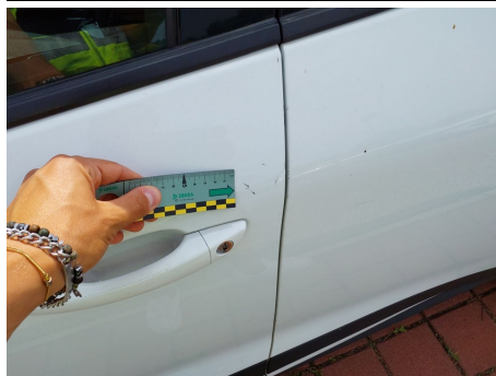
Porta / Anteriore Sinistro / Ammaccato vernice incisa