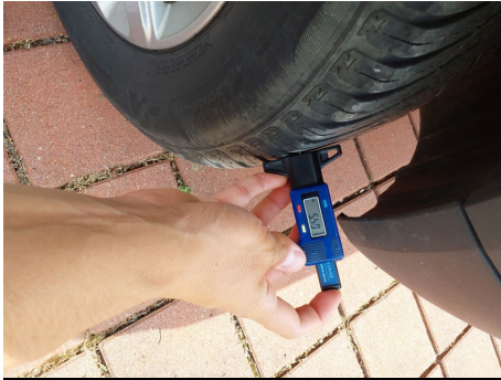
Set pneumatici principale / Posteriore Sinistro