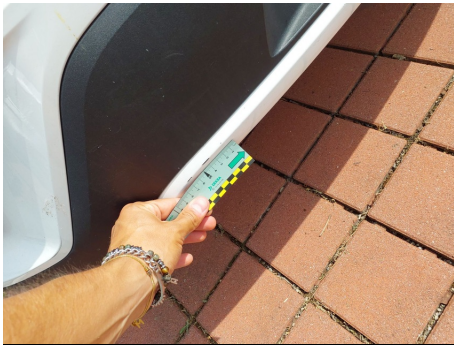
Parte inferiore paraurti / Posteriore / Riga