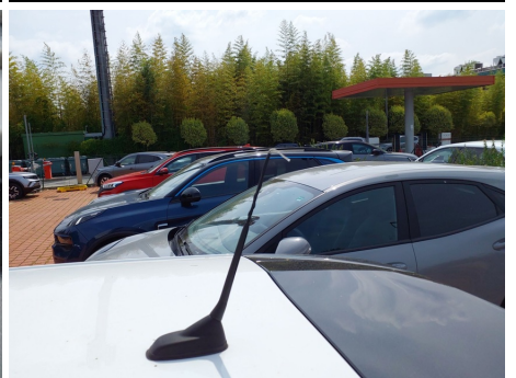
Stelo antenna / - / Rotto