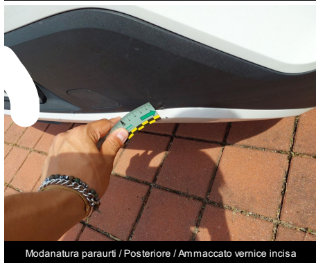
Modanatura paraurti / Posteriore / Ammaccato vernice incisa