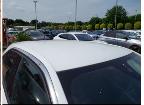
Tetto / - / Rientranza