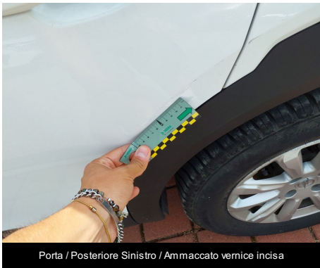
Porta / Posteriore Sinistro / Ammaccato vernice incisa