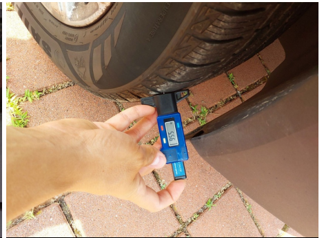
Set pneumatici principale / Anteriore Destro