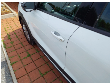
Porta / Anteriore Sinistro / Ammaccato vernice incisa