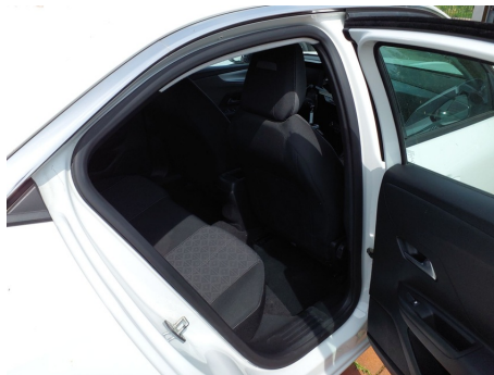
Vano passeggeri posteriore