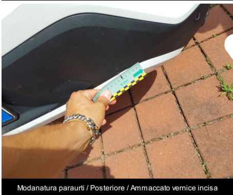
Modanatura paraurti / Posteriore / Ammaccato vernice incisa