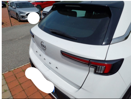
Portello / - / Rientranza