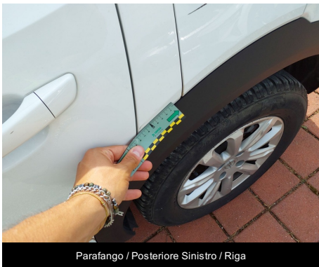
Parafango / Posteriore Sinistro / Riga