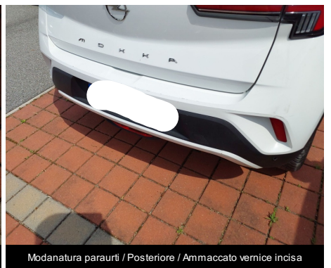
Modanatura paraurti / Posteriore / Ammaccato vernice incisa