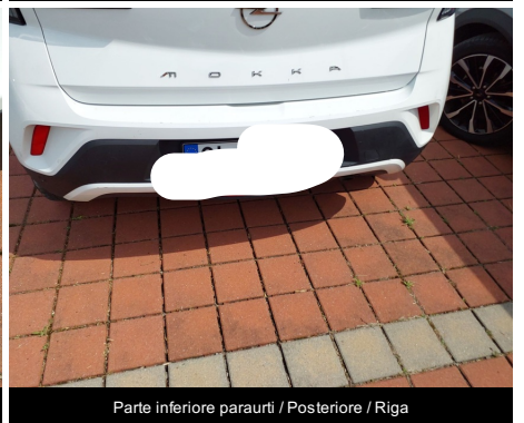
Parte inferiore paraurti / Posteriore / Riga