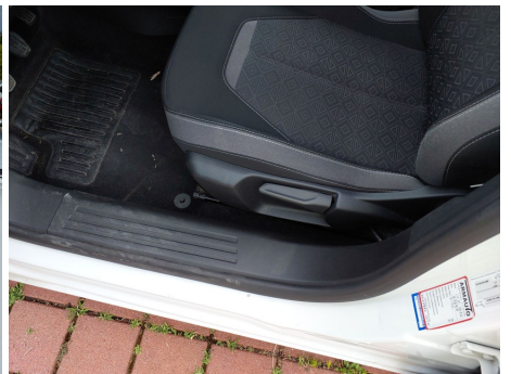
Moquette / - / Bruciato