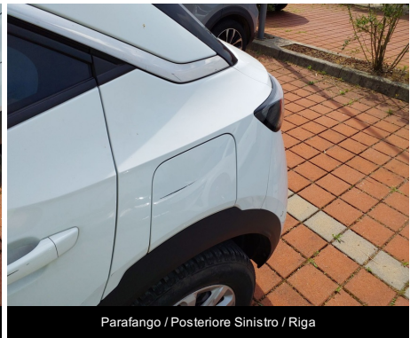
Parafango / Posteriore Sinistro / Riga