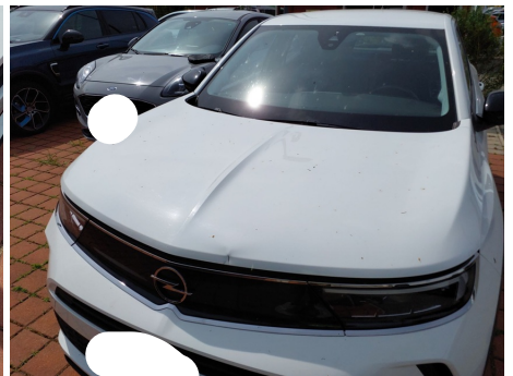
Cofano anteriore / - / Ammaccato vernice incisa