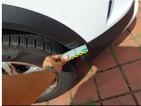
Modanatura parafrang. / Anteriore Destro / Riga