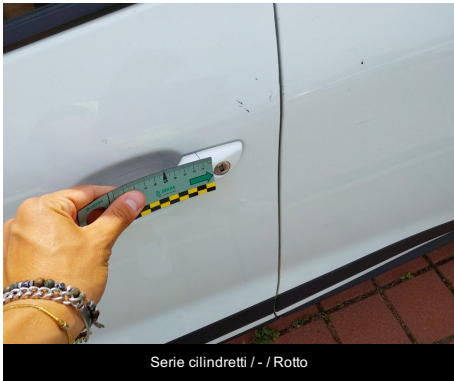
Serie cilindretti / - / Rotto