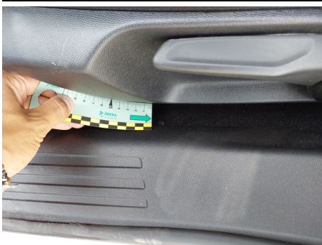
Moquette / - / Bruciato