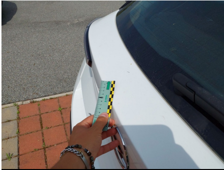
Portello / - / Rientranza