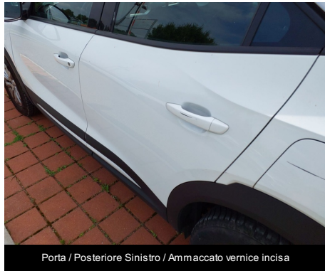
Porta / Posteriore Sinistro / Ammaccato vernice incisa