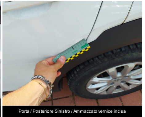
Porta / Posteriore Sinistro / Ammaccato vernice incisa