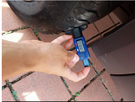
Set pneumatici principale / Posteriore Destro