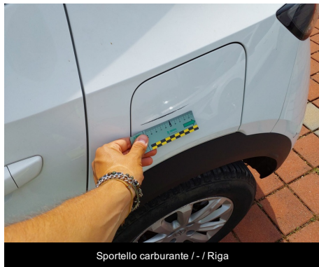
Sportello carburante / - / Riga