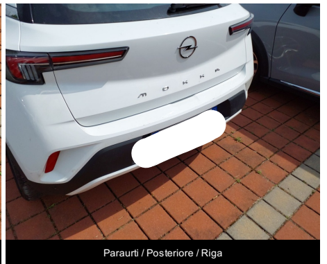
Paraurti / Posteriore / Riga