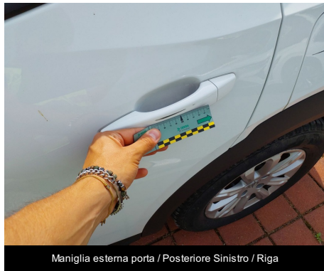
Maniglia esterna porta / Posteriore Sinistro / Riga