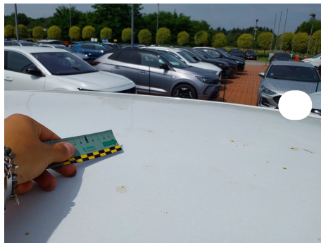
Tetto / - / Rientranza