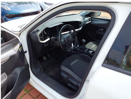
Vano passeggeri anteriore