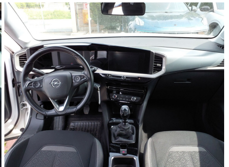
Cruscotto dal sedile posteriore