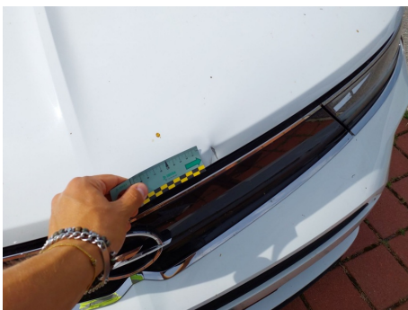
Cofano anteriore / - / Ammaccato vernice incisa