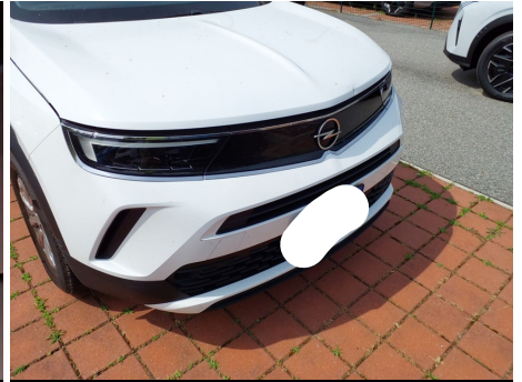
Paraurti / Anteriore / Riga