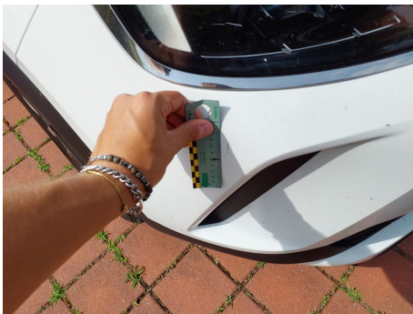
Paraurti / Anteriore / Riga