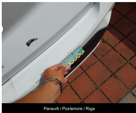
Paraurti / Posteriore / Riga