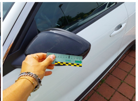
Calotta retrovisore / Sinistro / Riga