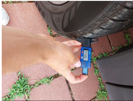
Set pneumatici principale / Anteriore Sinistro