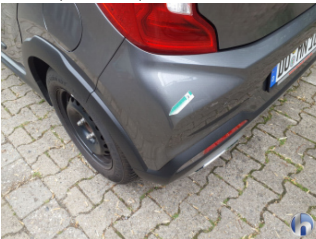
2. Stoßfänger Hinten Oberflächenkratzer - Auslegen / Polieren