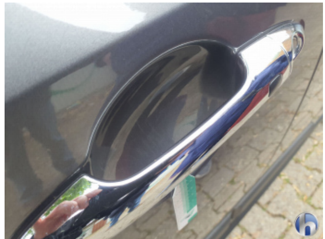
1. Tür Vorne - Links Gebrauchsspuren - Ohne Reparatur