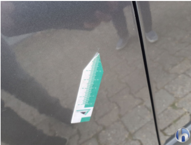
1. Tür Vorne - Links Gebrauchsspuren - Ohne Reparatur