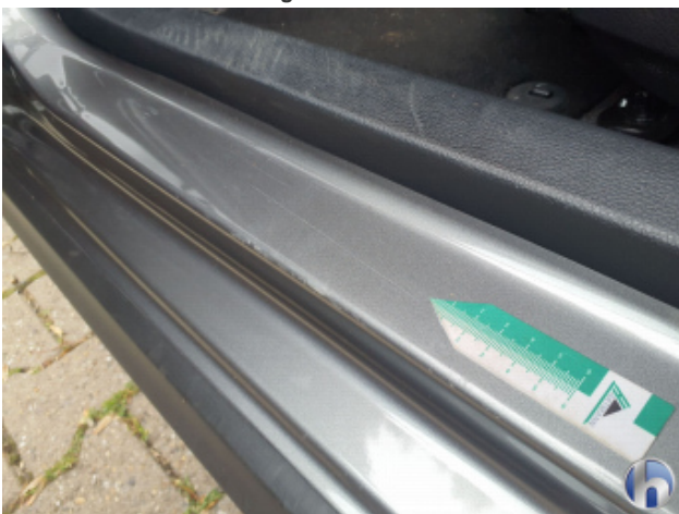
4. Türeinstieg Vorne - Links Kratzer - Smart Repair