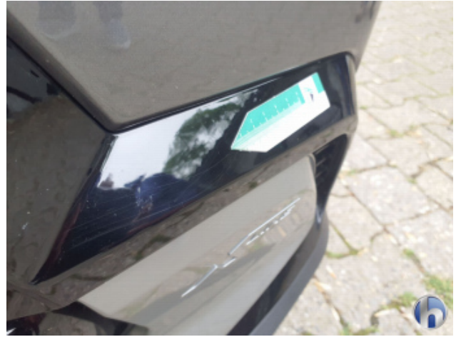
7. Zierelement Stoßfänger vorn Kratzer - Erneuern