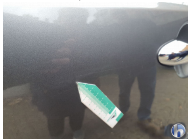
3. Tür Hinten - Links Kratzer - Smart Repair