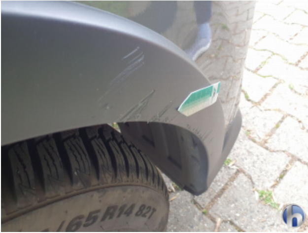
5. Frontspoiler Beschädigt - Erneuern