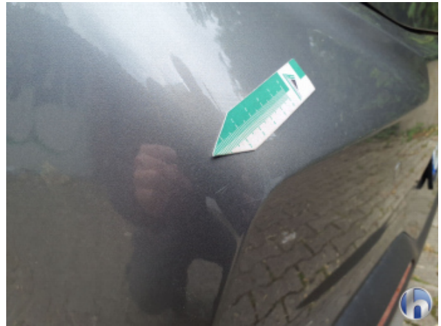
2. Stoßfänger Hinten Oberflächenkratzer - Auslegen / Polieren