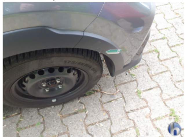
5. Frontspoiler Beschädigt - Erneuern