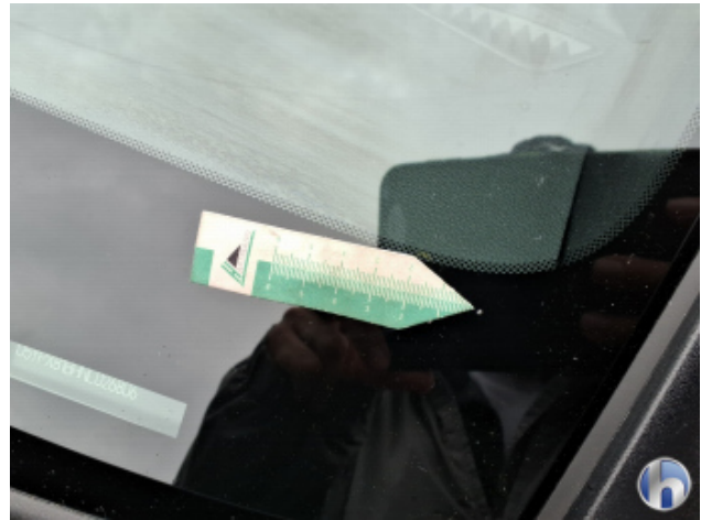
2. Windschutzscheibe Steinschlag - Smart Repair