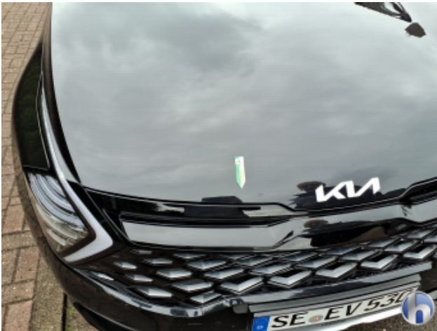
1. Motorhaube Steinschlag - Smart Repair