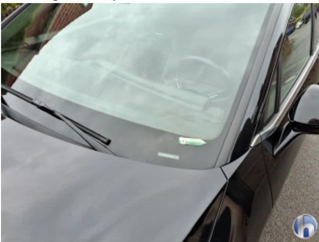
2. Windschutzscheibe Steinschlag - Smart Repair