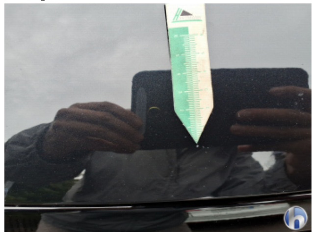
1. Motorhaube Steinschlag - Smart Repair