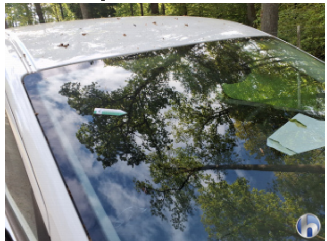
1. Fahrzeug Verschmutzt - Reinigen