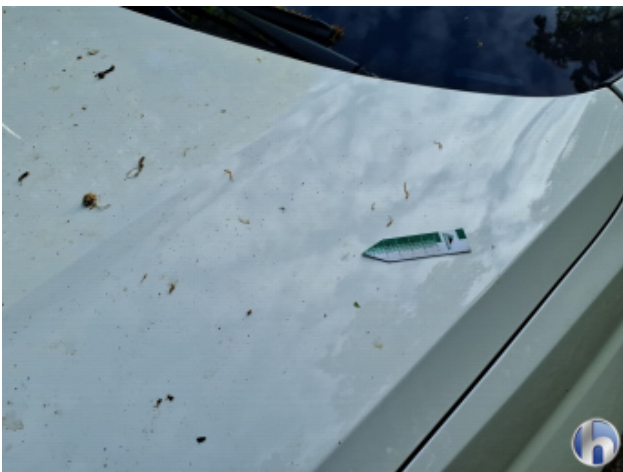
1. Fahrzeug Verschmutzt - Reinigen