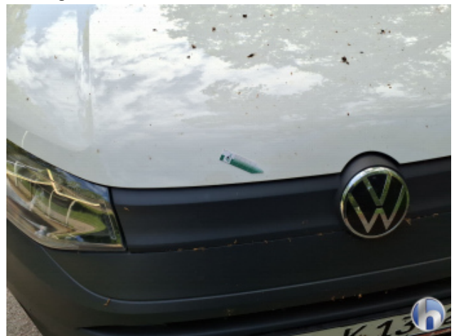
1. Fahrzeug Verschmutzt - Reinigen