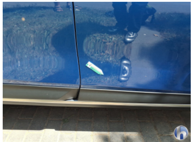
2. Tür Vorne - Rechts Kratzer - Smart Repair