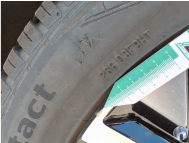
6. Reifen Hinten - Links Beschädigt - Erneuern