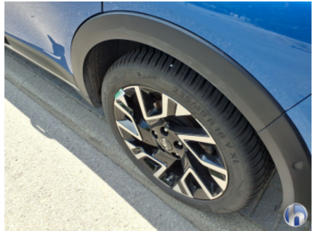
1. Felge Hinten - Links Kratzer - Smart Repair