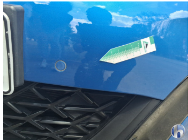
3. Stoßfänger Vorne Kratzer - Smart Repair