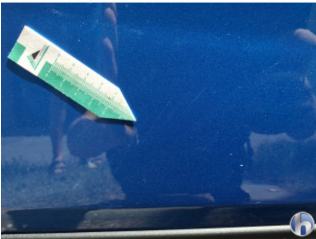
2. Tür Vorne - Rechts Kratzer - Smart Repair