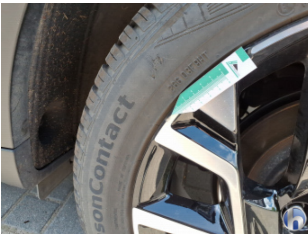
1. Felge Hinten - Links Kratzer - Smart Repair