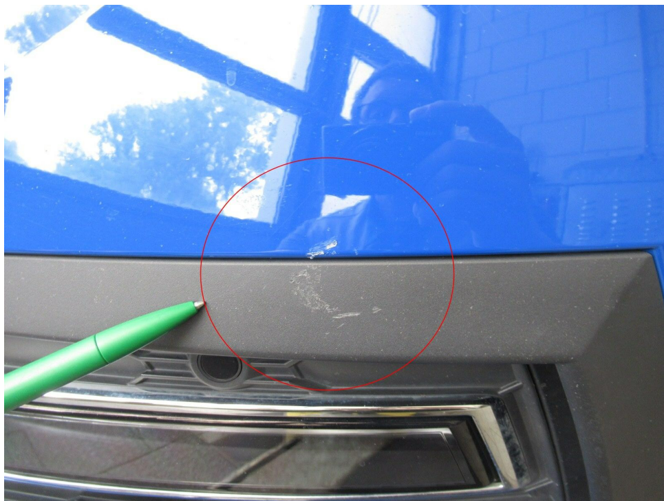
Bild 7 : Stoßfänger vorne Lackierung, zerkratzt, lackieren mit Lackaufbau Frontblende l. zerkratzt