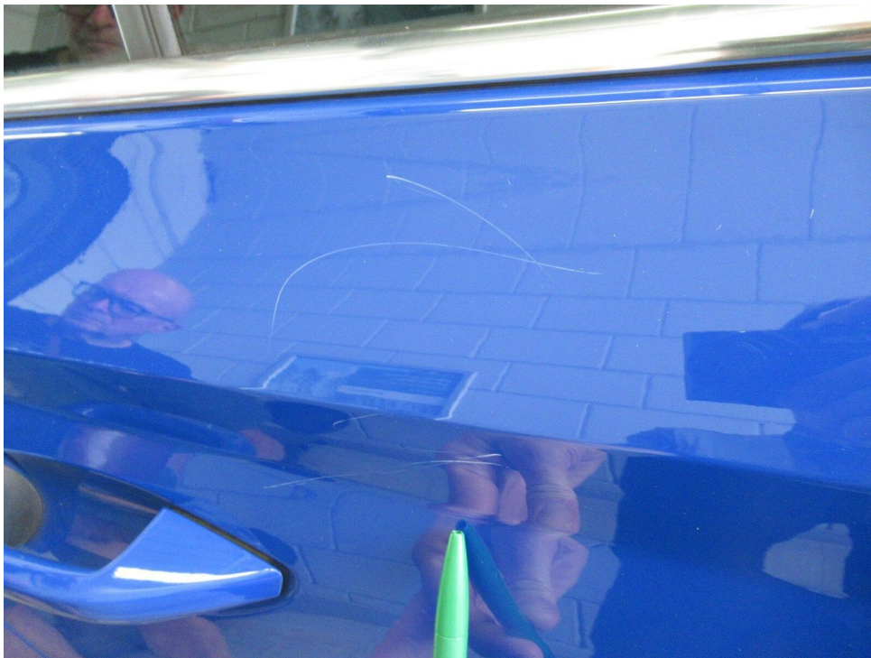
Bild 10 : Tür hinten rechts Lackierung, zerkratzt, lackieren mit Lackaufbau