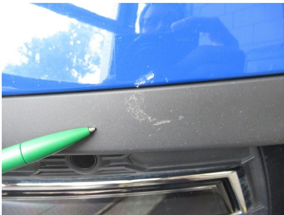
Bild 8 : Stoßfänger vorne Lackierung, zerkratzt, lackieren mit Lackaufbau Frontblende l. zerkratzt