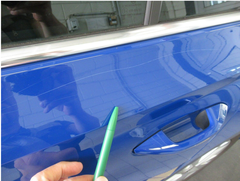
Bild 9 : Tür hinten links Lackierung, zerkratzt, lackieren mit Lackaufbau