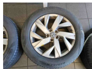
Räder - Rad beiliegend #3