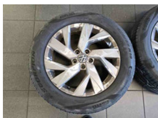
Räder - Rad beiliegend #1