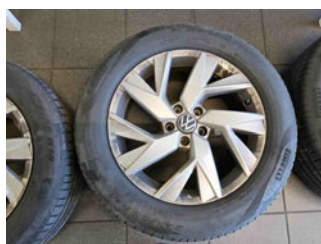
Räder - Rad beiliegend #2