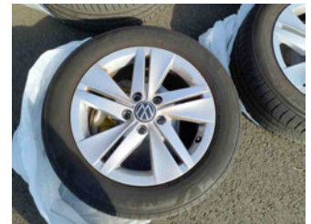
Räder - Rad beiliegend #3