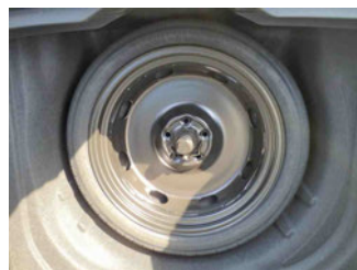
Räder - Ersatzrad