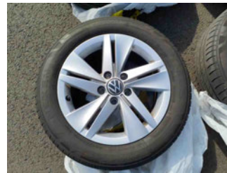
Räder - Rad beiliegend #2