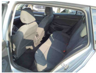
Innenraum - hinten