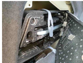
Equipment - Bordwerkzeug