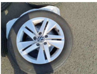
Räder - Rad beiliegend #4