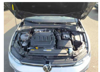
Fahrzeug - Motorraum offen