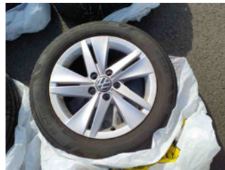
Räder - Rad beiliegend #1