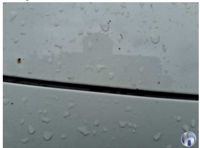
1. Motorhaube Gebrauchsspuren - Ohne Reparatur