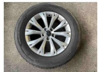
Räder - Rad beiliegend #3