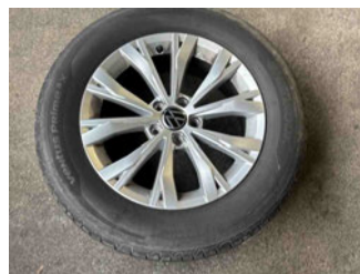
Räder - Rad beiliegend #1