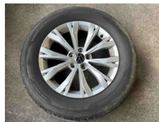
Räder - Rad beiliegend #2