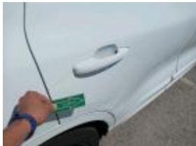
Emblecedor Aleta Tras DR