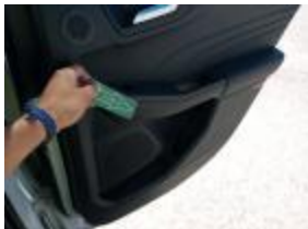
Guarnic Tapa Tras