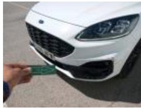
Moldura Parachoques Del Iz