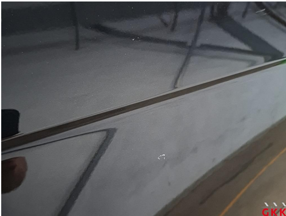
Bild 25 Fahrzeug, außen, Lackierung verwittert / matt, aufbereiten