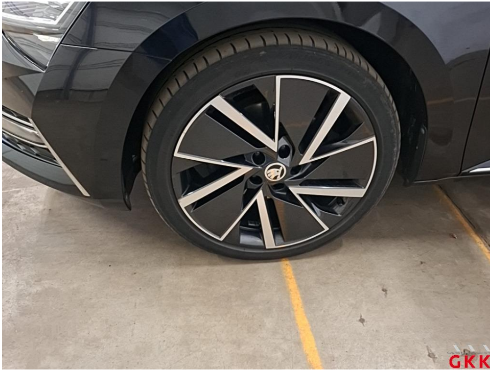
Bild 18 LM-Rad, vorne links, Materialabtrag, ersetzen