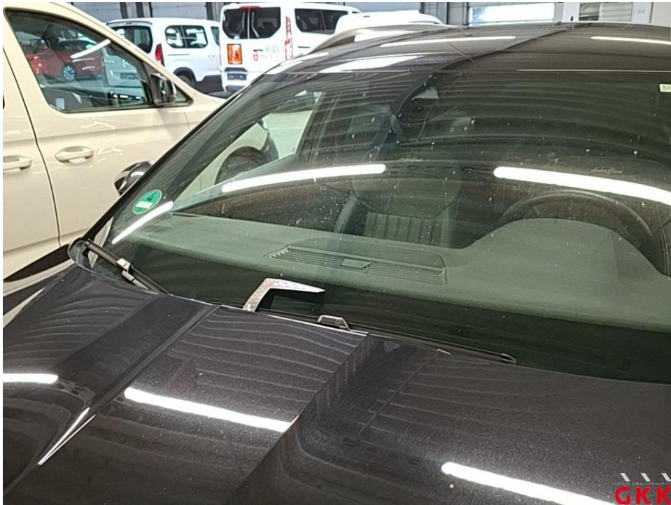
Bild 15 Frontscheibe, beschädigt, ersetzen