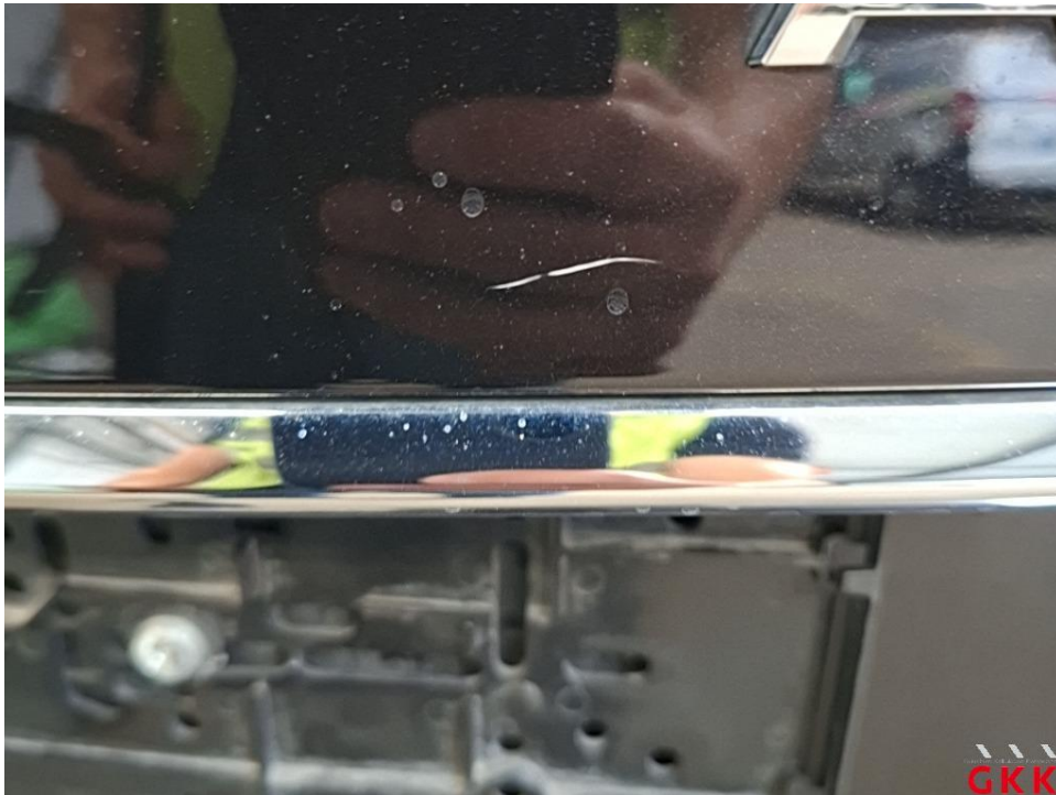
Bild 24 Fahrzeug, außen, Lackierung verwittert / matt, aufbereiten