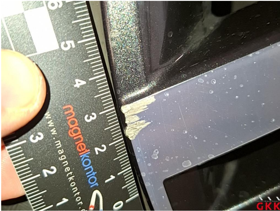
Bild 20 LM-Rad, vorne links, Materialabtrag, ersetzen