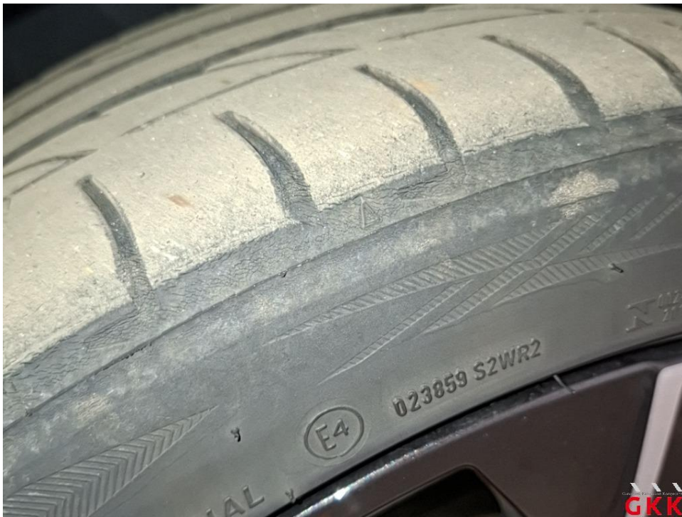
Bild 21 Reifen, vorn links und rechts, einseitig abgefahren und Unterraß, ersetzen