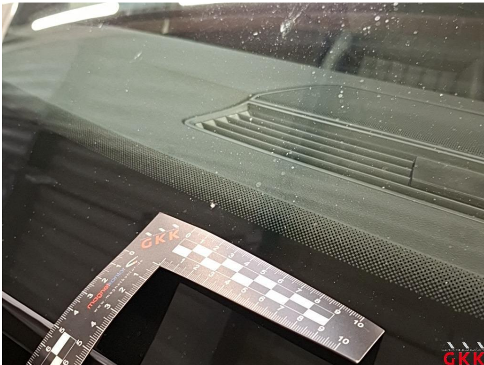
Bild 16 Frontscheibe, beschädigt, ersetzen