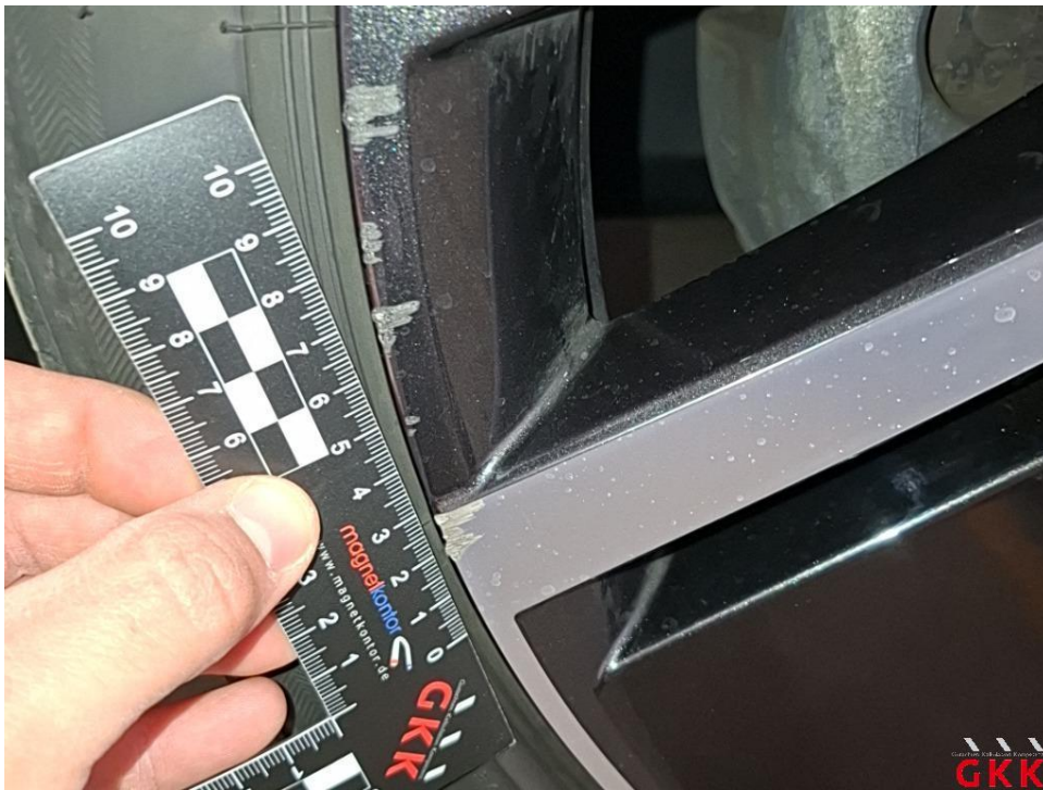
Bild 19 LM-Rad, vorne links, Materialabtrag, ersetzen