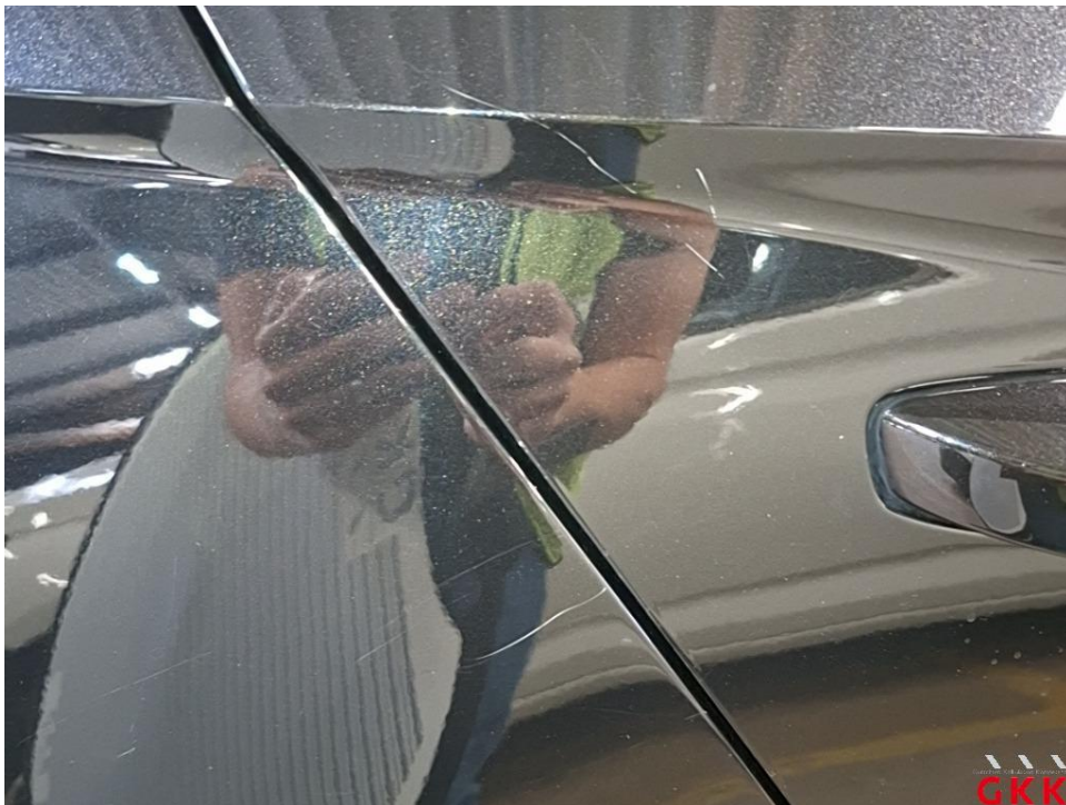
Bild 23 Fahrzeug, außen, Lackierung verwittert / matt, aufbereiten