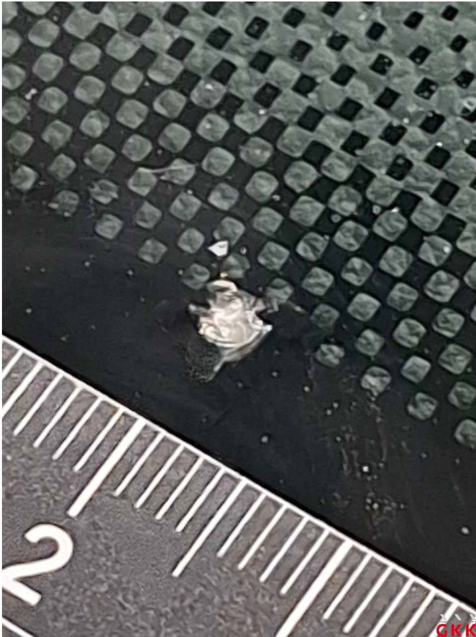
Bild 17 Frontscheibe, beschädigt, ersetzen