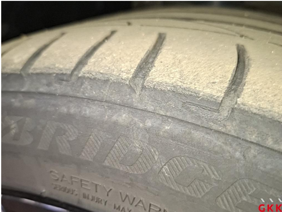
Bild 22 Reifen, vorn links und rechts, einseitig abgefahren und Untermaß, ersetzen