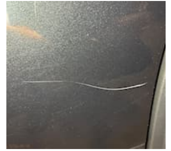
Skadebild Repa ner till grund VB dörr