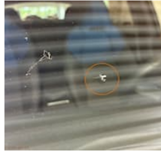
Skadebild Stenskott med spricka