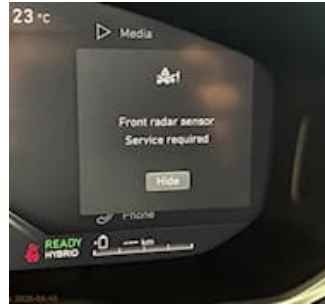
8.4.3 - Instrumentering/Varningslampor