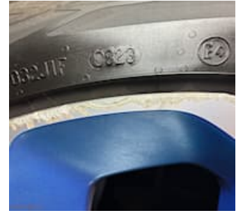
Skadebild Kantstötta fälg HB