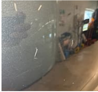
Skadebild Buckla med lackskada VB skärm