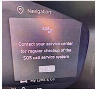
8.4.3 - Instrumentering/Varningslampor