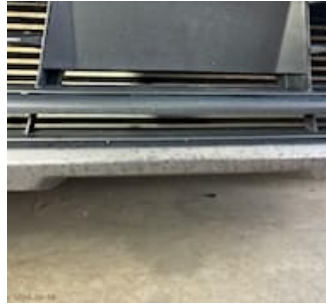
Skadebild Lackflagnig stötfångare fram mitten längst ner