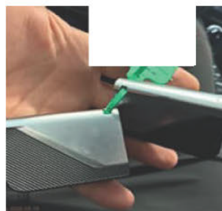
3.13.1 - Lås