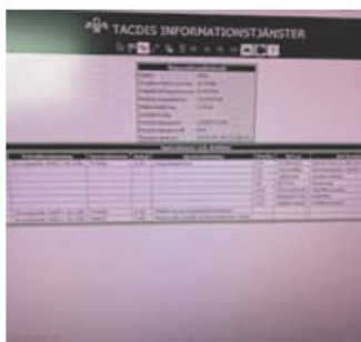
1B.2.1 - Bild servicebok