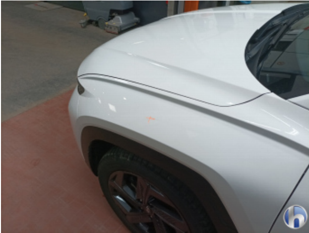
2. Kotflügel Vorne - Links Nachlackiert - Ohne Reparatur