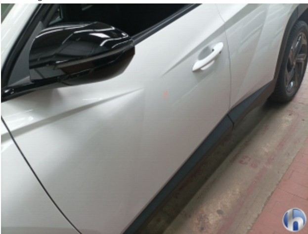
1. Tür Vorne - Links Nachlackiert - Ohne Reparatur