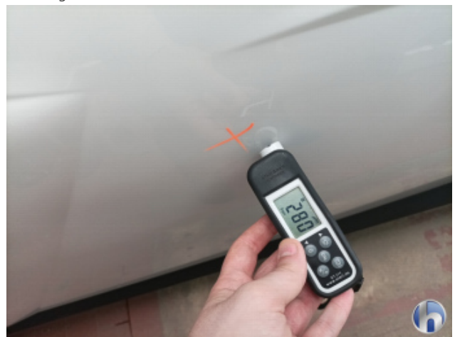
1. Tür Vorne - Links Nachlackiert - Ohne Reparatur