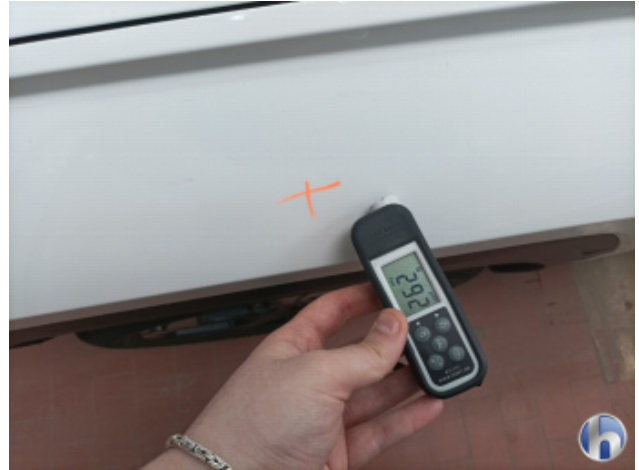
2. Kotflügel Vorne - Links Nachlackiert - Ohne Reparatur