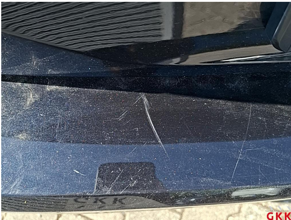
Bild 28 unreparierte Vorschäden -