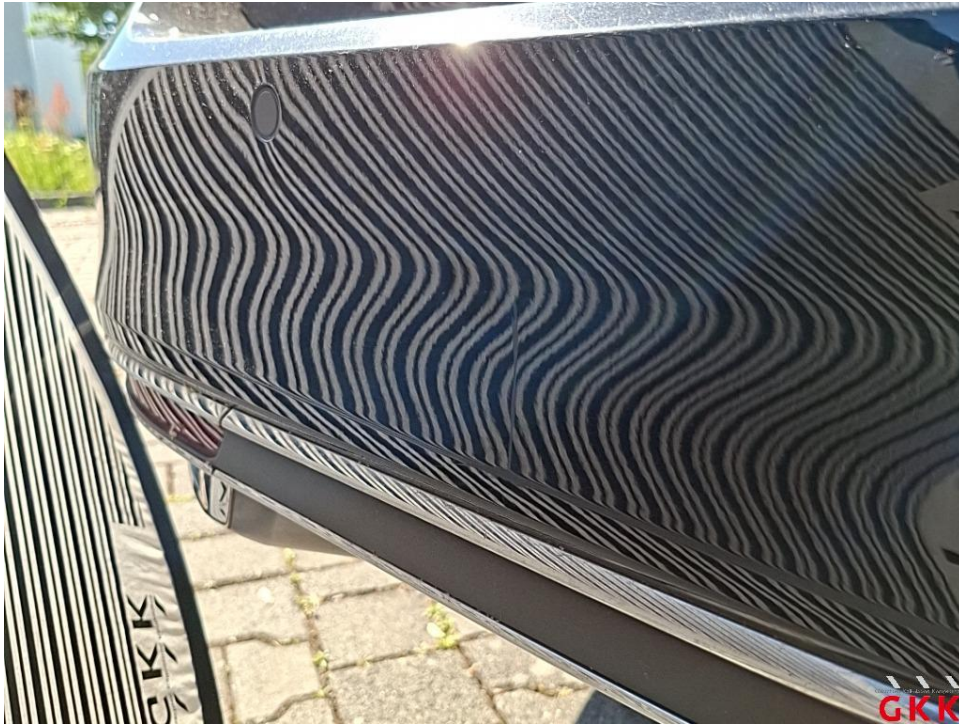
Bild 27 unreparierte Vorschäden -