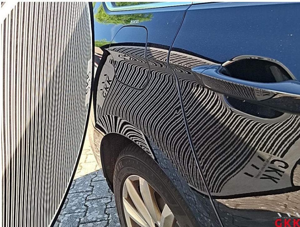
Bild 26 unreparierte Vorschäden -