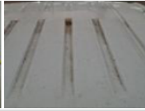
Porte de malle AR G, Bosse(s), LI - Réparer et peindre (complet)