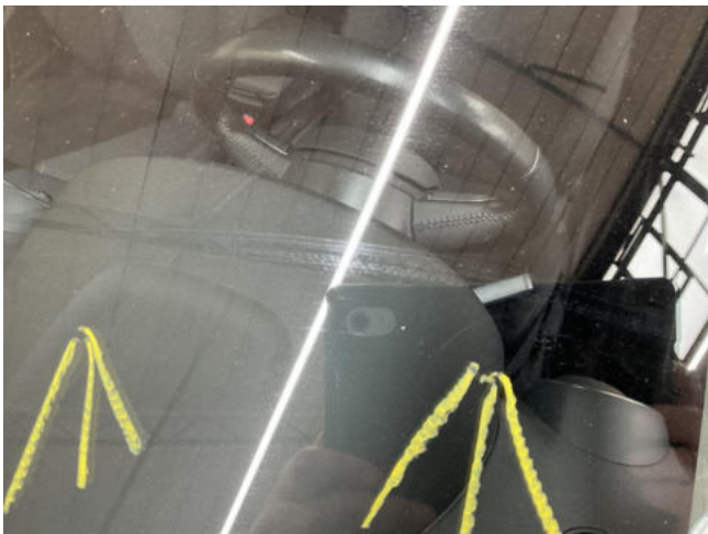
Frontscheibe verkratzt - erneuern