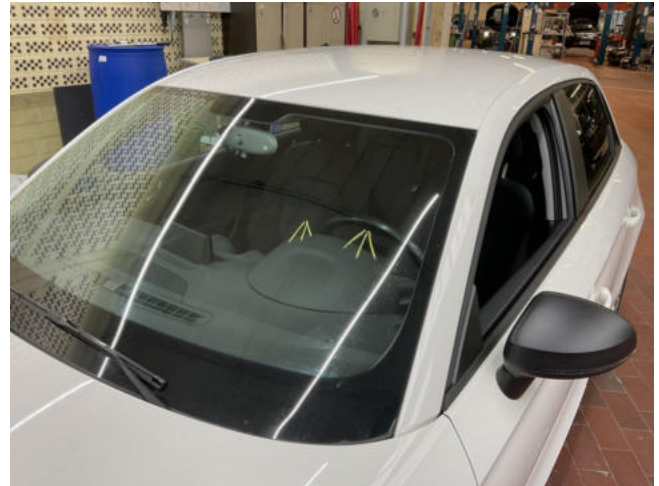
Frontscheibe verkratzt - erneuern