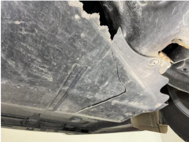
Unterbodenverkleidung gebrochen - erneuern

Auftr.-Nr: nicht vorhanden VIN: WAUZZZ8X9JB007180 Kilometerstand: 34.428 km Erstzulassung: 11.07.2017 Anzahl Halter lt. Kunde: 2 Anzahl Halter lt. Zulbesch. II: 2