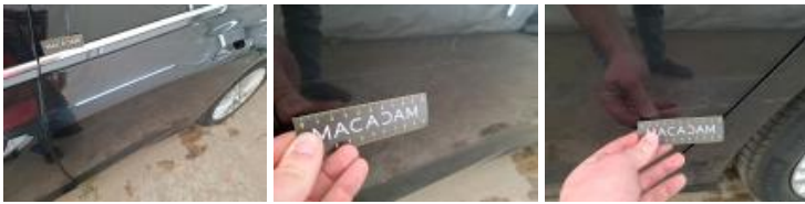
Aile ARG, Bosse(s) et griffe(s), LI - Réparer et peindre (complet)