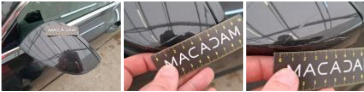
Porte ARG, Griffe(s), Peindre