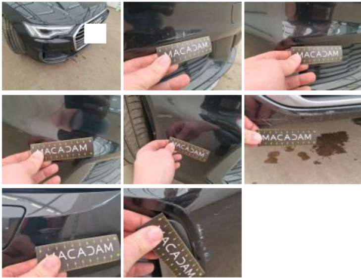
Moulure de pare-chocs AV, Déformé / Forcé, Le - Remplacer et peindre