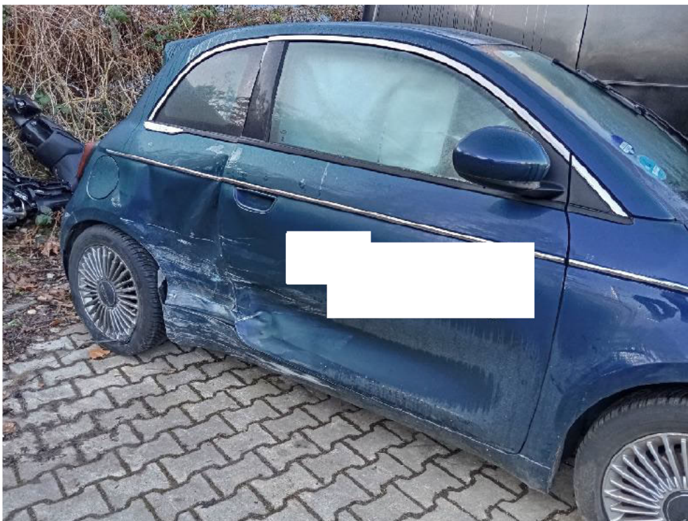
Bild: 12 Übersicht Schadenbereich rechts