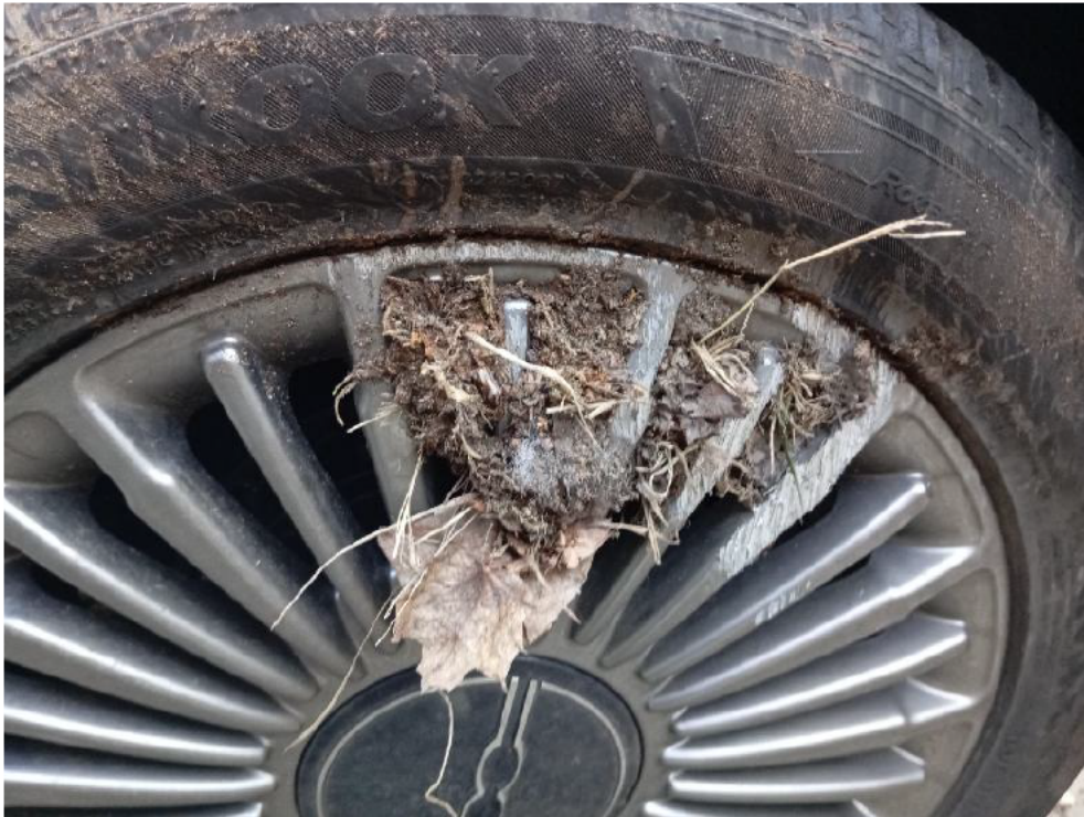
Bild: 17 Rad/Reifen hinten links beaufschlagt