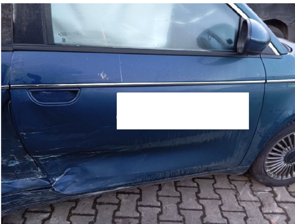
Bild: 24 Tür vorne rechts deformiert