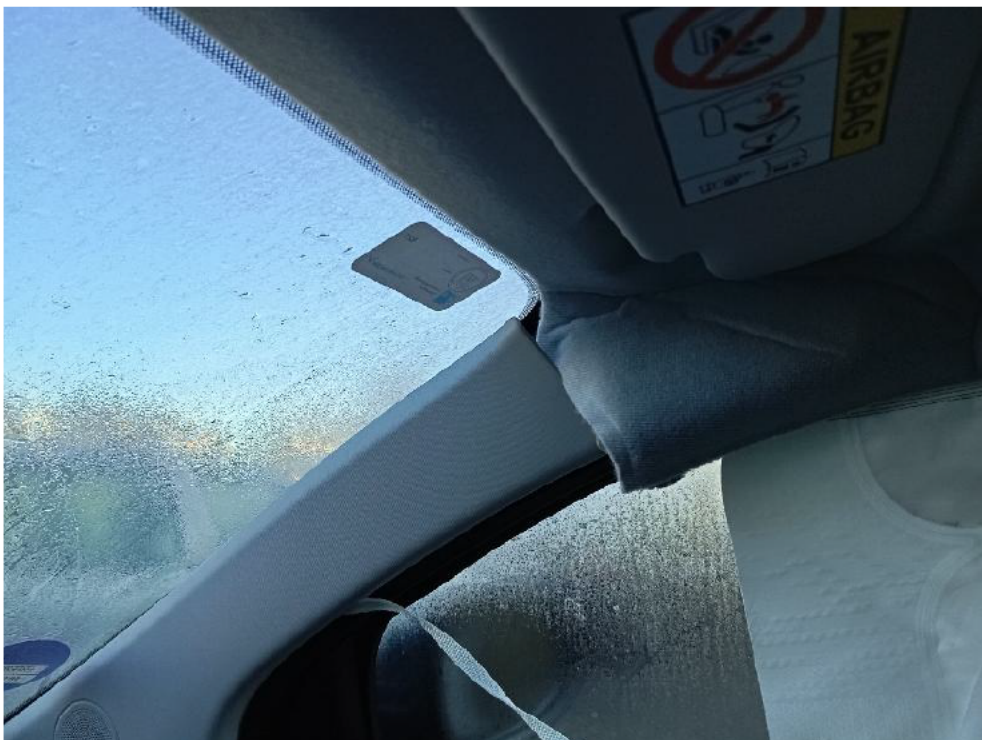
Bild: 40 Innenhimmel deformiert