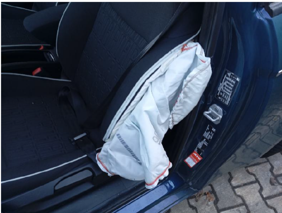
Bild: 42 Airbag Fahrersitz ausgelöst