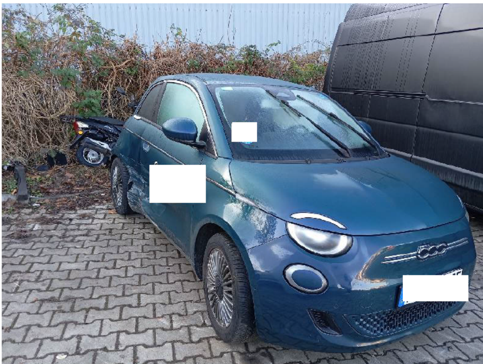
Bild: 2 Diagonale vorne rechts