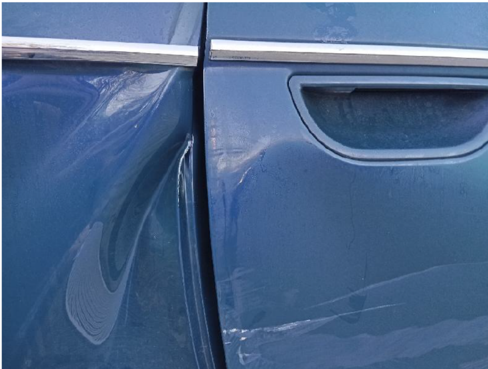
Bild: 29 Seitenwand hinten rechts deformiert