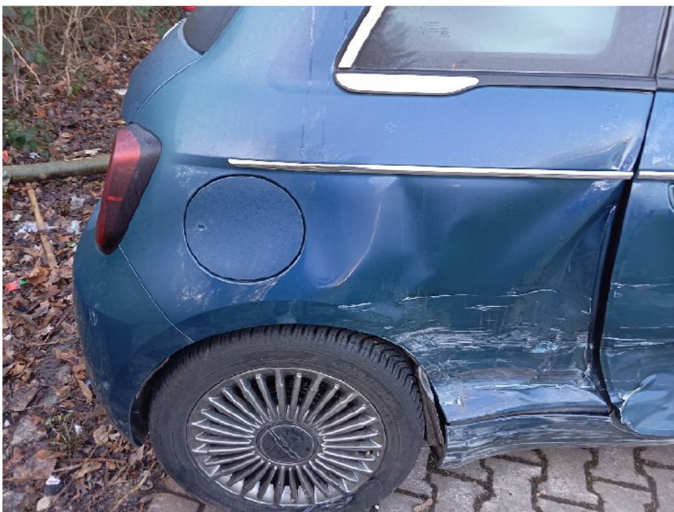
Bild: 27 Seitenwand hinten rechts deformiert