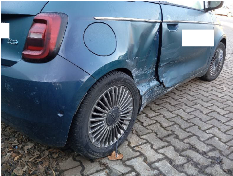
Bild: 11 Übersicht Schadenbereich rechts