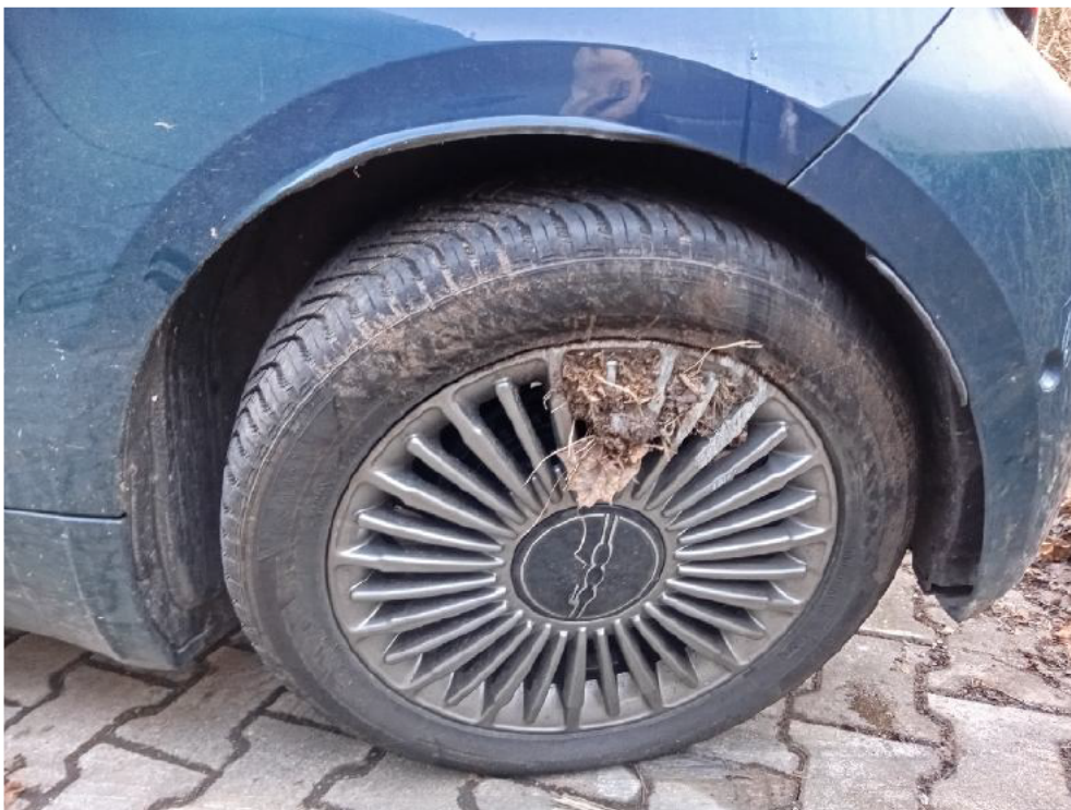
Bild: 16 Rad/Reifen hinten links beaufschlagt