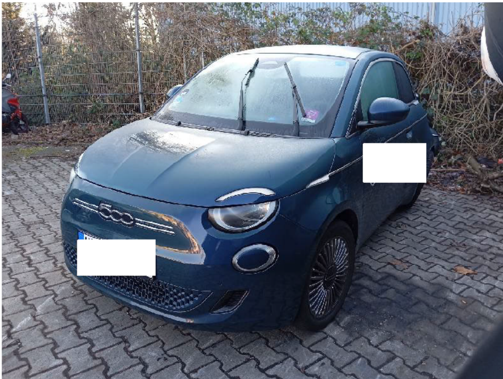
Bild: 1 Diagonale vorne links