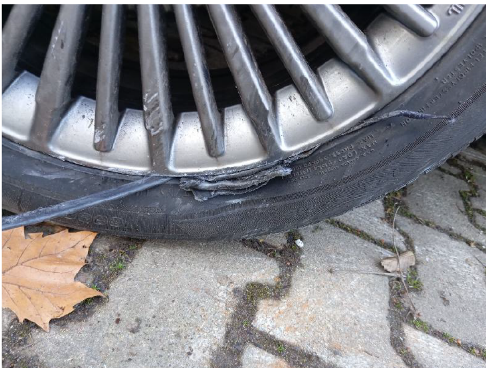
Bild: 37 Rad/Reifen hinten rechts beaufschlagt