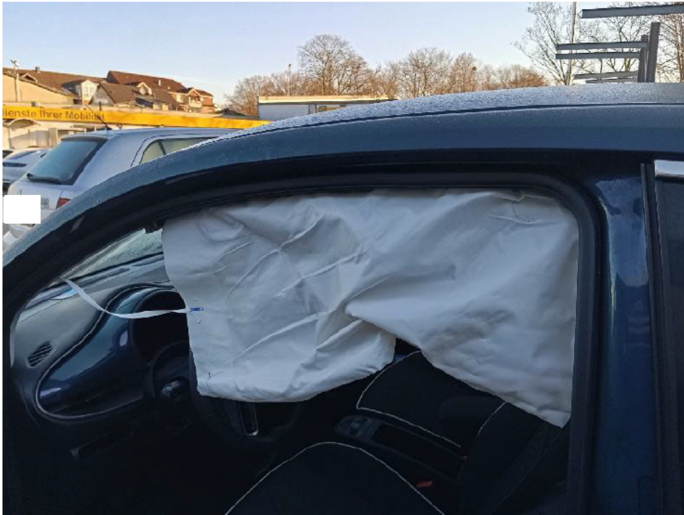
Bild: 39 Kopfairbag links ausgelöst