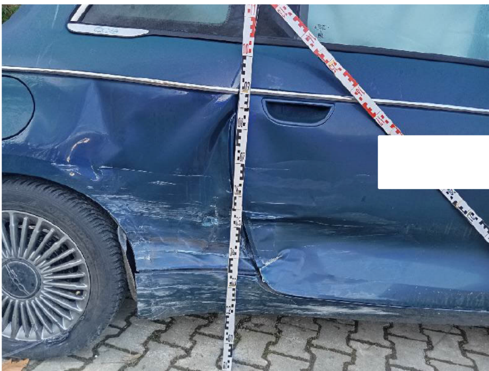
Bild: 14 Übersicht Schadenbereich mit Geometerstab