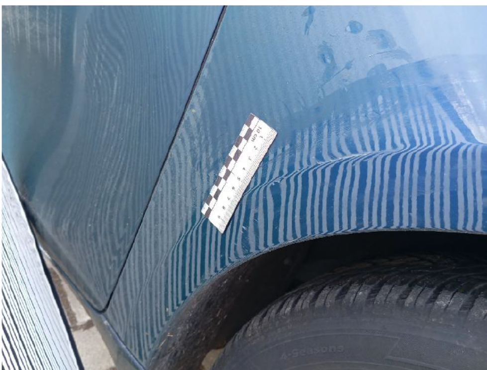
Bild: 22 Kotflügel vorne rechts deformiert