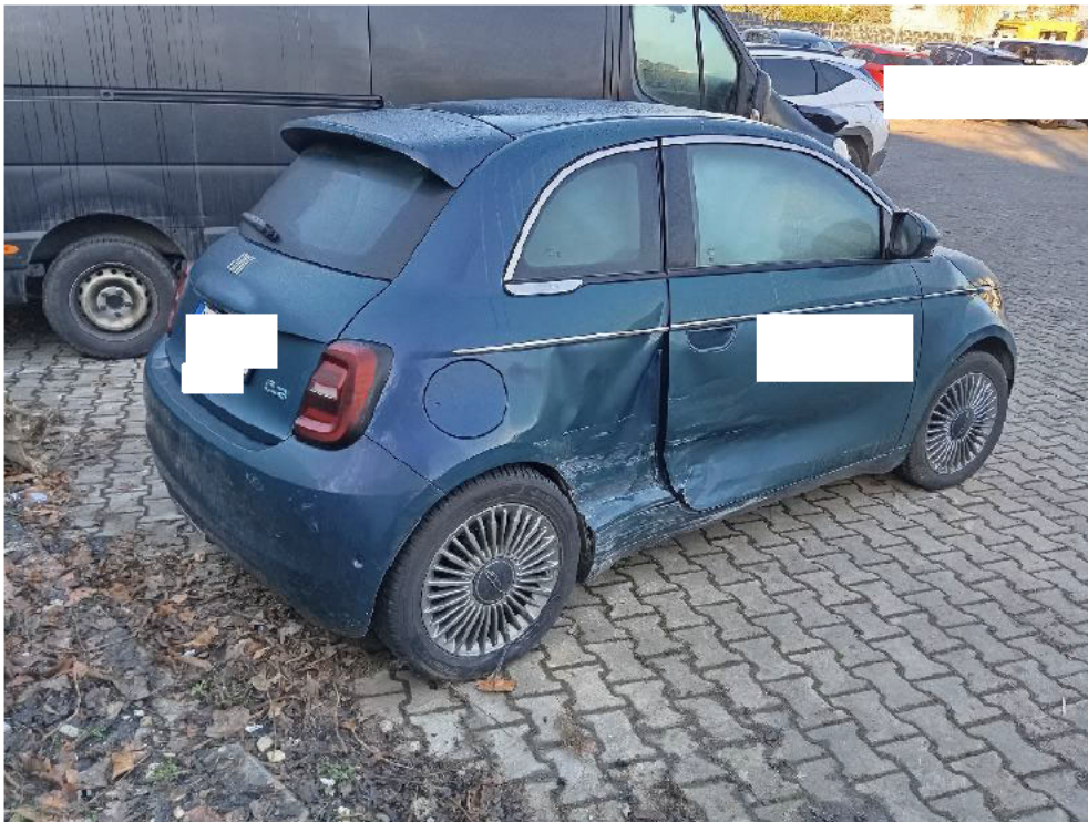
Bild: 3 Diagonale hinten rechts