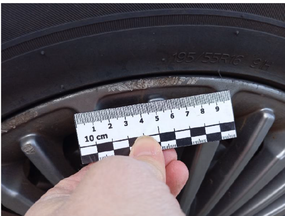
Bild: 20 Rad/Reifen vorne rechts beaufschlagt