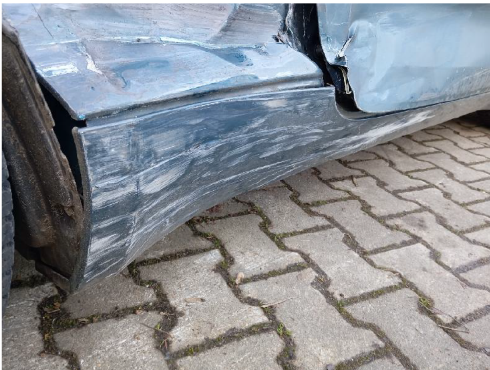
Bild: 34 Schweller rechts deformiert