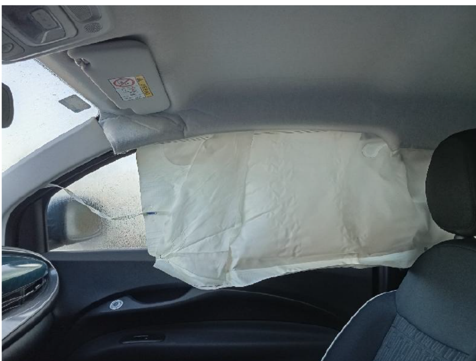
Bild: 38 Kopfairbag rechts ausgelöst