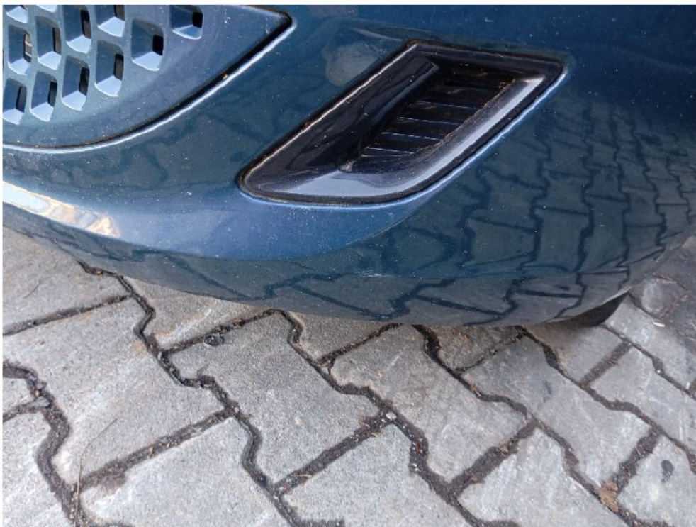
Bild: 44 Altschaden Stoßfänger vorne Lack beschädigt