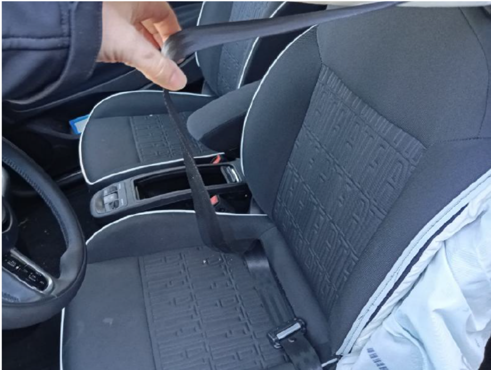
Bild: 43 Gurtstraffer vorne ausgelöst