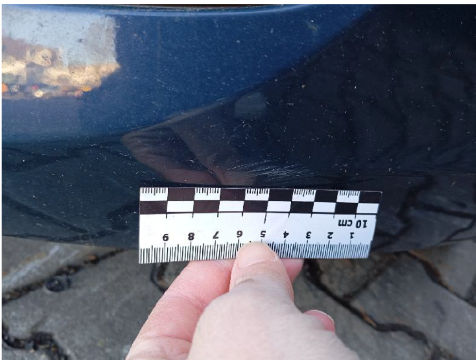
Bild: 45 Altschaden Stoßfänger vorne Lack beschädigt