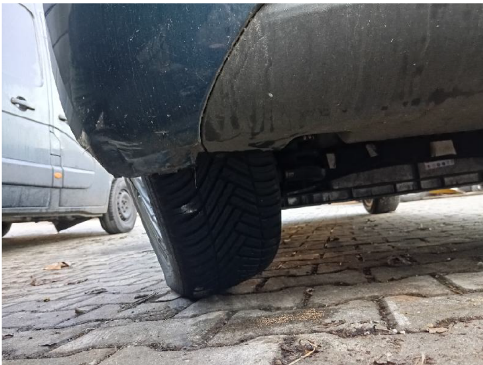
Bild: 18 Achse hinten links deformiert