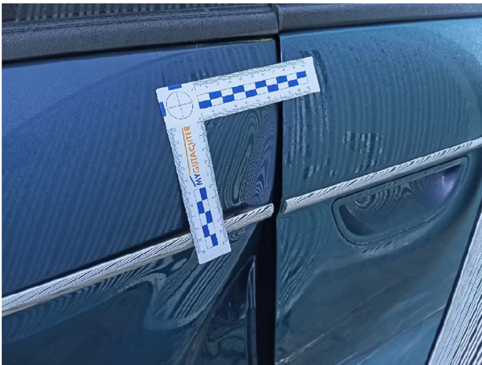
Bild: 30 Seitenwand hinten rechts deformiert