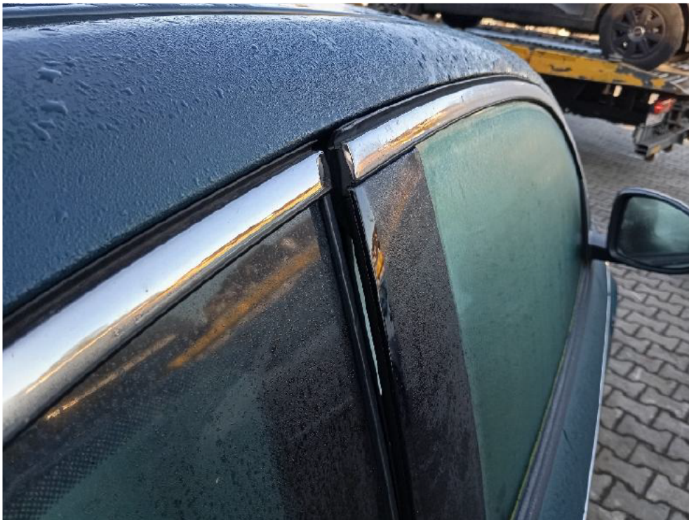
Bild: 25 Tür vorne rechts deformiert