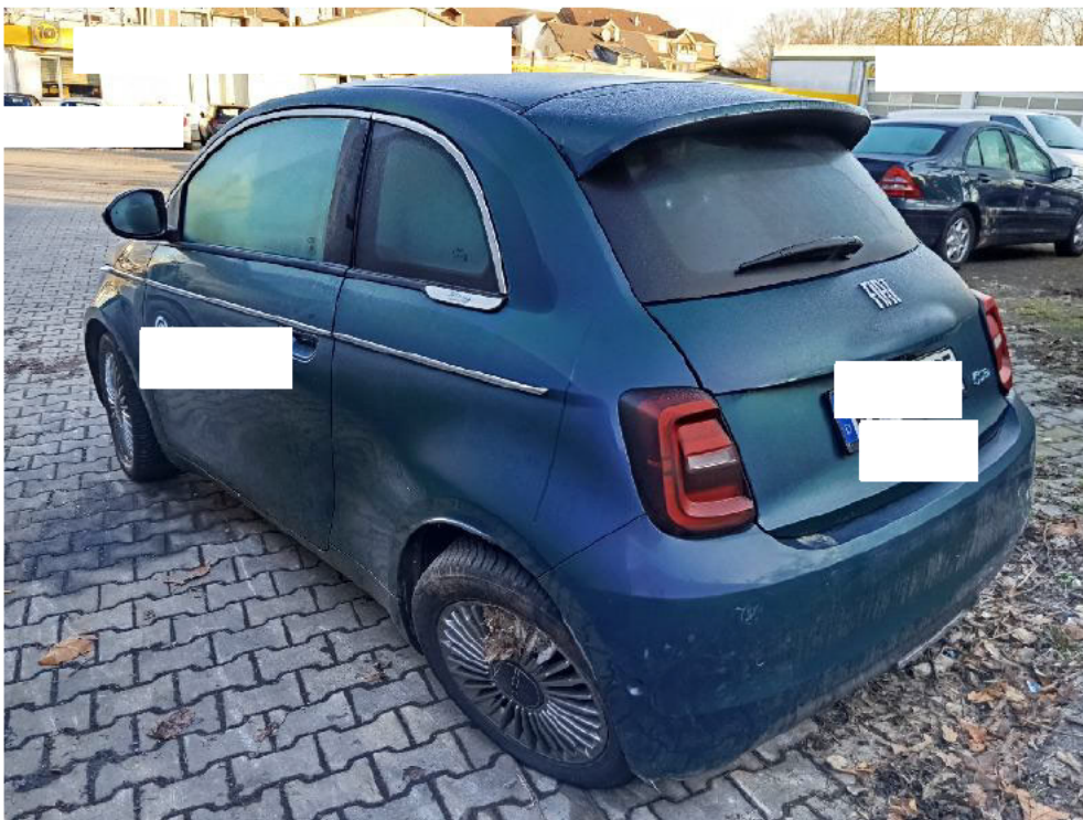
Bild: 4 Diagonale hinten links