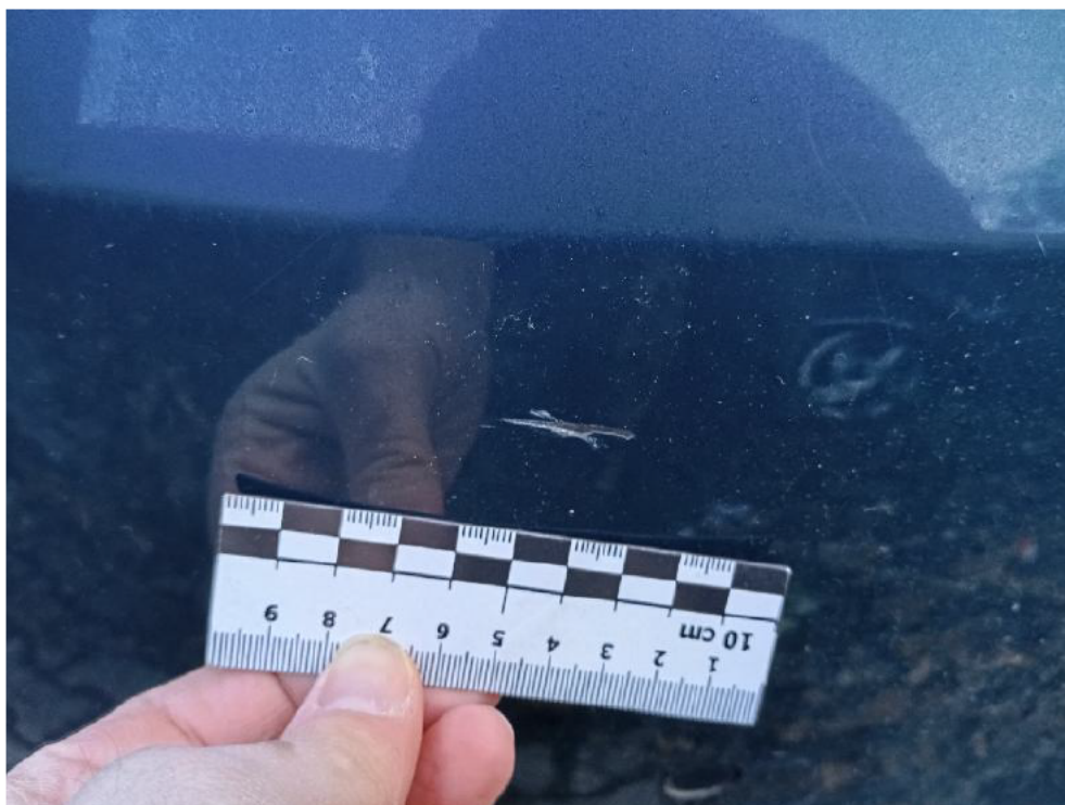
Bild: 47 Altschaden Stoßfänger hinten Lack beschädigt