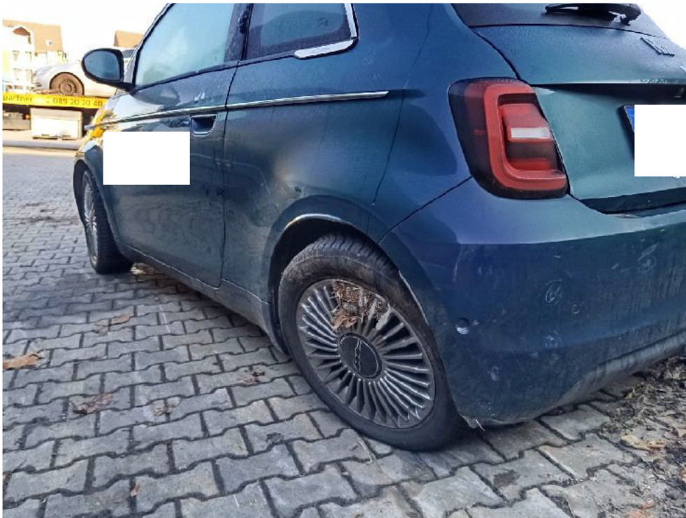
Bild: 9 Übersicht Schadenbereich hinten links