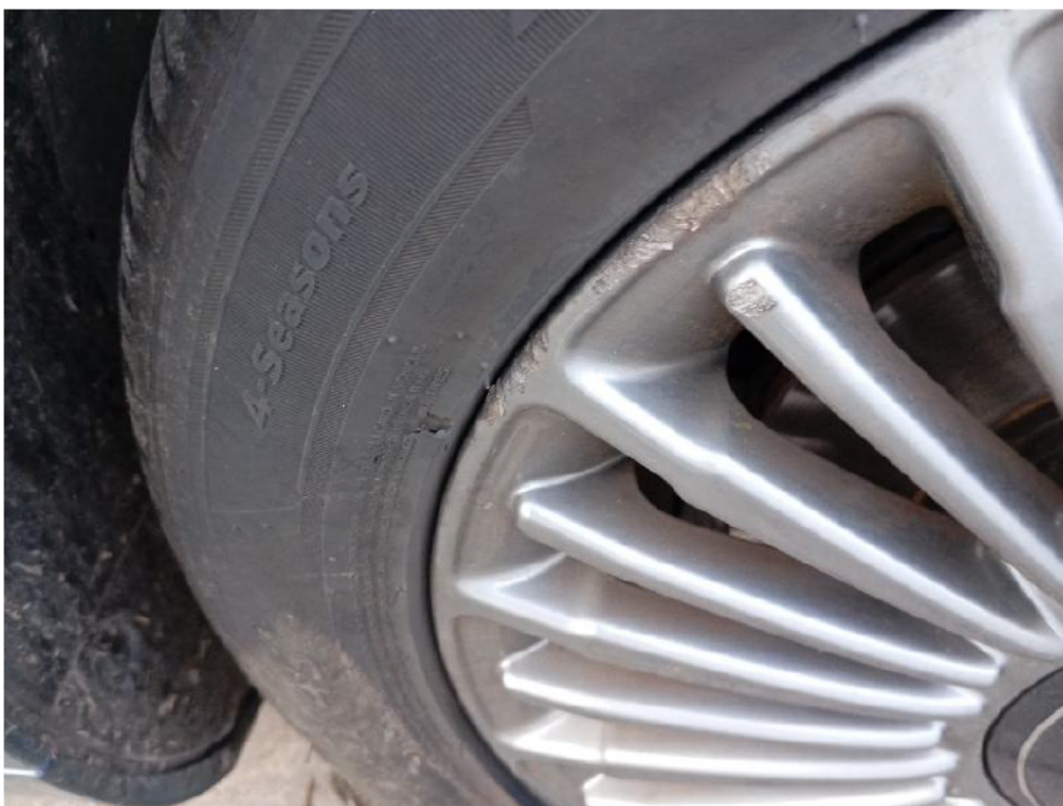
Bild: 21 Rad/Reifen vorne rechts beaufschlagt