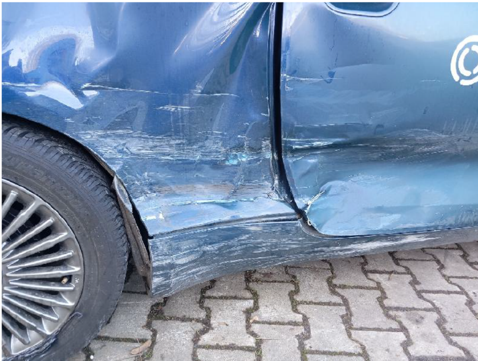
Bild: 33 Schweller rechts deformiert