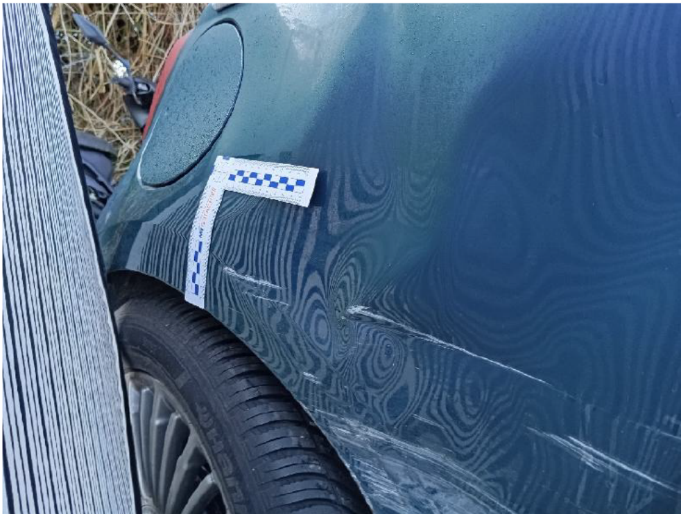
Bild: 31 Seitenwand hinten rechts deformiert