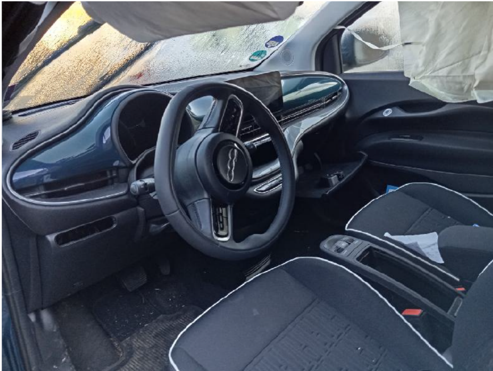
Bild: 7 Innenraum, vorne links