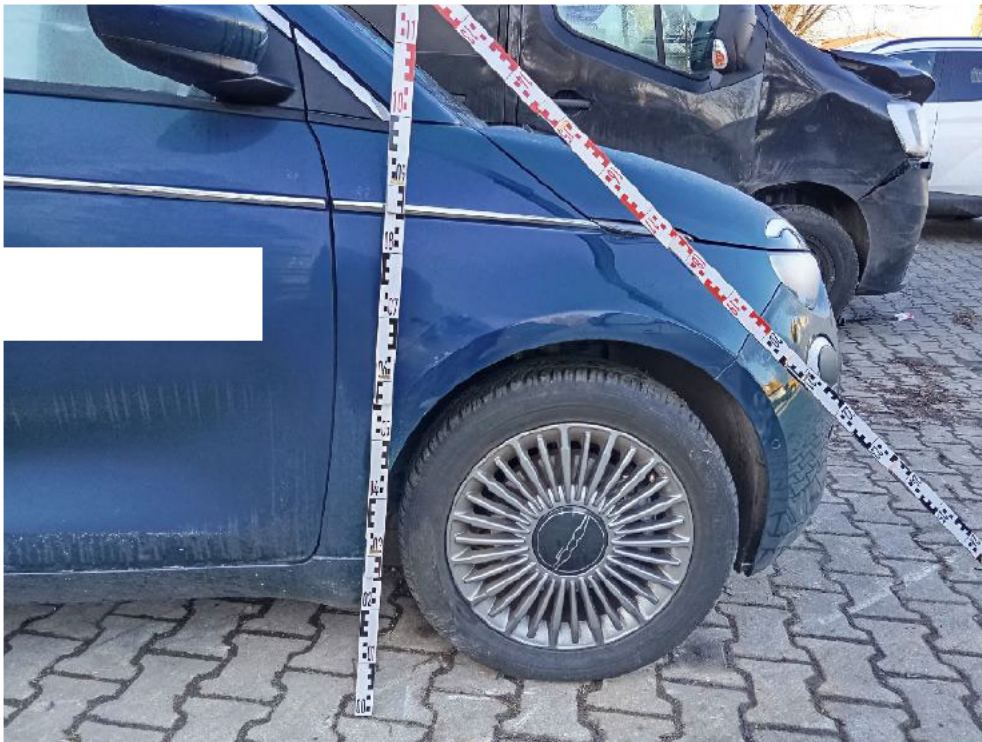
Bild: 13 Übersicht Schadenbereich mit Geometerstab