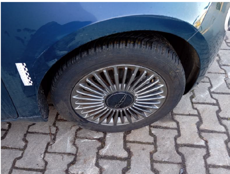
Bild: 19 Rad/Reifen vorne rechts beaufschlagt