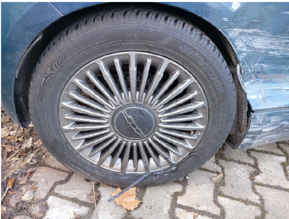
Bild: 36 Rad/Reifen hinten rechts beaufschlagt