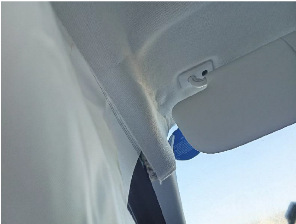
Bild: 41 Innenhimmel deformiert