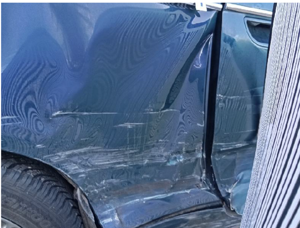
Bild: 28 Seitenwand hinten rechts deformiert