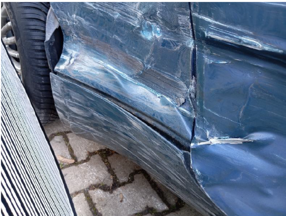
Bild: 32 Seitenwand hinten rechts deformiert