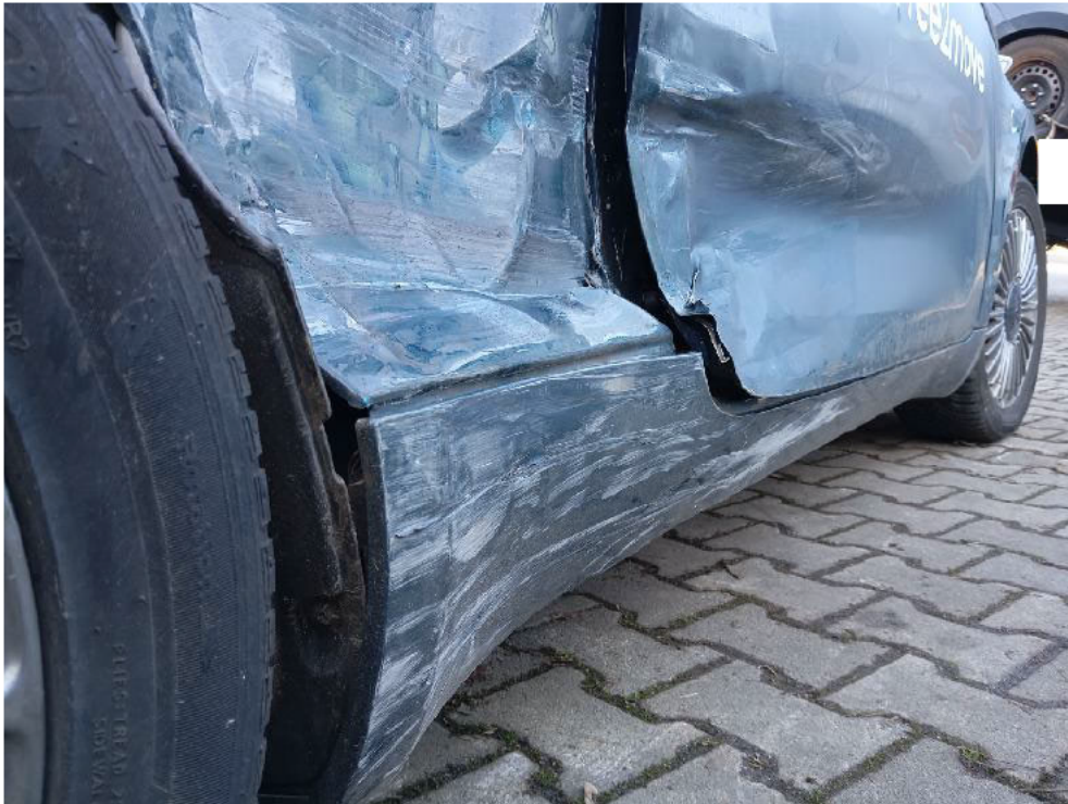
Bild: 35 Schweller rechts deformiert