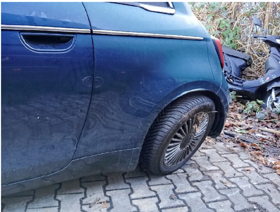
Bild: 10 Übersicht Schadenbereich hinten links