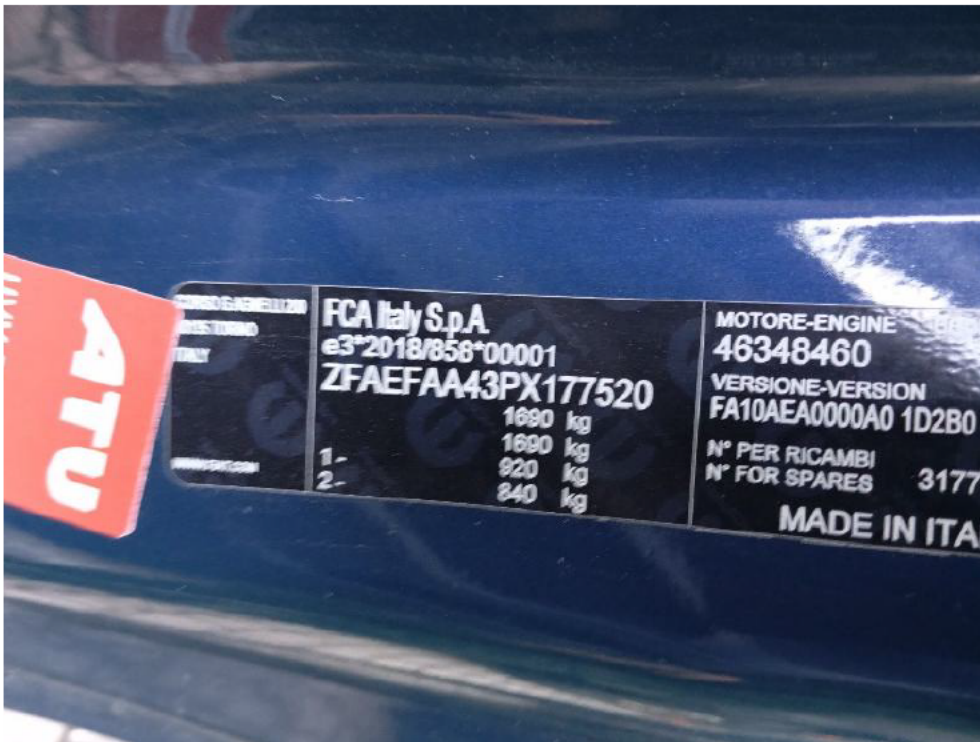
Bild: 6 Fahrzeugidentnummer