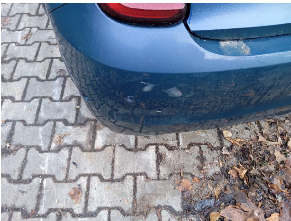
Bild: 46 Altschaden Stoßfänger hinten Lack beschädigt