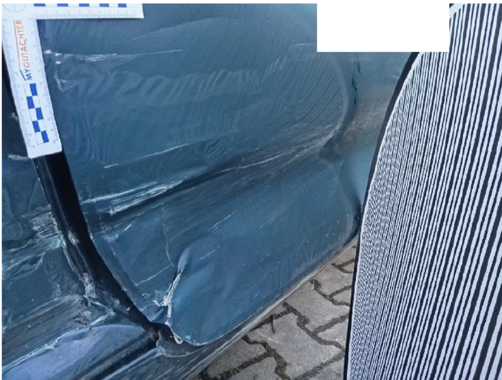
Bild: 26 Tür vorne rechts deformiert