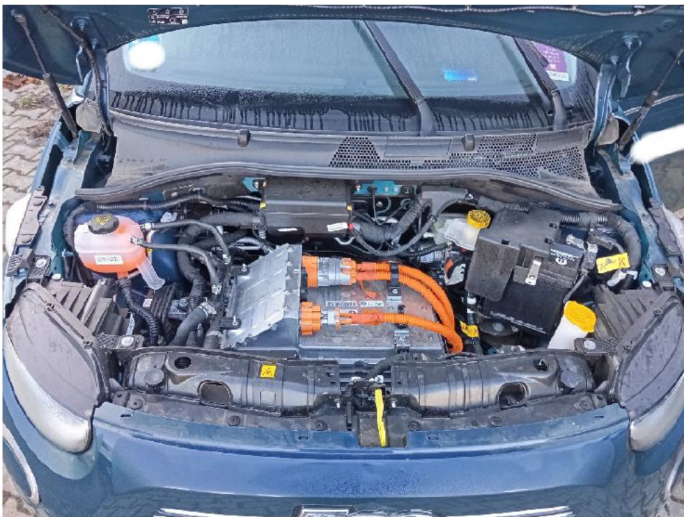
Bild: 8 Motorraum