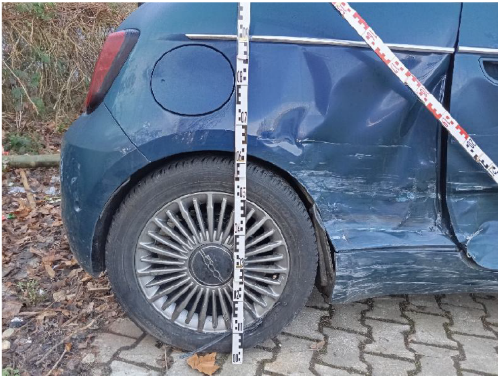
Bild: 15 Übersicht Schadenbereich mit Geometerstab