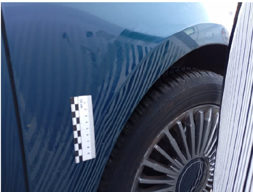
Bild: 23 Kotflügel vorne rechts deformiert