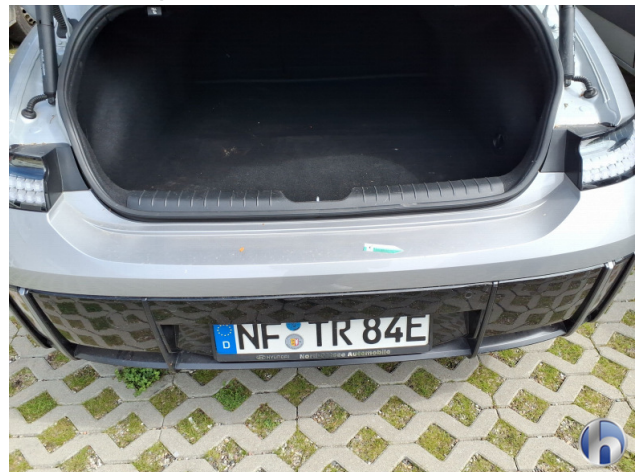
3. Stoßfänger Hinten Kratzer - Smart Repair 120,00 € / 120,00 €