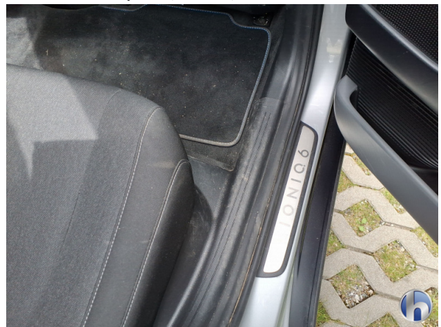
9. Verkleidung Kratzer - Smart Repair 50,00 € / 50,00 €