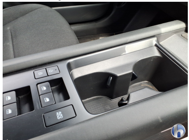
11. Mittelkonsole Innenraum vorne mitte Kratzer - Smart Repair 50,00 € / 50,00 €