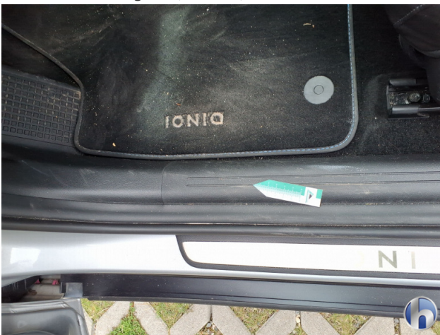
10. Verkleidung Verschmutzt - Reinigen 50,00 € / 50,00 €