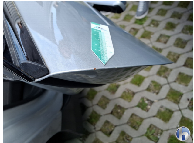
2. Tür Hinten - Rechts Rost - Smart Repair 150,00 € / 150,00 €