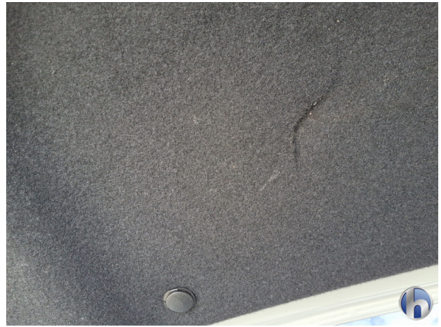
8. Heckdeckelverkleidung Beschädigt - Erneuern 182,60 € / 182,60 €