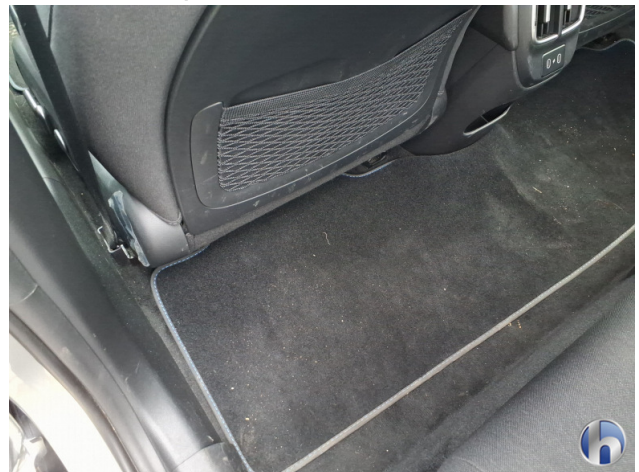
12. Fußraum Innenraum rechts vorne Verschmutzt - Reinigen 50,00 € / 50,00 €