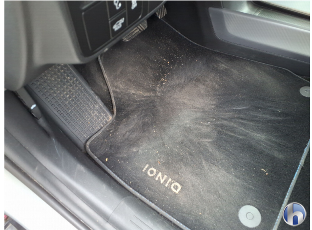
12. Fußraum Innenraum rechts vorne Verschmutzt - Reinigen 50,00 € / 50,00 €