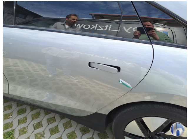
4. Tür Hinten - Links Kratzer - Smart Repair 120,00 € / 120,00 €