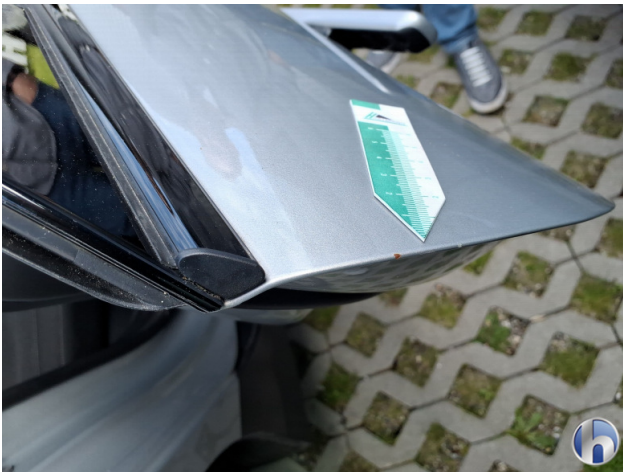
2. Tür Hinten - Rechts Rost - Smart Repair 150,00 € / 150,00 €