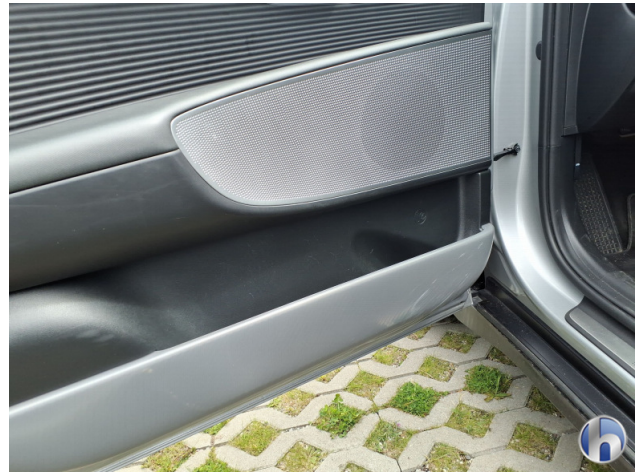
9. Verkleidung Kratzer - Smart Repair 50,00 € / 50,00 €