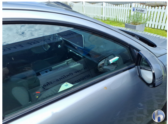
5. Seitenscheibe - Vorne - Rechts Kratzer - Erneuern 820,29 € / 820,29 €