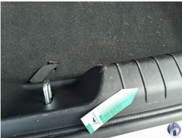
6. Innenraum Gebrauchsspuren - Ohne Reparatur 0,00 € / 0,00 €