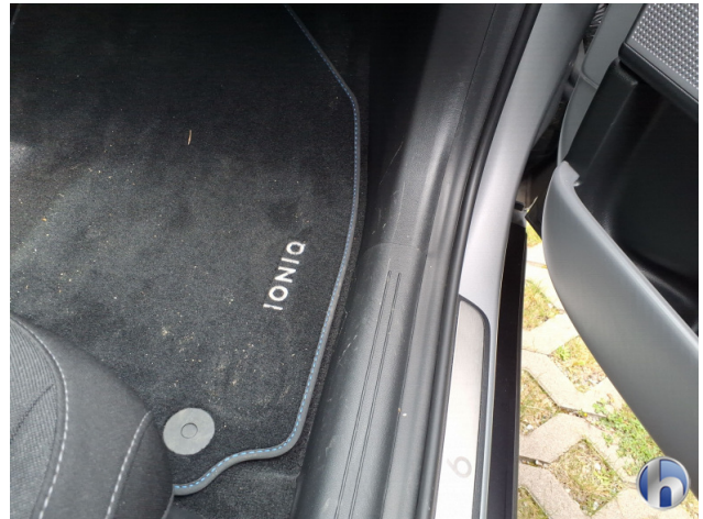
9. Verkleidung Kratzer - Smart Repair 50,00 € / 50,00 €