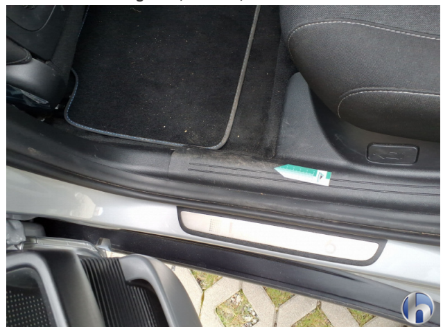
10. Verkleidung Verschmutzt - Reinigen 50,00 € / 50,00 €