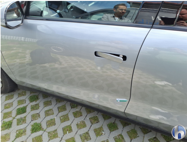
1. Tür Vorne - Links Kratzer - Smart Repair 120,00 € / 120,00 €