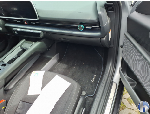
9. Verkleidung Kratzer - Smart Repair 50,00 € / 50,00 €