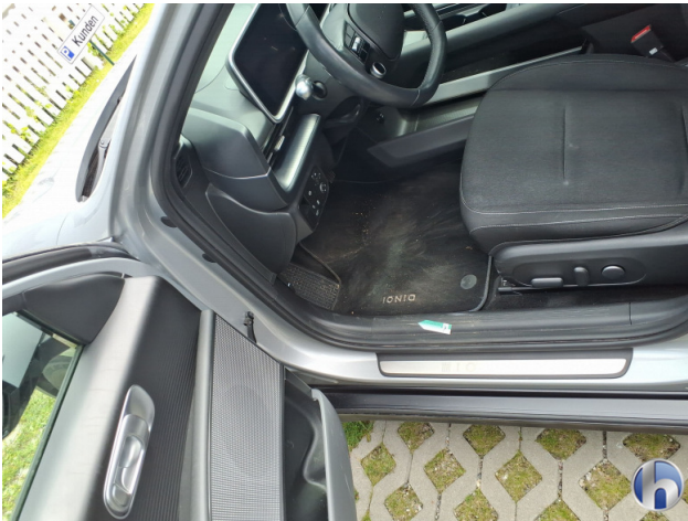
9. Verkleidung Kratzer - Smart Repair 50,00 € / 50,00 €