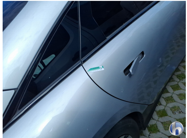
2. Tür Hinten - Rechts Rost - Smart Repair 150,00 € / 150,00 €