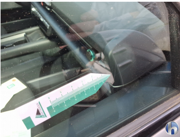
5. Seitenscheibe - Vorne - Rechts Kratzer - Erneuern 820,29 € / 820,29 €