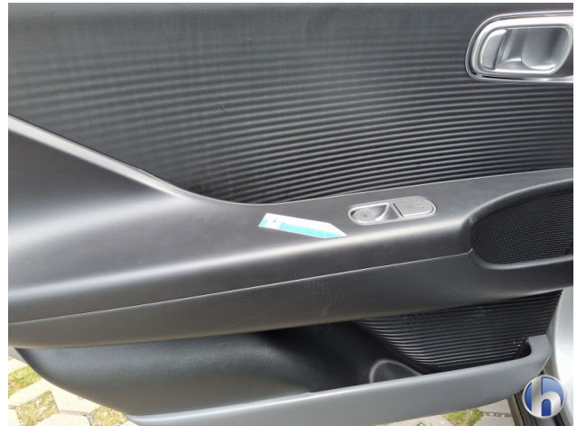
10. Verkleidung Verschmutzt - Reinigen 50,00 € / 50,00 €