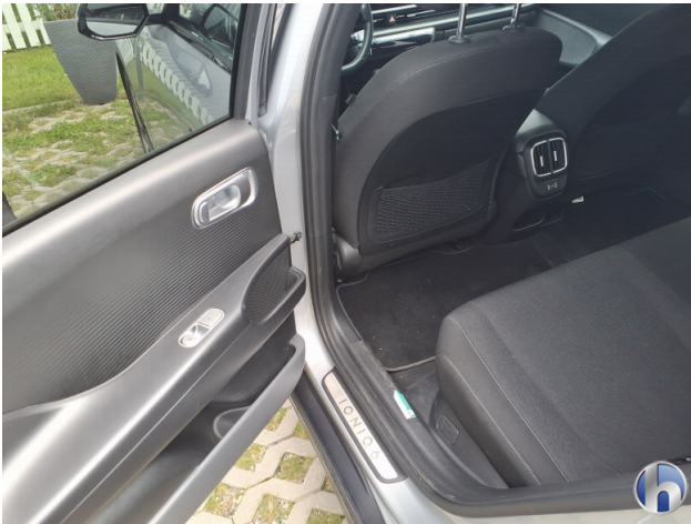
10. Verkleidung Verschmutzt - Reinigen 50,00 € / 50,00 €