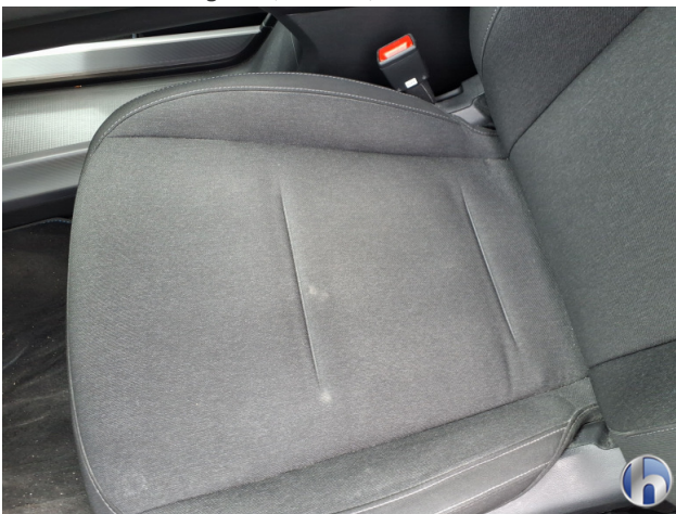
12. Fußraum Innenraum rechts vorne Verschmutzt - Reinigen 50,00 € / 50,00 €