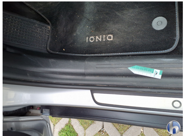
9. Verkleidung Kratzer - Smart Repair 50,00 € / 50,00 €