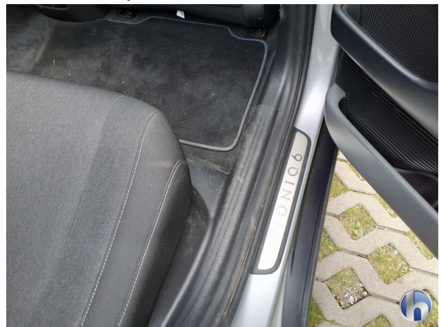
10. Verkleidung Verschmutzt - Reinigen 50,00 € / 50,00 €