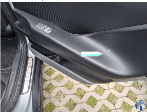
10. Verkleidung Verschmutzt - Reinigen 50,00 € / 50,00 €