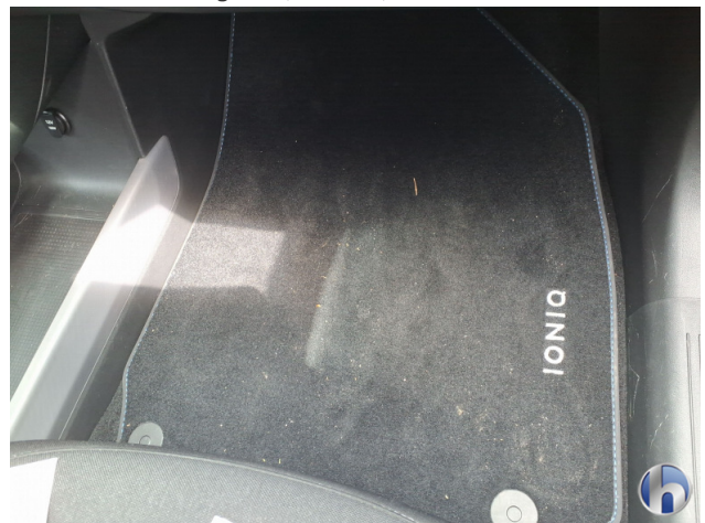
12. Fußraum Innenraum rechts vorne Verschmutzt - Reinigen 50,00 € / 50,00 €