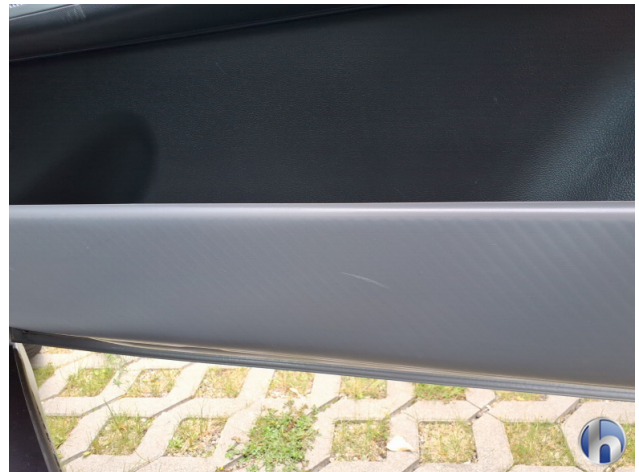
9. Verkleidung Kratzer - Smart Repair 50,00 € / 50,00 €