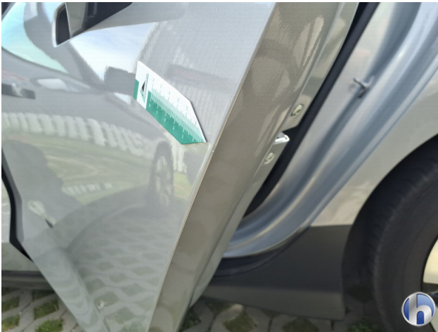
4. Tür Hinten - Links Kratzer - Smart Repair 120,00 € / 120,00 €