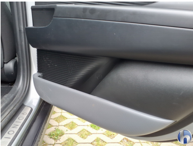
9. Verkleidung Kratzer - Smart Repair 50,00 € / 50,00 €