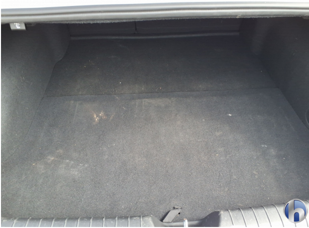
7. Innenraum Verschmutzt - Reinigen 50,00 € / 50,00 €