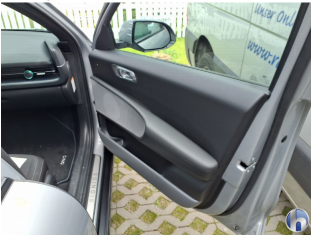
9. Verkleidung Kratzer - Smart Repair 50,00 € / 50,00 €