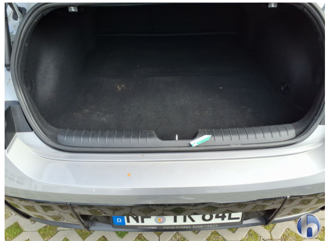
6. Innenraum Gebrauchsspuren - Ohne Reparatur 0,00 € / 0,00 €