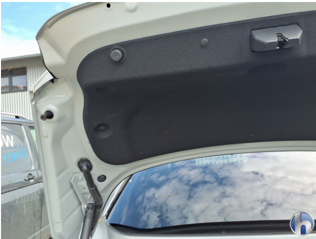
8. Heckdeckelverkleidung Beschädigt - Erneuern 182,60 € / 182,60 €