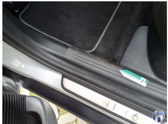
9. Verkleidung Kratzer - Smart Repair 50,00 € / 50,00 €