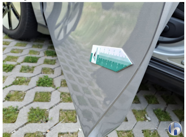
1. Tür Vorne - Links

Kratzer - Smart Repair 120,00 € / 120,00 €