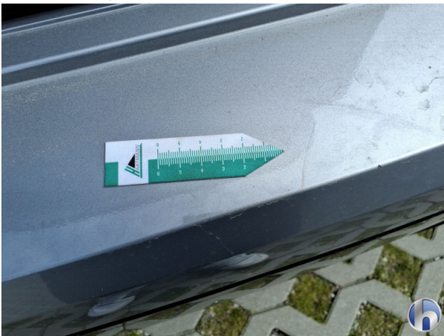
3. Stoßfänger Hinten Kratzer - Smart Repair 120,00 € / 120,00 €