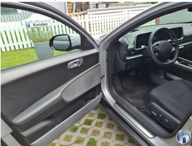
9. Verkleidung Kratzer - Smart Repair 50,00 € / 50,00 €