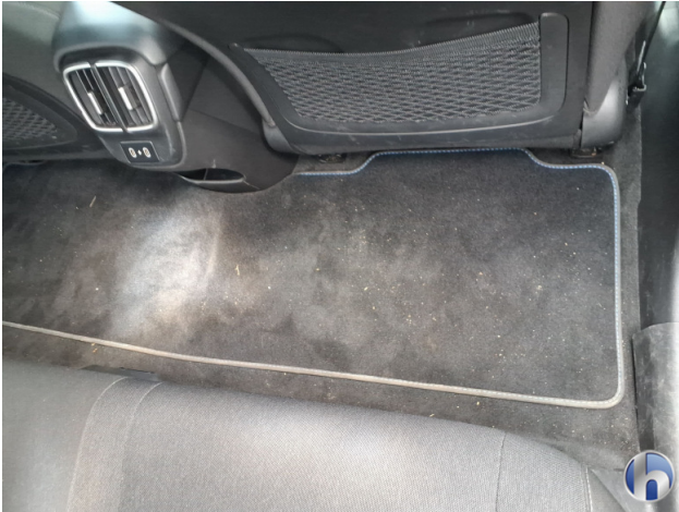
12. Fußraum Innenraum rechts vorne Verschmutzt - Reinigen 50,00 € / 50,00 €