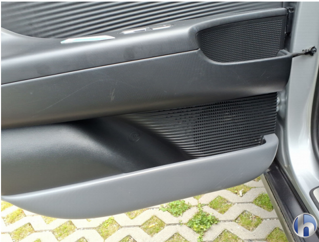
9. Verkleidung Kratzer - Smart Repair 50,00 € / 50,00 €