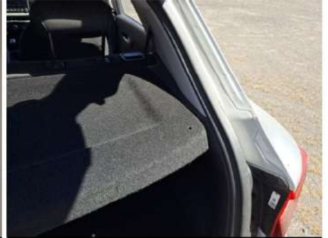
Copribagagli / - / Non conforme