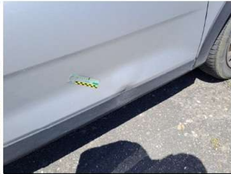
Moda natura porta / Anteriore Destro / Ammaccato vernice incisa