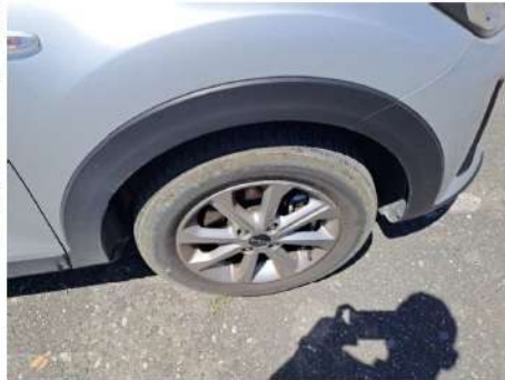
Cerchio in lega / Anteriore Destro / Riga