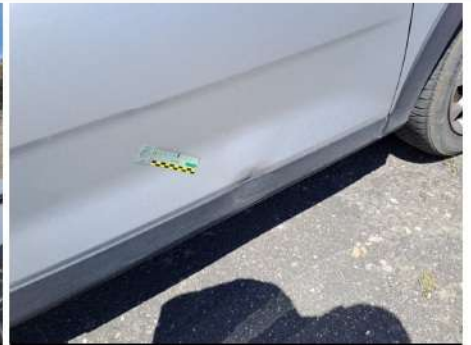
Porta / Anteriore Destro / Ammaccato vernice incisa