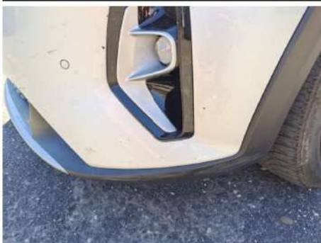
Parte inferiore paraurti / Anteriore / Graffio