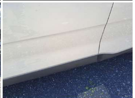
Modanatura porta / Anteriore Sinistro / Graffio