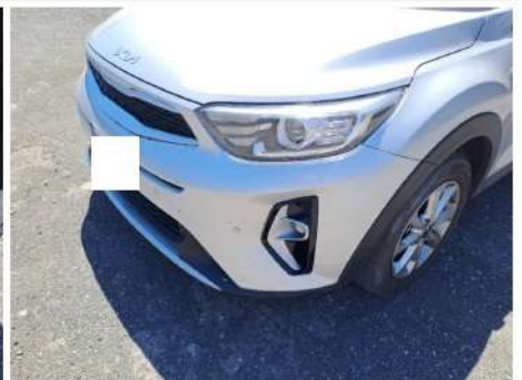
Parte inferiore paraurti / Anteriore / Graffio