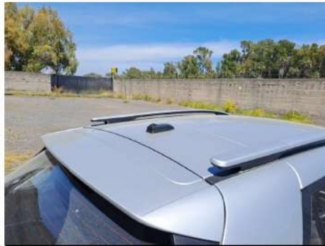
Stab antenna / - / Mancante