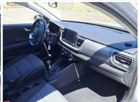
Cruscotto dal sedile posteriore