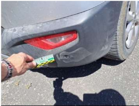
Para urti / Posteriore / Riga