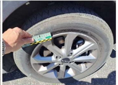
Cerchio in lega / Anteriore Destro / Riga