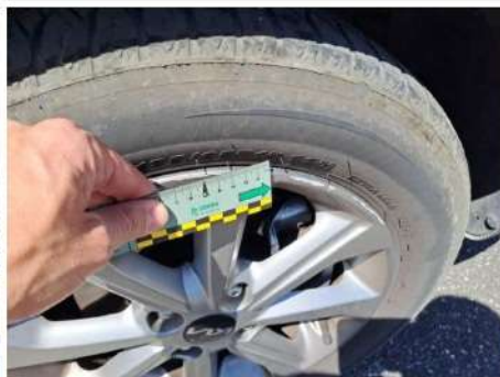
Cerchio in lega / Anteriore Destro / Riga