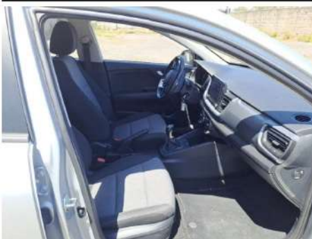
Vano passeggeri anteriore