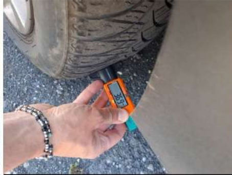
Set pneumatici principale / Anteriore Sinistro