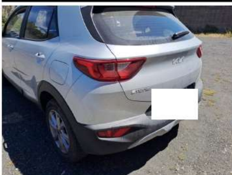
Paraurti / Posteriore / Riga