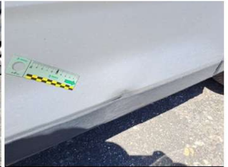
Moda natura porta / Anteriore Destro / Ammaccato vernice incisa