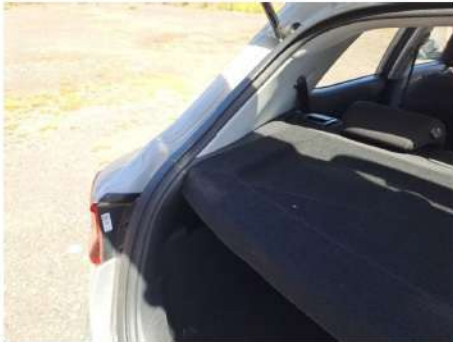
Copribagagli / - / Non conforme