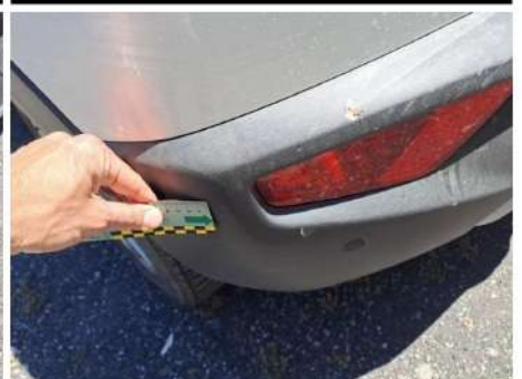
Paraurti / Posteriore / Riga