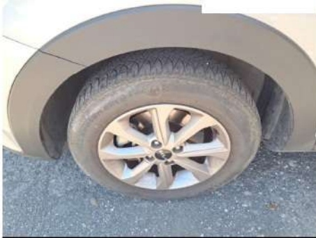
Set pneumatici principale / Anteriore Sinistro