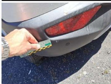
Paraurti / Posteriore / Riga