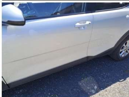
Modanatura porta / Anteriore Sinistro / Graffio