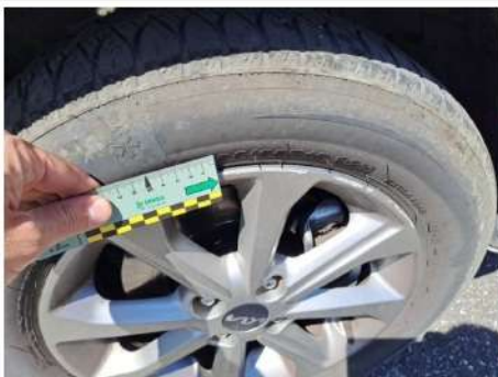
Cerchio in lega / Anteriore Destro / Riga