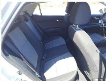
Vano passeggeri posteriore