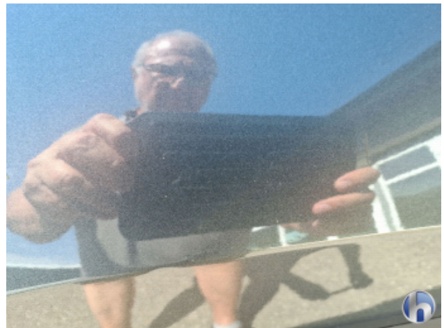
1. Seitenwand - Hinten - Rechts Oberflächenkratzer - Aufbereiten / Polieren