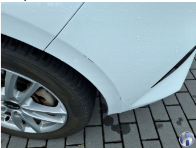
1. Seitenwand - Hinten - Links Kratzer - Lackieren