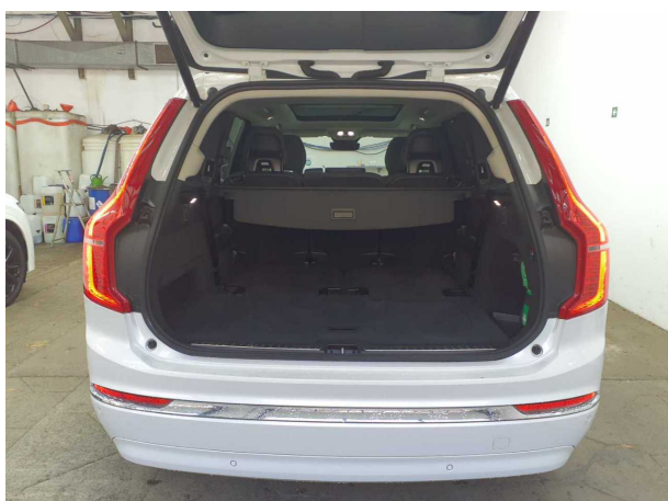
Abbildung 5: Laderaum