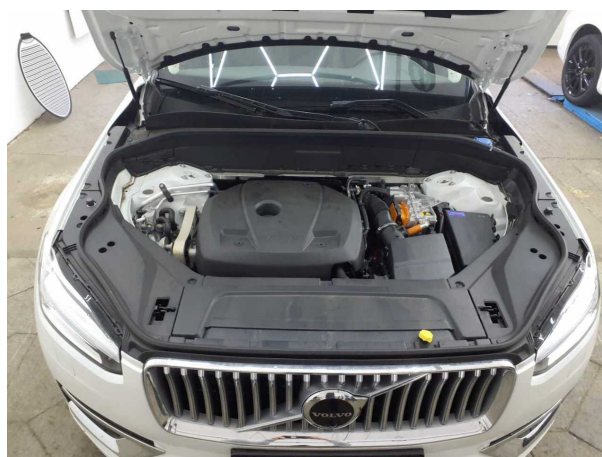
Abbildung 6: Motorraum