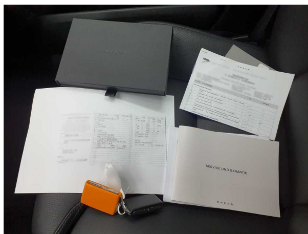
Abbildung 16: Sonstiges