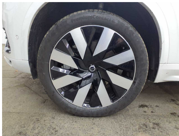
Abbildung 14: Montierte Bereifung