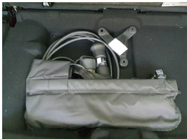
Abbildung 17: Sonstiges