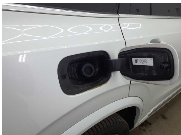
Abbildung 15: Ladebuchse/Tankstutzen