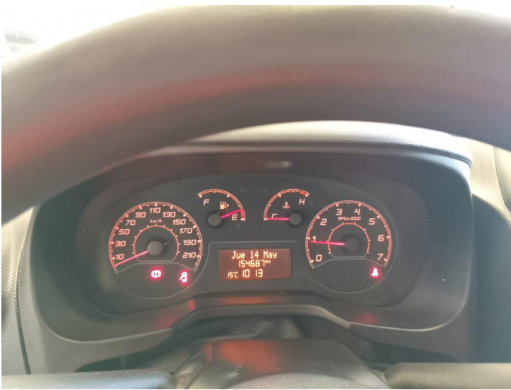
WhatsApp Image 2026-05-14 at 11.11.51.jpeg