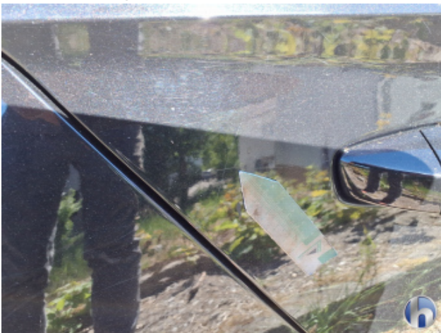
4. Tür Hinten - Rechts Kratzer - Smart Repair