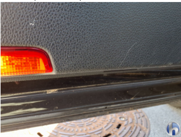
7. Verkleidung Gebrauchsspuren - Ohne Reparatur