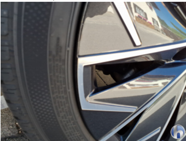
6. Felge Hinten - Links Gebrauchsspuren - Ohne Reparatur