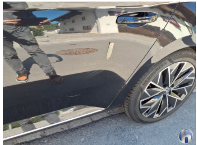
1. Tür Hinten - Links Kratzer - Lackieren