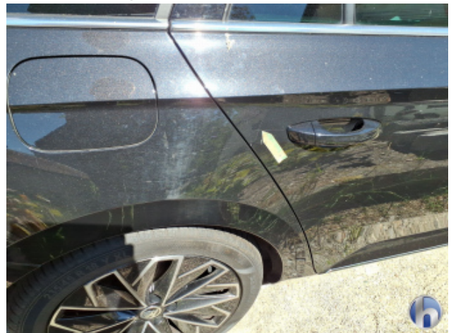
4. Tür Hinten - Rechts Kratzer - Smart Repair