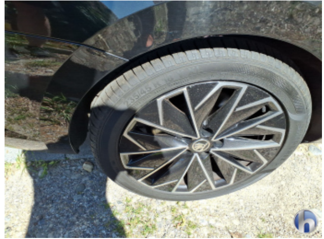
2. Felge Hinten - Rechts Kratzer - Smart Repair