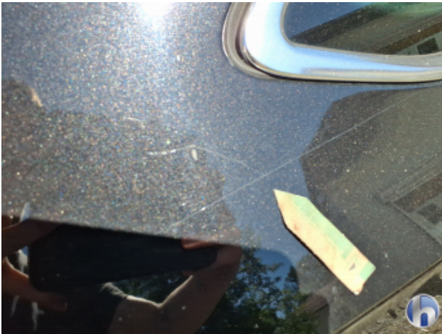
5. Seitenwand - Hinten - Rechts Kratzer - Smart Repair