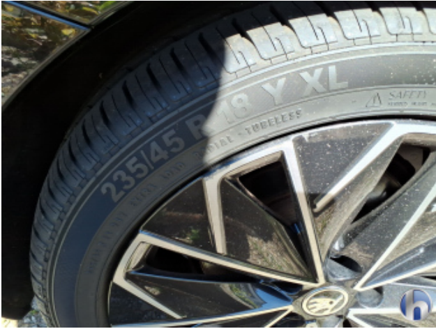
2. Felge Hinten - Rechts Kratzer - Smart Repair