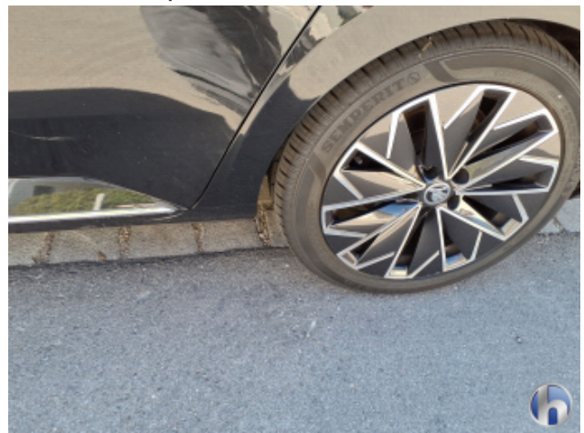
6. Felge Hinten - Links Gebrauchsspuren - Ohne Reparatur