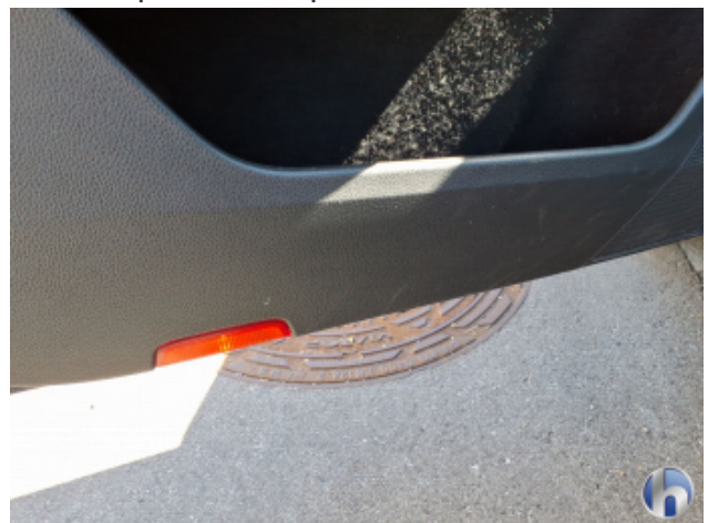
7. Verkleidung Gebrauchsspuren - Ohne Reparatur