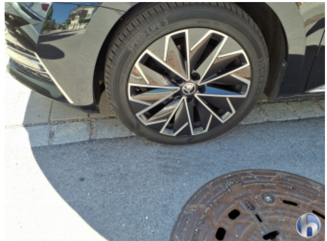
3. Felge Vorne - Links Kratzer - Smart Repair