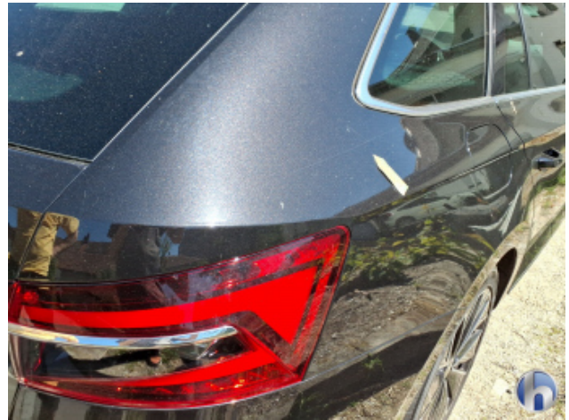
5. Seitenwand - Hinten - Rechts Kratzer - Smart Repair