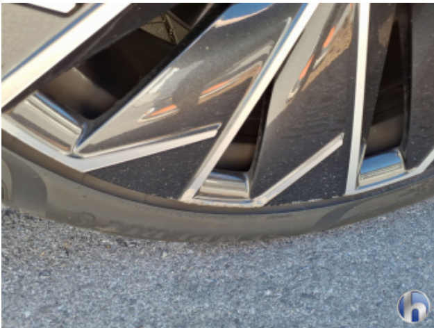
3. Felge Vorne - Links Kratzer - Smart Repair