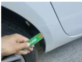
Puerta Tras Dr Rayado Reparar + Pintar