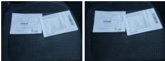
Manual de mantenimiento Falta Importe