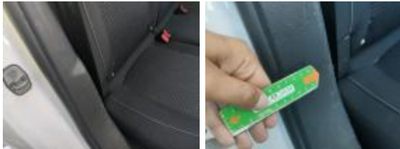
Guarnic Tapa Tras Rayado Importe