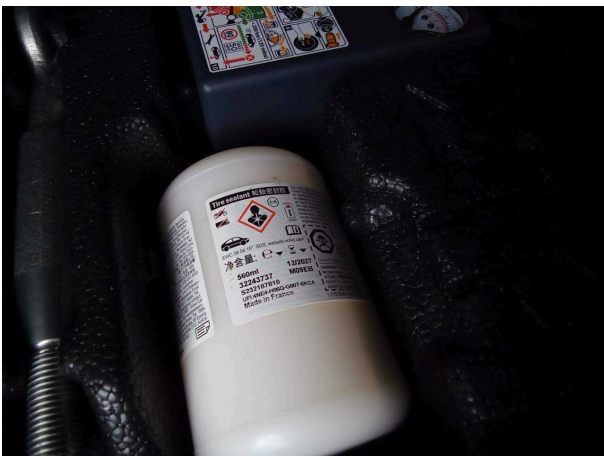
Abbildung 17: Sonstiges