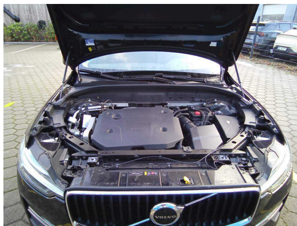
Abbildung 6: Motorraum