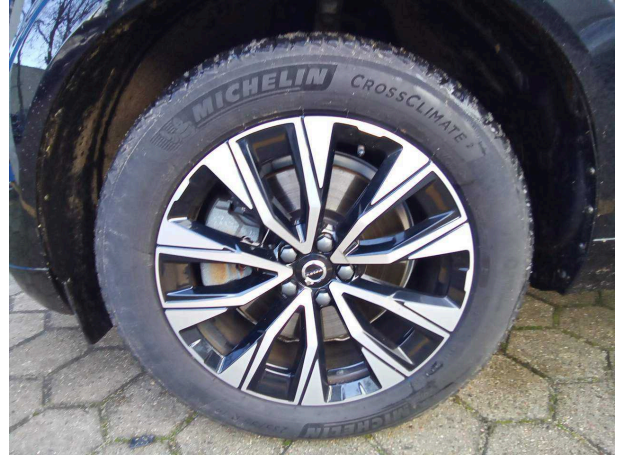
Abbildung 14: Montierte Bereifung