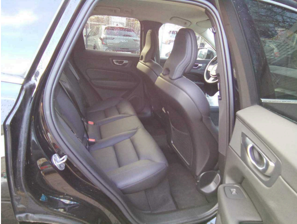
Abbildung 13: Innenraum hinten