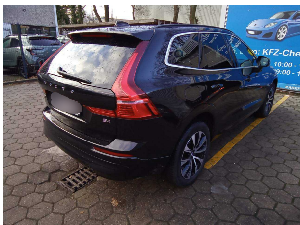
Abbildung 3: Schräg hinten