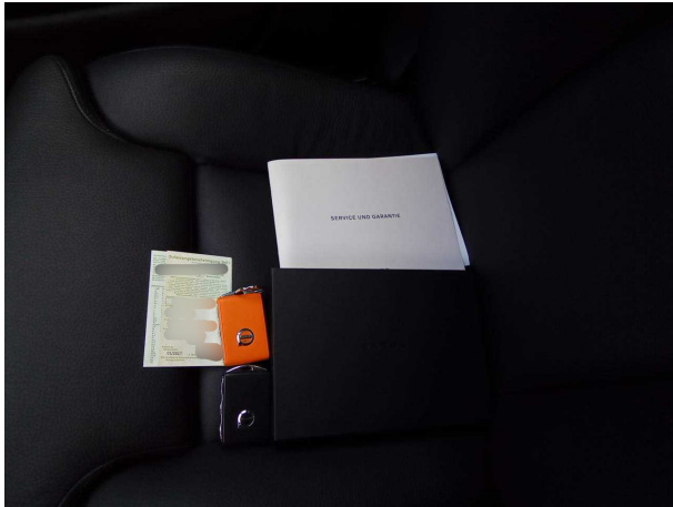
Abbildung 19: Sonstiges