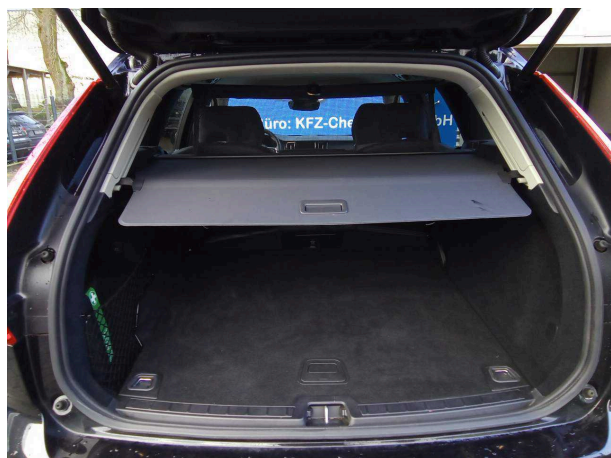
Abbildung 5: Laderraum