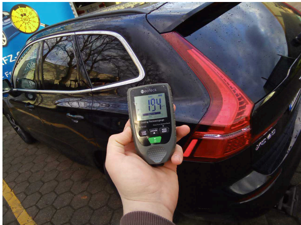
Nachlackierung 1: Seitenwand links