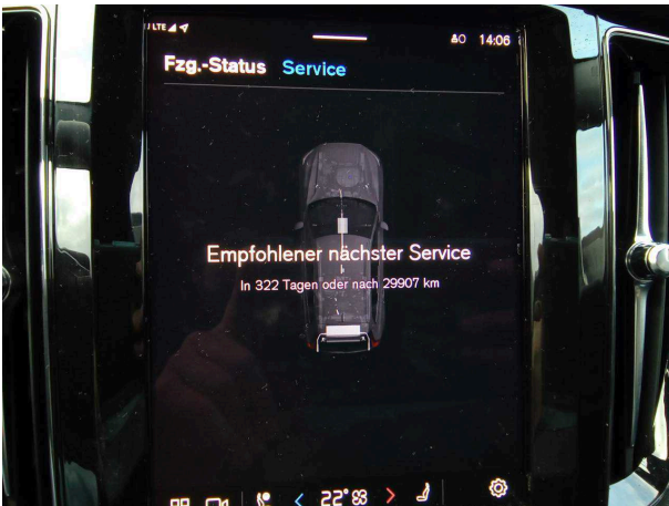
Abbildung 15: Sonstiges