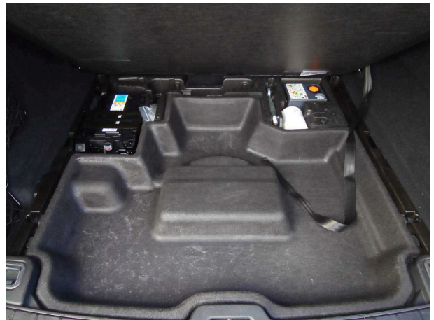
Abbildung 16: Sonstiges