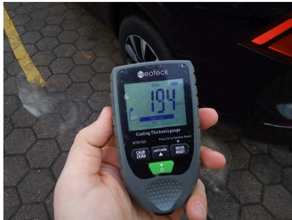
Nachlackierung 1: Seitenwand links