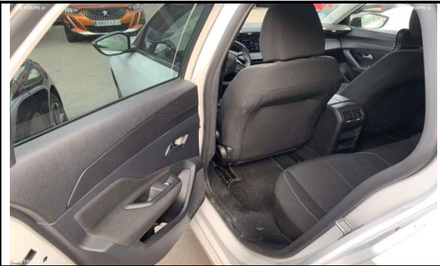
Foto daños internos 27