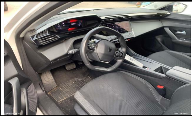
Foto daños internos 27