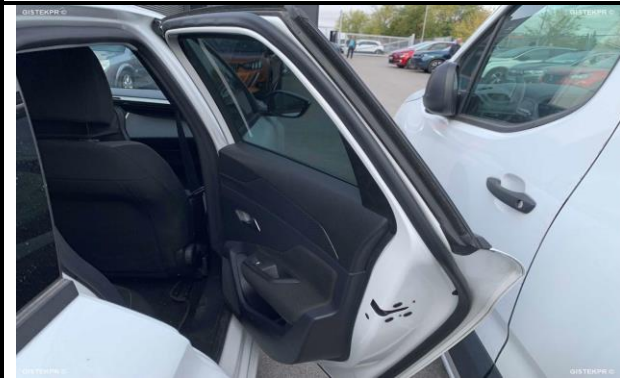
Foto daños internos 27