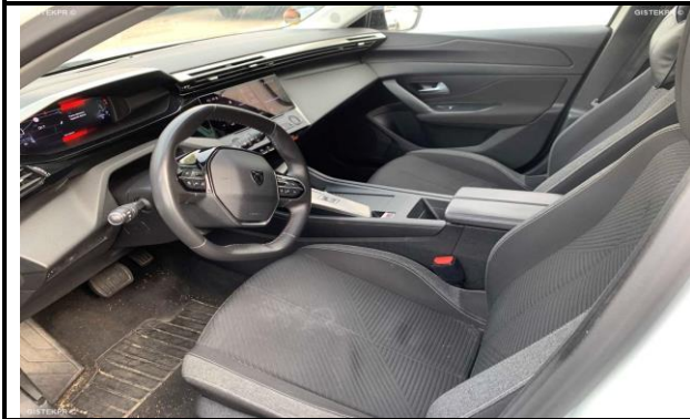
Foto daños internos 27