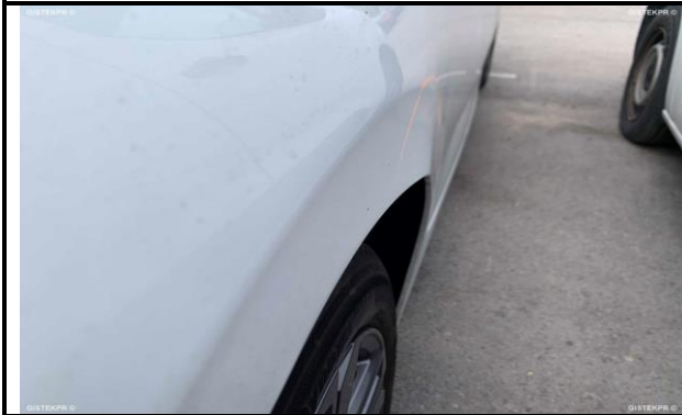
Foto daños externos 1