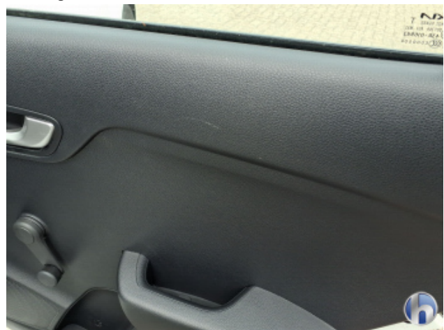
1. Verkleidung Gebrauchsspuren - Ohne Reparatur