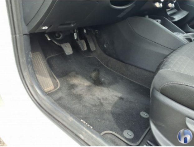
2. Fußraum Innenraum links vorne Verschmutzt - Reinigen