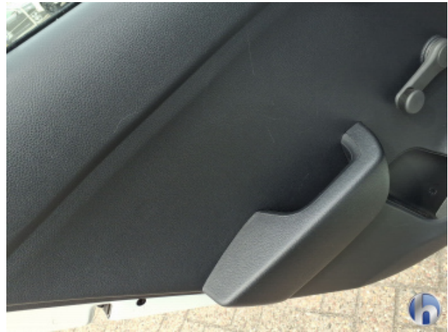
1. Verkleidung Gebrauchsspuren - Ohne Reparatur