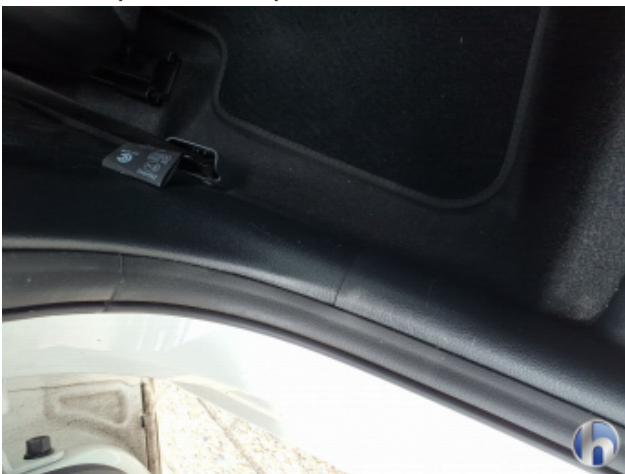
1. Verkleidung Gebrauchsspuren - Ohne Reparatur