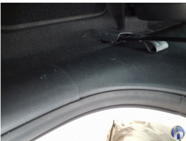
1. Verkleidung Gebrauchsspuren - Ohne Reparatur