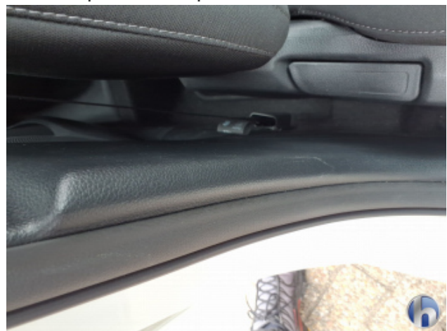
1. Verkleidung Gebrauchsspuren - Ohne Reparatur