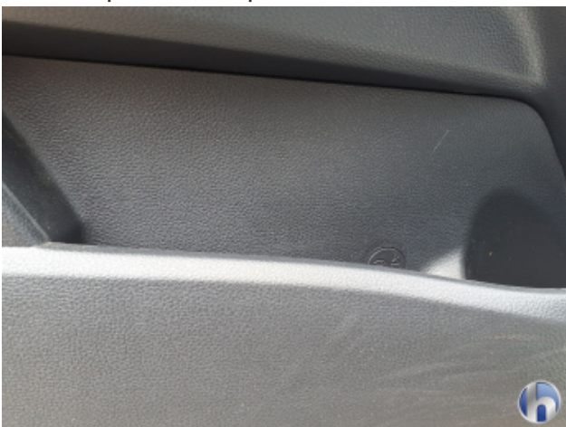
1. Verkleidung Gebrauchsspuren - Ohne Reparatur