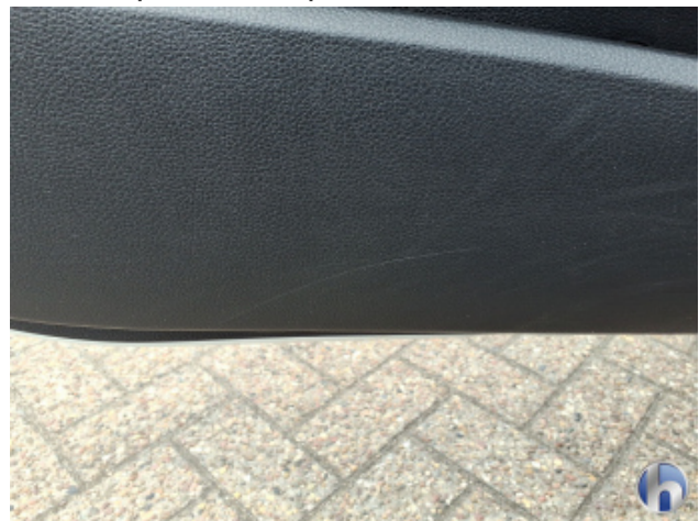
1. Verkleidung Gebrauchsspuren - Ohne Reparatur