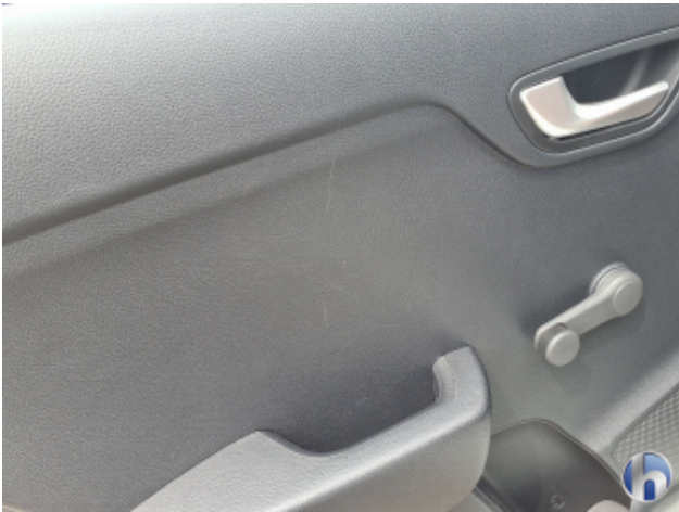
1. Verkleidung Gebrauchsspuren - Ohne Reparatur