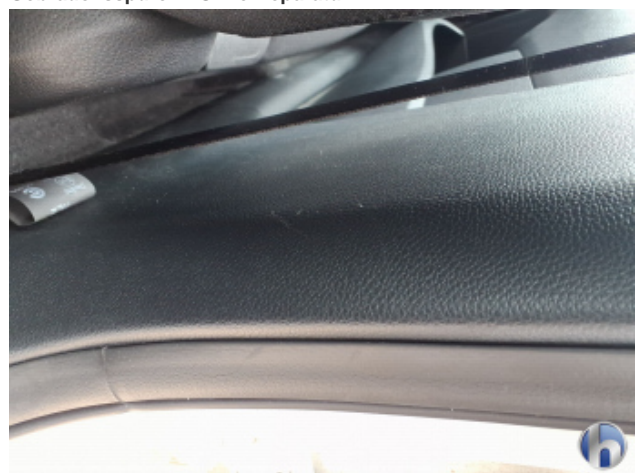
1. Verkleidung Gebrauchsspuren - Ohne Reparatur