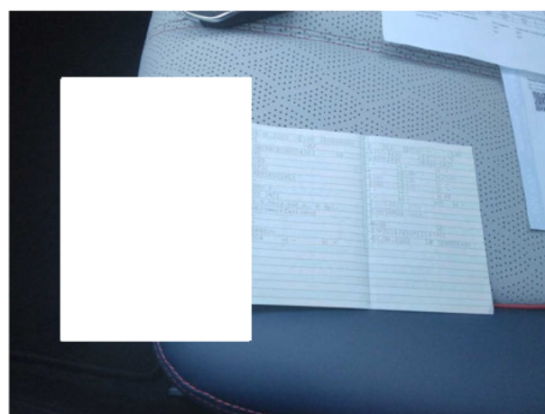
Abbildung 12: Zulassungsdokument(e)