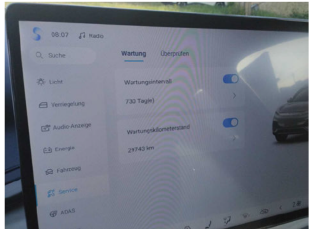
Abbildung 16: Sonstiges