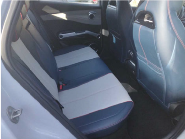
Abbildung 13: Innenraum hinten