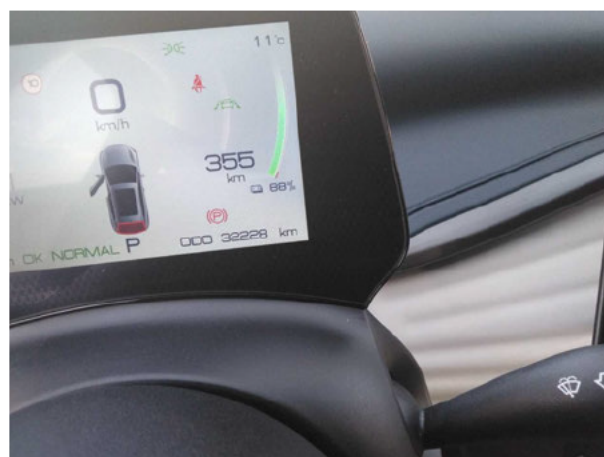
Abbildung 10: Laufleistung