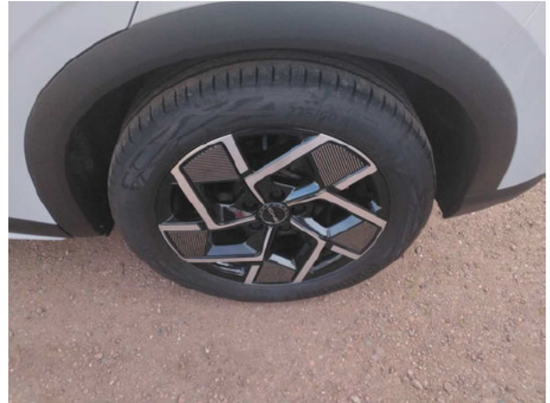
Abbildung 14: Montierte Bereifung