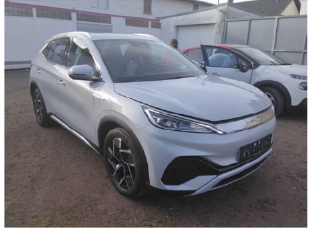
Abbildung 2: Schräg vorne