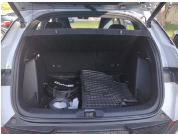
Abbildung 5: Laderaum