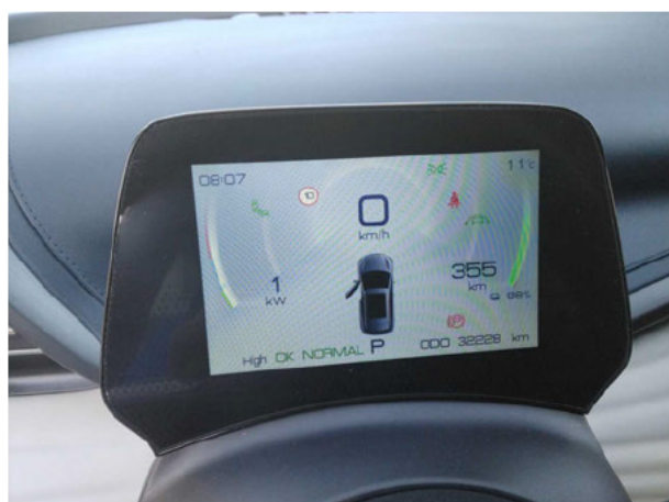
Abbildung 9: Kombiinstrument