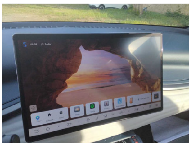
Abbildung 11: Instrumententafel