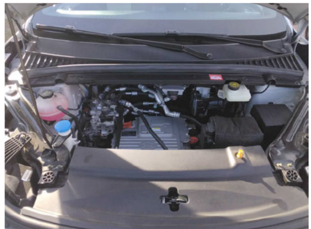
Abbildung 6: Motorraum