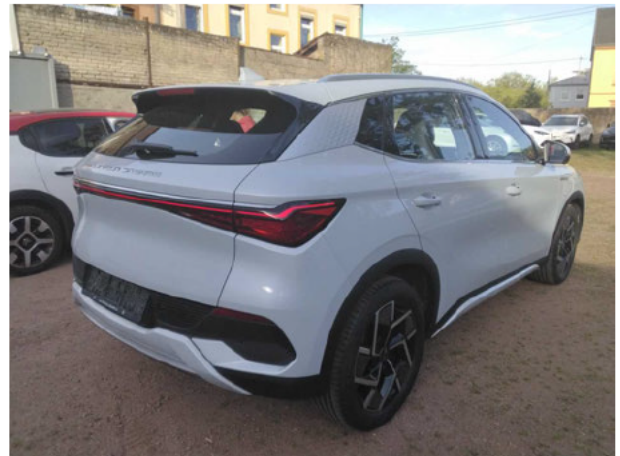
Abbildung 4: Schräg hinten