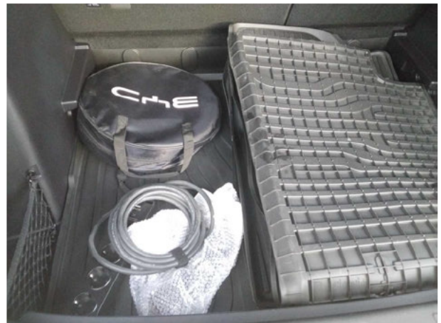
Abbildung 18: Sonstiges