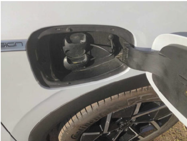
Abbildung 15: Ladebuchse/Tankstutzen