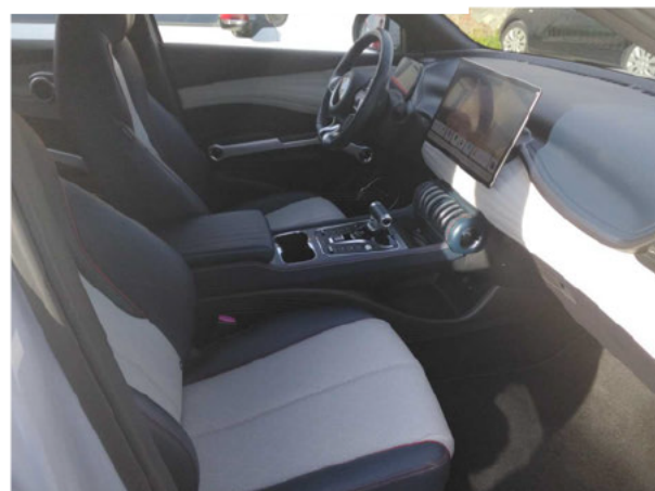
Abbildung 8: Innenraum vorne