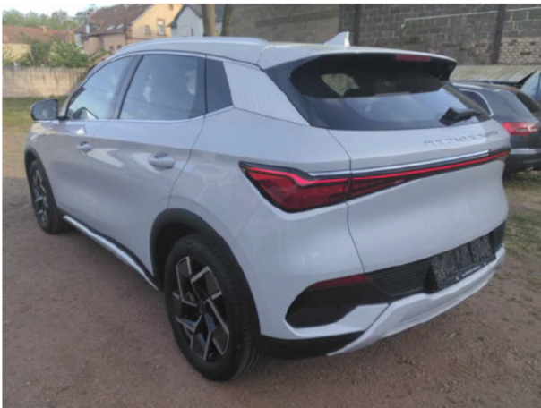
Abbildung 3: Schräg hinten