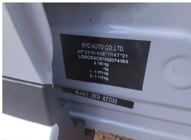
Abbildung 7: FIN