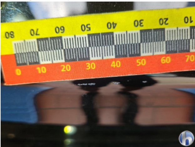
3. Heckklappe Kratzer - Smart Repair