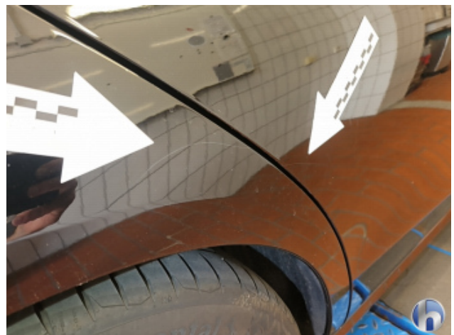
5. Tür und Seitenwand Hinten - Rechts Kratzer - Lackieren