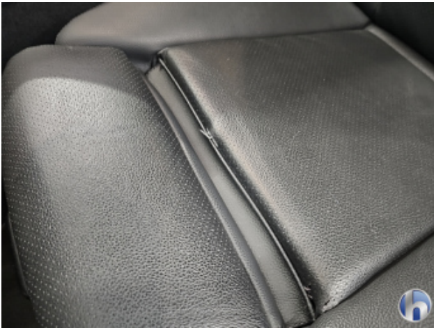
4. Sitz - Vorne - Links: Kissen Riss - Erneuern