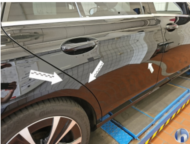
5. Tür und Seitenwand Hinten - Rechts Kratzer - Lackieren