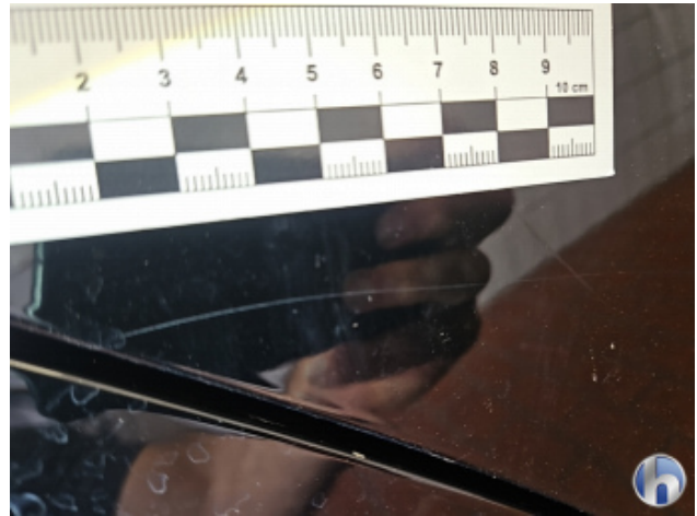
5. Tür und Seitenwand Hinten - Rechts Kratzer - Lackieren