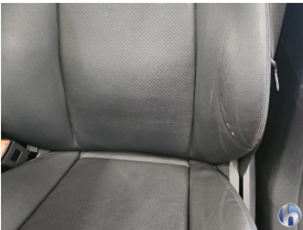
4. Sitz - Vorne - Links: Kissen Riss - Erneuern