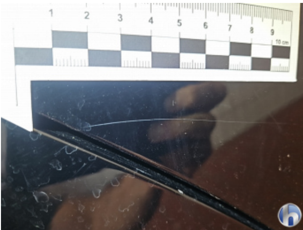
5. Tür und Seitenwand Hinten - Rechts Kratzer - Lackieren