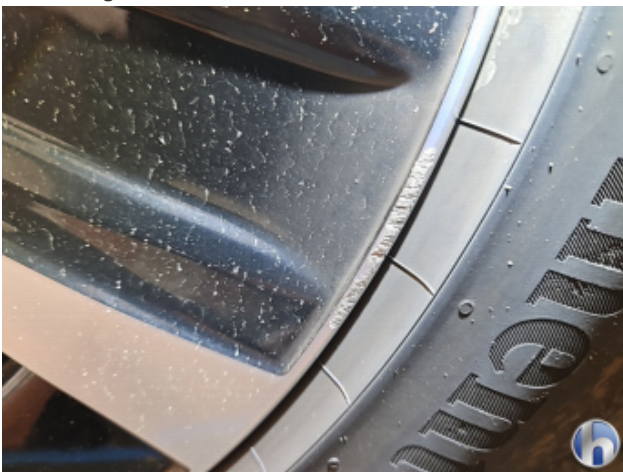
2. Felge Vorne - Rechts Beschädigt - Smart Repair