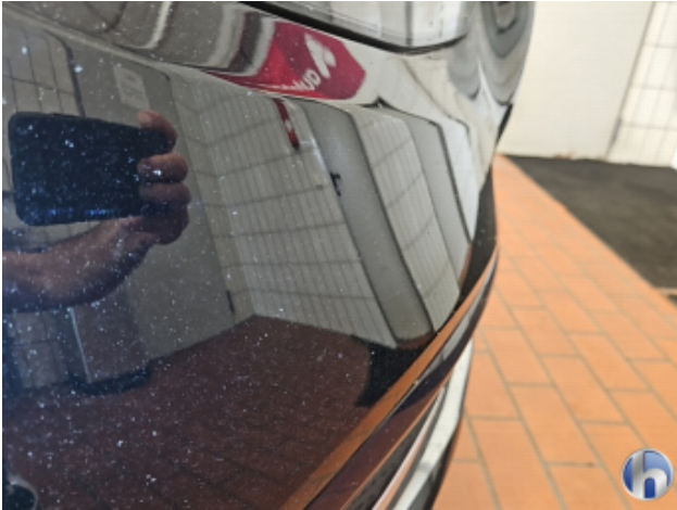
1. Stoßfänger Vorne Steinschlag - Lackieren