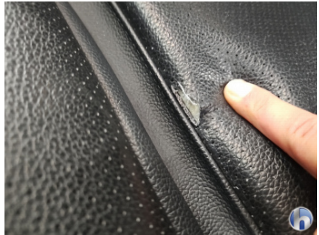
4. Sitz - Vorne - Links: Kissen Riss - Erneuern