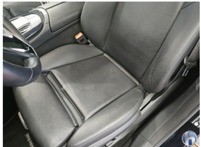
4. Sitz - Vorne - Links: Kissen Riss - Erneuern