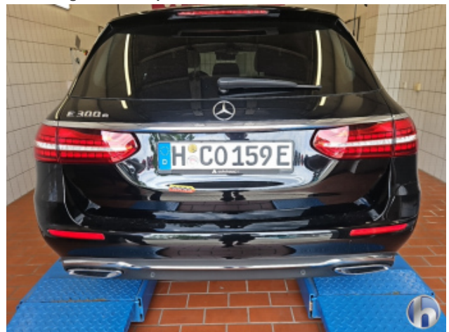
3. Heckklappe Kratzer - Smart Repair