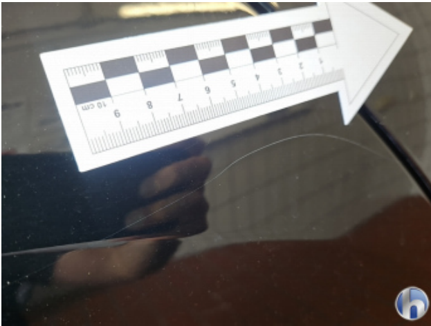
5. Tür und Seitenwand Hinten - Rechts Kratzer - Lackieren