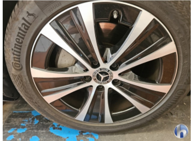
2. Felge Vorne - Rechts Beschädigt - Smart Repair