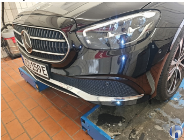
1. Stoßfänger Vorne Steinschlag - Lackieren