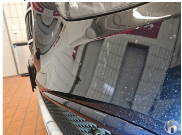
1. Stoßfänger Vorne Steinschlag - Lackieren