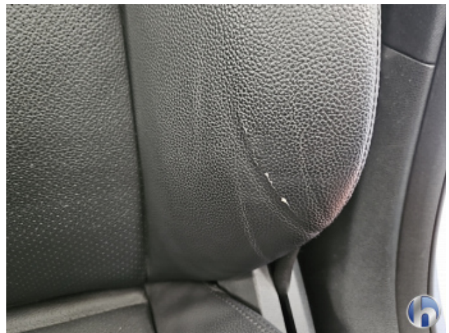
4. Sitz - Vorne - Links: Kissen Riss - Erneuern