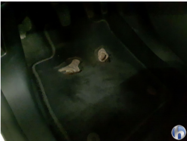
1. Teppich Innenraum Beschädigt - Erneuern