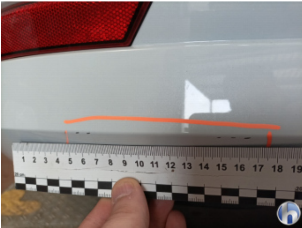
2. Stoßfänger Hinten Kratzer - Lackieren