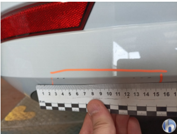
2. Stoßfänger Hinten Kratzer - Lackieren