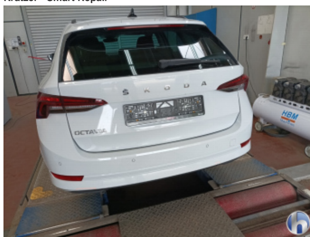
2. Stoßfänger Hinten Kratzer - Lackieren