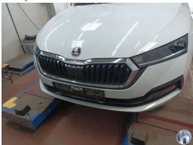
1. Stoßfänger Vorne Kratzer - Smart Repair