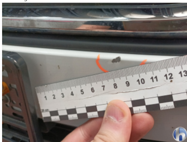
1. Stoßfänger Vorne Kratzer - Smart Repair