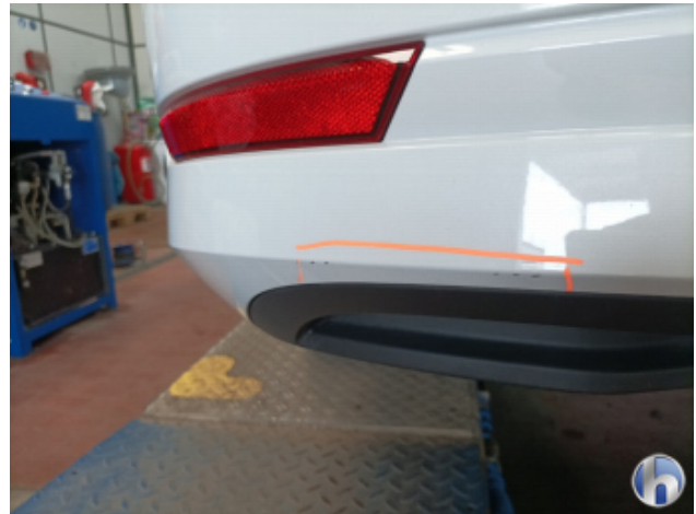
2. Stoßfänger Hinten Kratzer - Lackieren