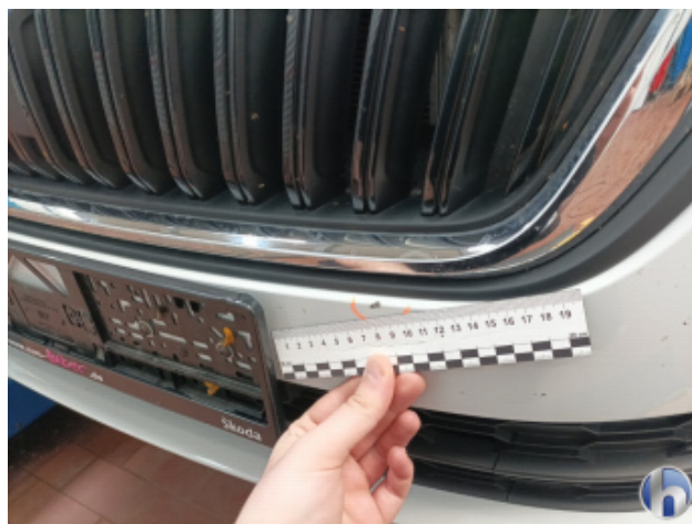
1. Stoßfänger Vorne Kratzer - Smart Repair