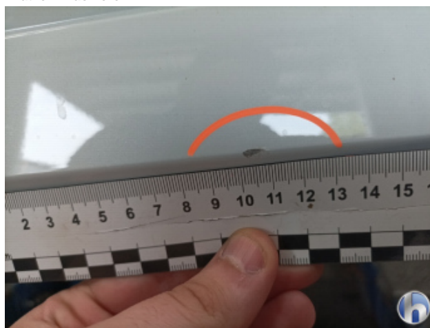
2. Stoßfänger Hinten Kratzer - Lackieren