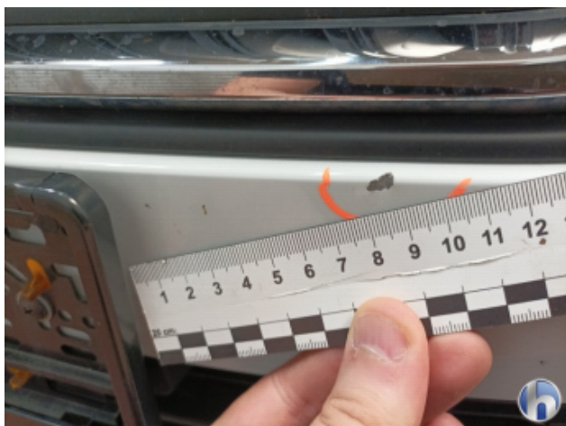
1. Stoßfänger Vorne Kratzer - Smart Repair