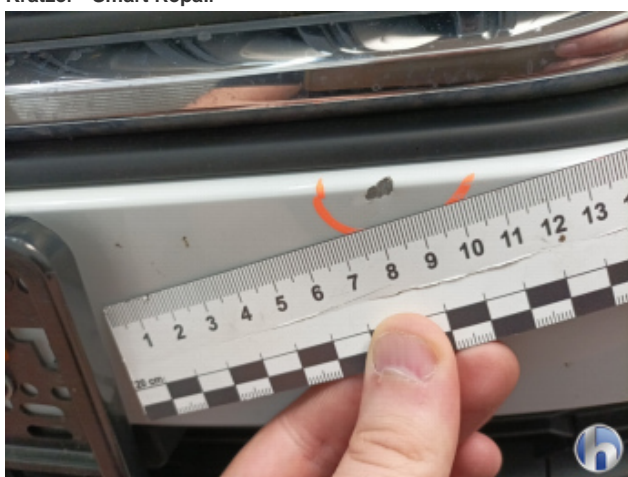
1. Stoßfänger Vorne Kratzer - Smart Repair