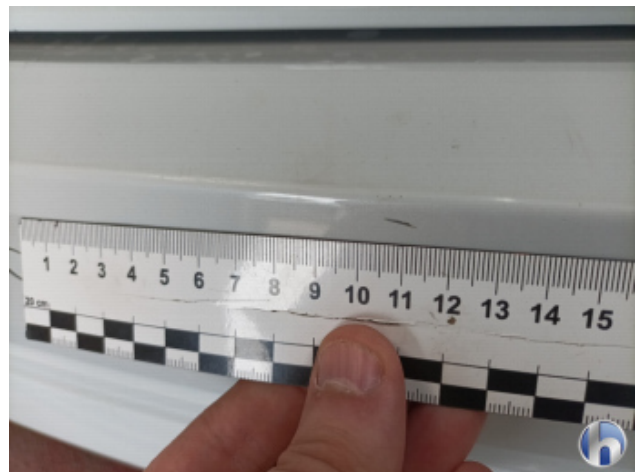
2. Stoßfänger Hinten Kratzer - Lackieren