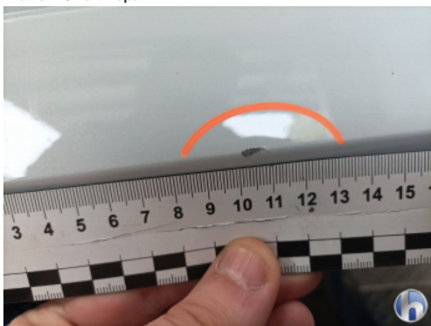
2. Stoßfänger Hinten Kratzer - Lackieren